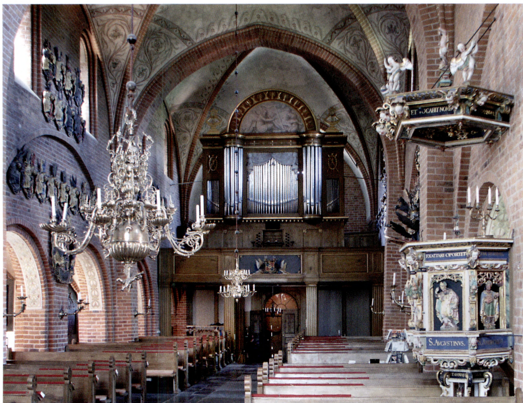
Fig. 4. Läktarorgeln i Skoklosters kyrka, Uppland, utförd av Pehr Lund 1804.