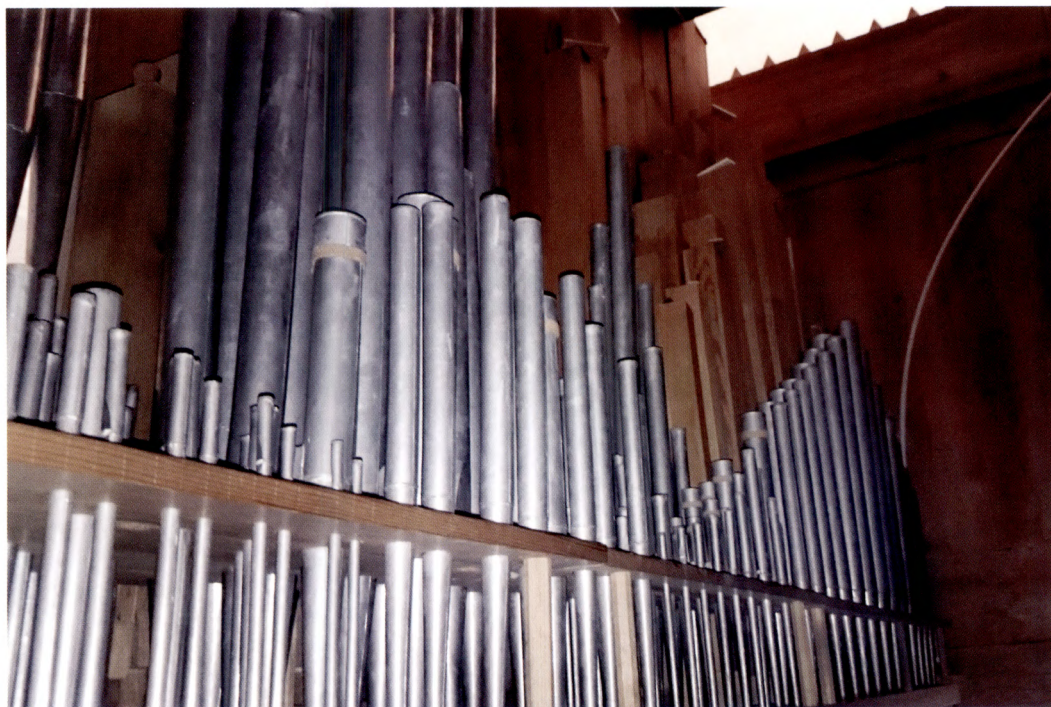
Fig. 9. Pipverket i orgeln i Lillkyrka kyrka.

Dispositionen i 1840 års orgel är densamma som idag: