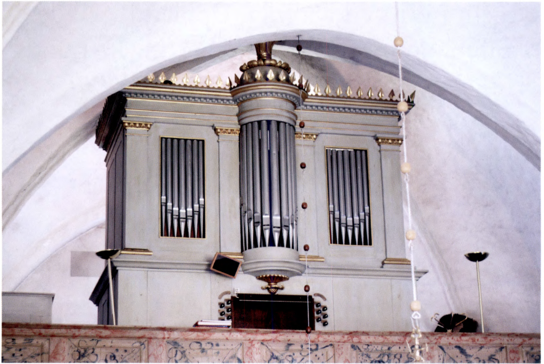
Fig. 1. Orgelverket i Lillkyrka kyrka, Uppland.