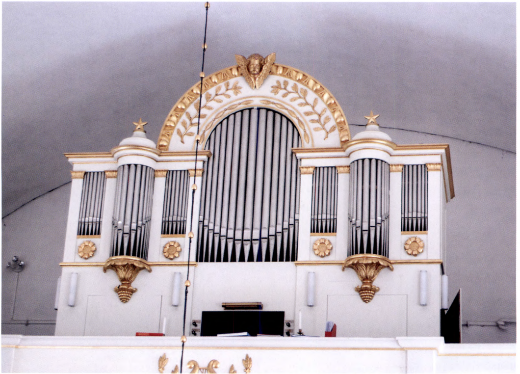
Fig. 5. Orgelfasaden i Hagby kyrka, Uppland. En tidstypisk representant för många av orgelbyggare Pehr Olof Gullbergsons orglar på 1840-talet.