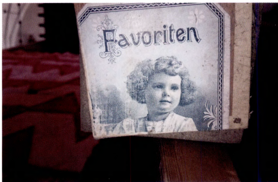
Fig. 8. Locket av en gammal cigarrlåda som använts som lagning på en trumpetupsats.