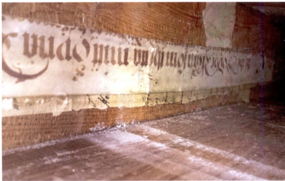
Fig. 7. Inklistrat makulerat papper i en träpipa för att täta sprickor.