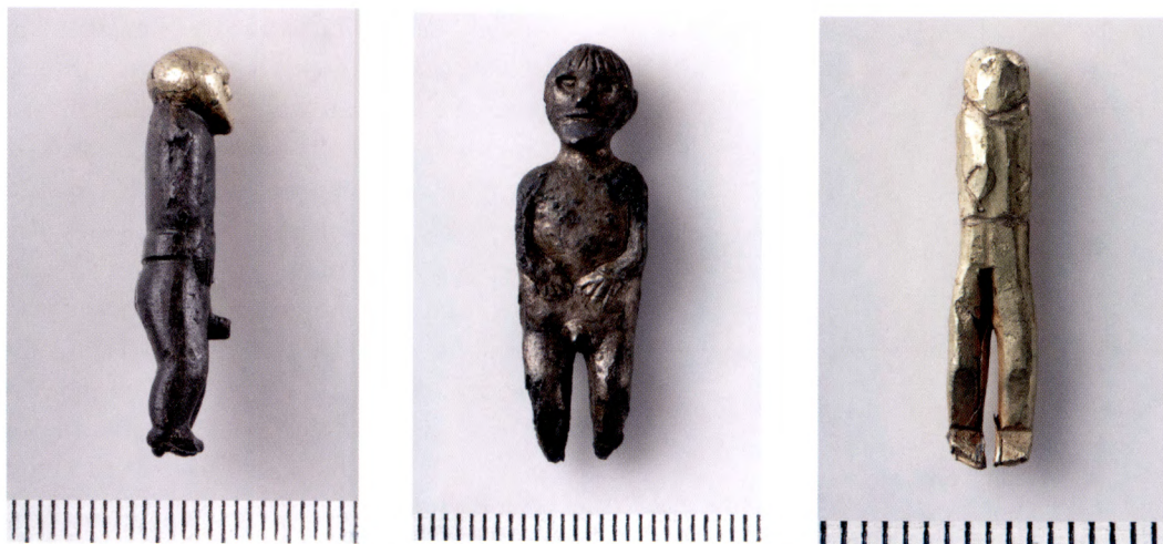
Fig. 9a–c. Figurinerna från Lunda utanför Strängnäs, Södermanland.

na håller sina händer på magen, dock med uppåtböjda tummar, ovanför sin erigerade penis. 14 Därför verkar det som om gesten med händerna på magen skulle kunna vara förknippad med fruktbarhet och alstringskraft. Detta stämmer väl med en figurin i guld som hittats i Smørenget på Bornholm med en kvinnogestalt med markerade bröst och kön, som vänder sin kropp mot betraktaren, och som har samma gest med händerna på magen. 15 Religionshistorikern Anders Hultgård har tolkat figurinerna från Lunda, som att de avbildar guden Frej i sin egenskap av fruktbarhetsgud. 16 I Vatnsdala saga som tillhör den västnordiska litteraturen, finns omnämnt hur en man Ingemund