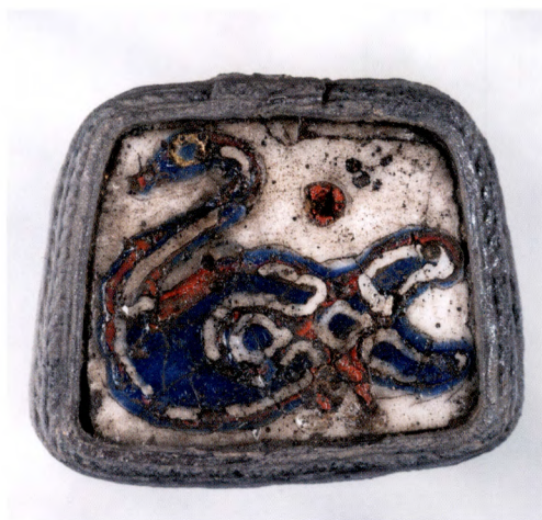
Fig. 7. Svanmosaiken med sin omfattning av silver hade inte varit med på gravbålet utan hade placerats där i graven i efterhand.

Glasmosaiken, som tros vara ett hänge, har sin närmaste parallell i det langobardiska Italien, kanhända i sin tur importerat från bysantinskt område. 9 Parallellen är en