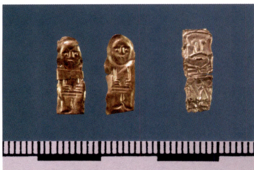
Fig. 10. Tre guldgubbar från Uppåkra i Skåne som avbildar samma motiv.

mer även djur som exempelvis grisar. I västra och östra Skandinavien däremot dominerar motiven av en man och en kvinna i rika dräkter, som står vända mot varandra. Miniaturerna från Gamla Uppsala anknyter till de sydsandinaviska guldgubbarnas motiv. Tre guldgubbar från Uppåkra i Skåne, i form av ensamma mansfigurer, utför samma gest som "vår" miniatyr med parallella fingrar fram på magen (fig. 10). 19