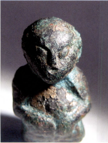
T.v.: Fig. 4. Figurinen talar eller sjunger och har en uppsyn som visar att den vill kommuni- cera med oss.