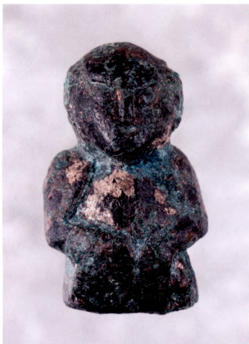
Fig. 6. Ansiktet har markerade ögon, ögonbryn, näsa och kluven haka. Det senare anses vara ett manligt drag.

dan syns de markerade öronen, midjan och de böjda armarna. Sedd i profil understryks att figuren har en stram uppsyn och håller händerna på magen. Den markerade hakan har manlig karaktär om man följer hur osteologer/benspecialister bedömer könsmarkerade drag. Detta faktum och att figurinen tycks sakna hår/frisyr gör att den verkar återge en manlig gestalt. Den öppna munnen visar att den tycks recitera eller sjunga.