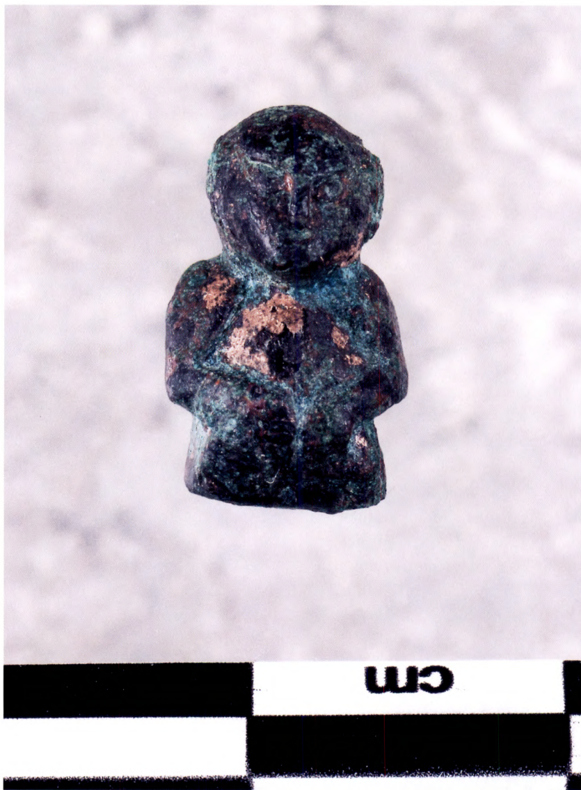
Fig. 3. Den lilla figurinen är mycket liten, omkring 1,1 cm hög.