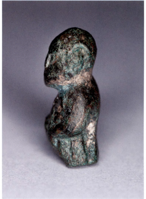
T.v.:, ovan och nedan: Fig. 5a–c. Figuren sedd från sidan och underifrån.