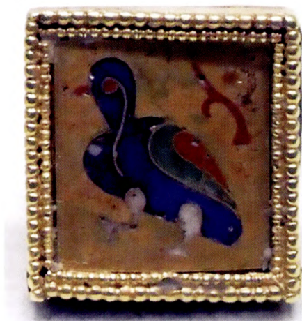
Fig. 8. En glasmosaik av en duva, tillika ett litet relikvarium, som hittats i en langobardisk mansgrav från 600-talet i Cividale i Friuli, nordöstra Italien. Föremålen förvaras i Museo Archeologico Nazionale.