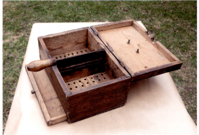
Ovan: Fig. 3. Sockerskrin av trä med kniv och utdragbar låda. Tensta socken. Lysningspresent 1862. Upplandsmuseets samlingar (UM 10129).

bondemiljö och för det mesta nämns parets olycksamma fall från predikstolen. I folklivsuppteckningarna används ofta drastiska uttryck som att paret "ramla utför predikstolstrappan och bröt benen av sig". 17