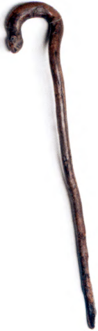
T.v.: Fig. 2. "Krycka" från Sörbäck, Norrby socken. Nordiska museet (NM 0122194).