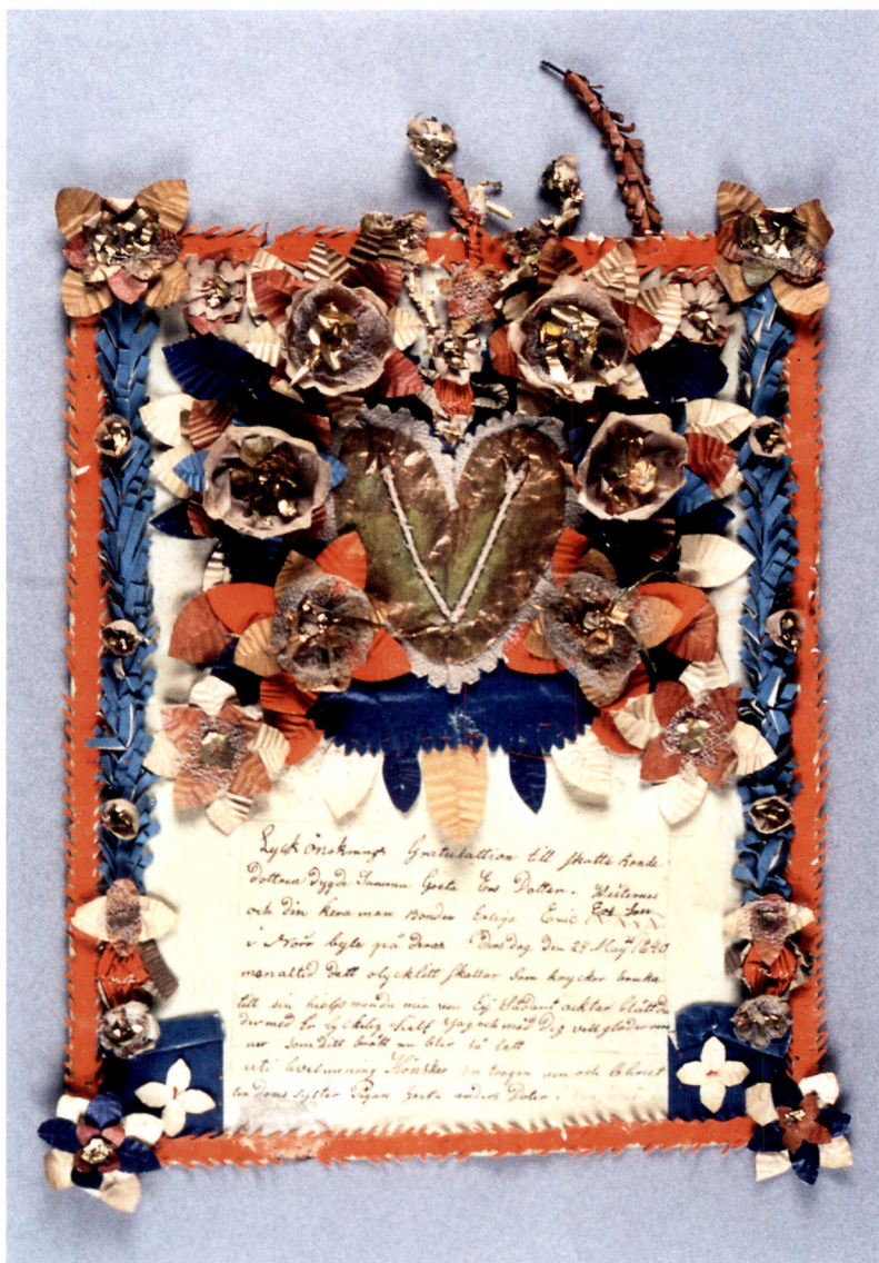
Fig. 4. "Kryckebrev" (lysningsgratulation) daterat 24 maj 1840, från Norrbylle, Vaddö socken. Nordiska museet (NM 45472c).