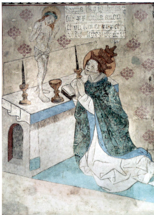
Fig. 12. Gregorii mässa i Husby-Sjutolfts kyrka, utförd av Albertus Pictor omkring 1480.