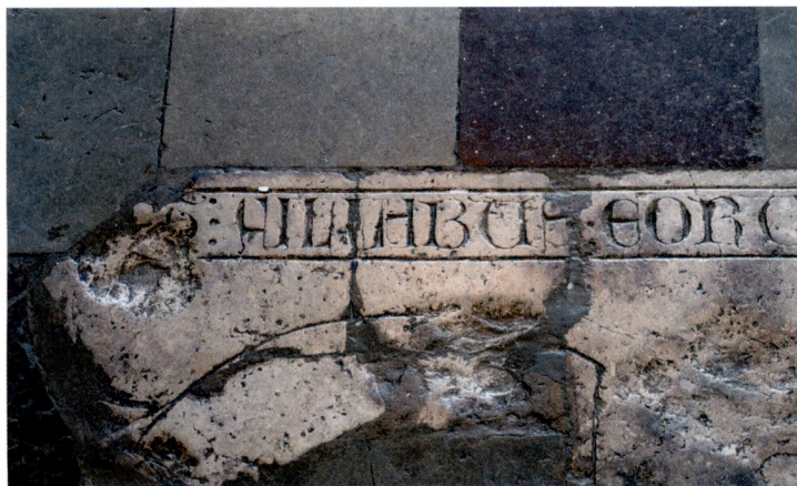
Ovan: Fig. 4. Fragmentarisk gravhäll av kalksten från 1300-talet.