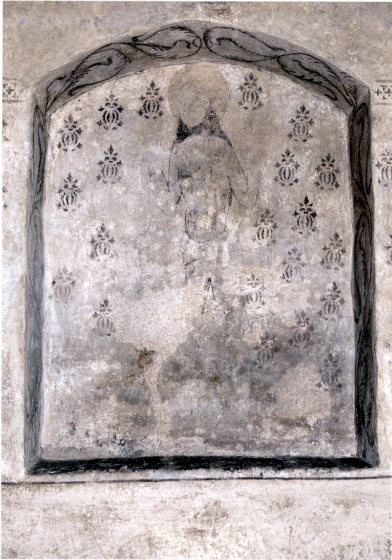
Fig. 14. Smärtomannen i norra vapenhuset har troligen varit placerad ovanför ett nu försvunnet altare.