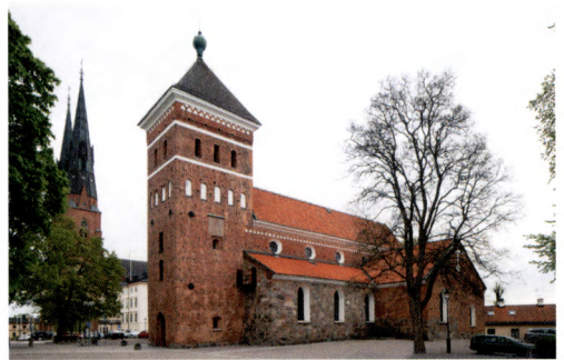
Fig. 2. Helga Trefaldighets kyrka från sydväst.

Numera räknar man i allmänhet med att den ursprungliga Trefaldighetskyrkan var belägen på domberget väster om Fyrisån. 2 Uppfattningen får stöd av Sankt Eriks legend som berättar att det var här helgonkungen firade sin sista mässa innan han