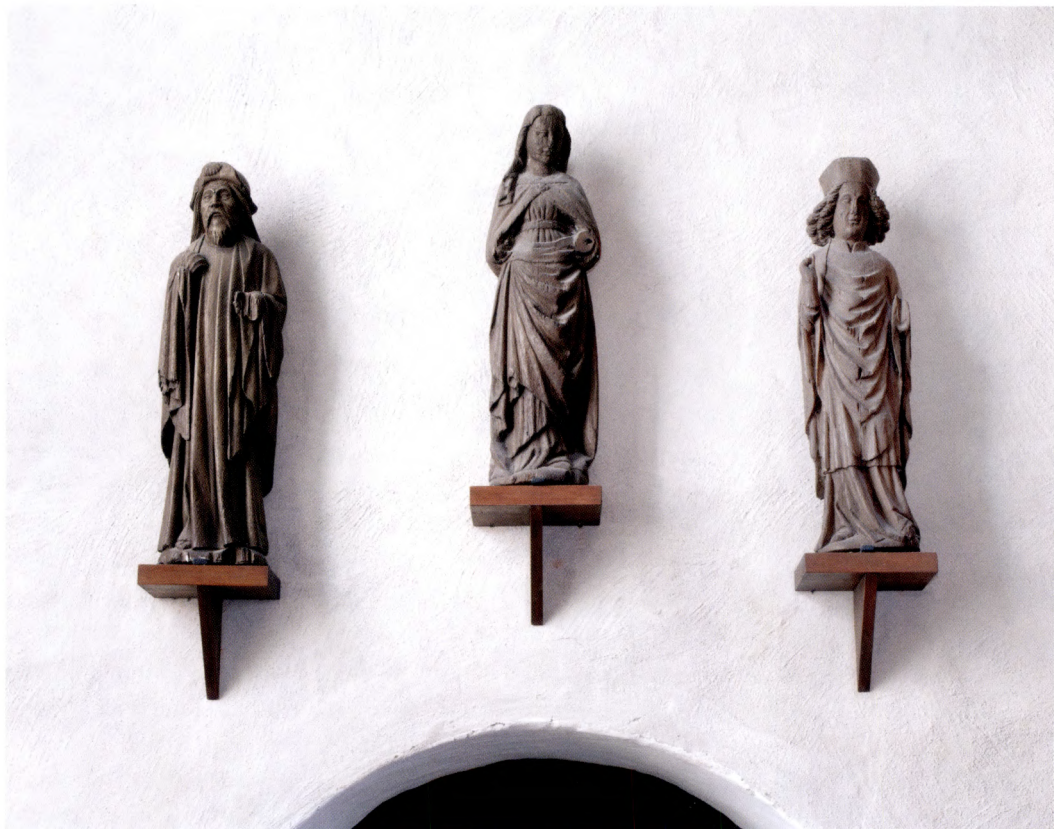
Fig. 6. Bevarade skulpturer från det senmedeltida altarskåpet. Från vänster: aposteln Jakob den äldre (kopia, originalet i privat ägo), den heliga Birgitta och Sankt Stefan. Stefan uppges 1477 vara ett av Helga Trefaldighets skyddshelgon.

samma som nu, bortsett från att västtornet pryddes av en hög spira som hade uppförts 1644 av byggmästaren Lars Jordansson. 16 Vid den omfattande stadsbranden i Uppsala i maj 1702 klarade sig Helga Trefaldighet förhållandevis väl, även om yttertaket, spiran och glasfönstren förstördes. 17 I samband