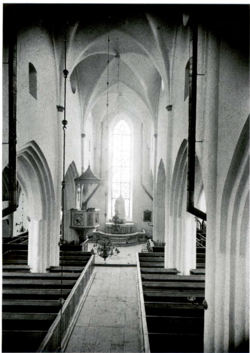
Fig. 8. Interiören fotograferad av Henri Osti omkring 1900. Upplandsmuseet.

de medeltida kalkmålningarna. 30 Att sådana fanns dolda under det tjocka putsskiktet var känt genom flera äldre skriftliga källor. 31 Uppenbarligen var hela kyrkorummet, inklusive vapenhuset i norr, vid medeltidens slut täckt med målningar. Däremot har ingen motsvarande dekor kunnat konstateras i sakristian eller i tornrummet i väster. 32