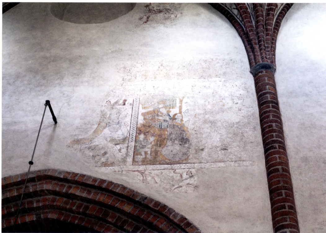
Fig. 16. Lyckohjulet och den frommes och den världsliges bön på norra mittskeppsväggen.

fragmentariska scener ur Sankta Barbaras legend som skall ha utspelat sig i Nicomedia i Anatolien under andra hälften av 200-talet (fig. 17). I Legenda aurea , som sammanställdes på 1260-talet av dominikanbrodern Jacobus de Voragine, berättas att den unga jungfrun Barbara spärrades in i ett torn av sin hedniske och brutale far Dioscorus. 95 Sedan Barbara blivit kristen önskade hon bevara sin jungfrudom och vägrade därför att