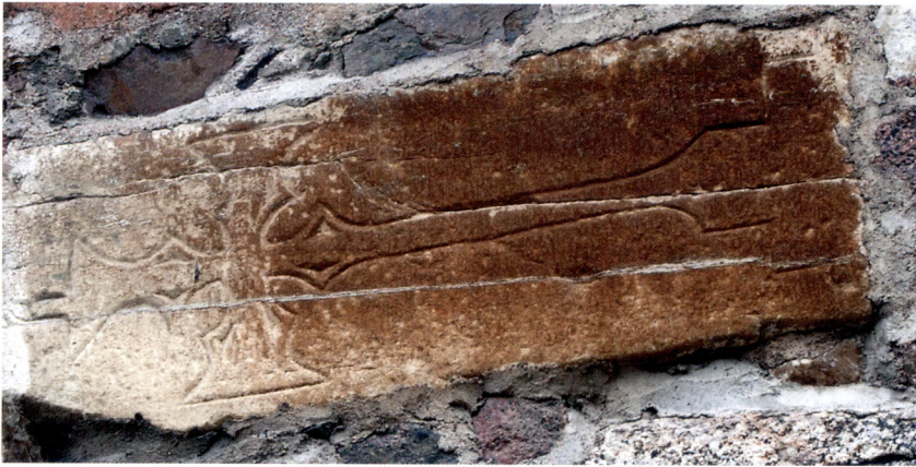
Fig. 3. Stavkorshäll, sekundärt inmurad i södra långhusväggen.

medeltida församlingen räknades även de borgare som bodde på Fyrisåns västra sida. Trots det centrala läget i Odinslund dröjde det ända till 1946 innan kyrkan formellt införlivades med Uppsala stad. 5