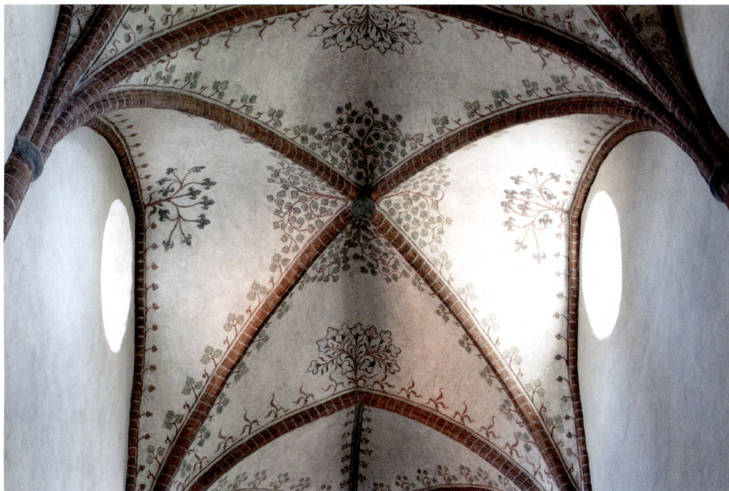
Fig. 9. Mittskeppsvalvens dekorativa målningar är ursprungligen från 1300-talet, men mycket hårt restaurerade 1904.

löst. Tilltaget föranledde en syrlig insändare i Upsala Nya Tidning från komministern Fredrik Nathanel Sandberg om att skyltarna med texten ”Tillträde förbjudet” tydligen inte hade respekterats av de båda inkräktarna. Sandberg passade också på att meddela att alla åtgärder som vidtagits beträffande målningarna var väl förankrade hos Kungl. Viterhetsakademien. 46