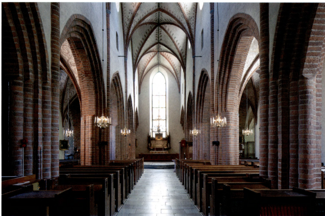
Fig. 7. Interiören från väster.

bortsett från att all utvändig puts avlägsnades så att det ursprungliga murverket kom i dagen. 28 På så sätt underlättades samtidigt uttolkningen av kyrkans byggnadshistoria. Interiören hade vid restaureringens början en övervägande klassiserande prägel med vitkalkade väggar och valv och en altarprydnad som närmast kan betraktas som en parafra på Bertel Thorvaldsens Kristus (fig. 8). Gudstjänstrummet framstod som trångt med tre skrymmande läktare och ett stort antal bänkar och stolar. Läktarna var