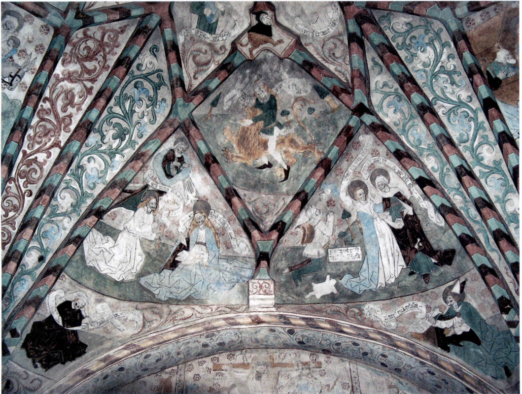
Fig. 11. Scener ur Gamla och Nya Testamentet i Härnevi kyrka, utförda av Albertus Pictor på 1480-talet.

talade beställarna, och som med vissa variationer kunde användas i kyrkorna. Under 1400-talets senare del har man helt dominerat marknaden för kalkmålningar i Mälardalen. Den ökande efterfrågan på dramatiserade skildringar ur Bibeln och helgonlegenderna hänger samman med fromhetslivets utveckling i Europa under senmedeltiden, där det ställdes allt högre