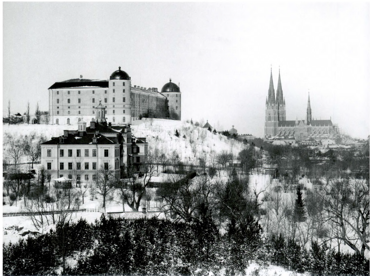
Fig. 1. Några av de större byggnaderna i Uppsala fotograferade av Henri Osti omkring 1900. Helga Trefaldighets kyrka skymtar bakom åsen. Upplandsmuseet.