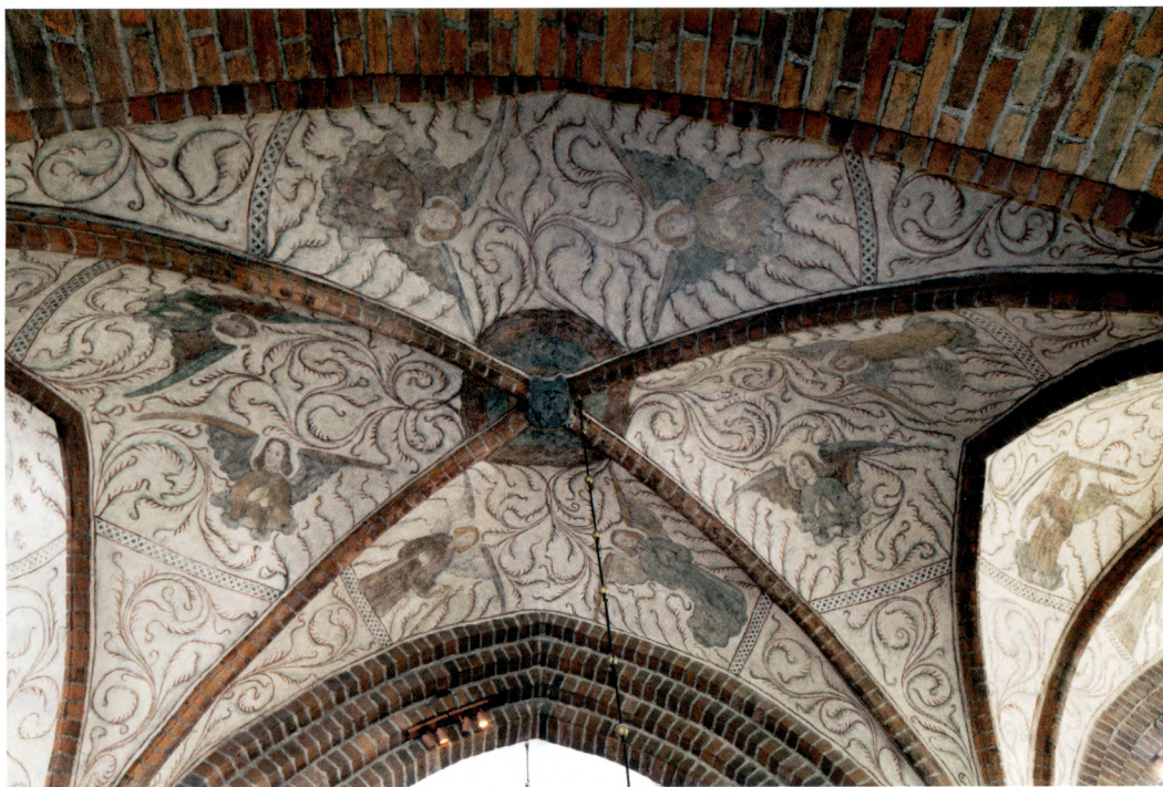
Fig. 15. I sidoskeppen i långhuset och koret finns hårt restaurerade framställningar av änglar.

änglar och kyrkofäder (fig. 15). Här finns dessutom scener ur skapelseberättelsen, liksom apostlar och helgon. Troligen har de nu försvunna 1400-talsfigurerna i mittskeppsvalvet haft en likartad karaktär. 92