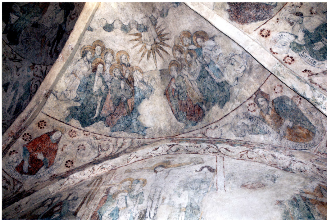
Fig. 13. Målningar i södra kapellet.

Trots vissa ofrånkomliga luckor kan kyrkans bildprogram i stort sett rekonstrueras. 83 Liksom ofta annars har Albertus Pictor använt sig av ett s.k. typologiskt framställningssätt, där scener hämtade från Gamla och Nya Testamentet återgavs parallellt. Därmed blev det möjligt att visa hur hela frälsningshistorien hängde ihop, i och med att de viktigaste episoderna i det Gamla Testamentet ansågs peka framåt mot Maria och Kristus. Idag framträder berätt-