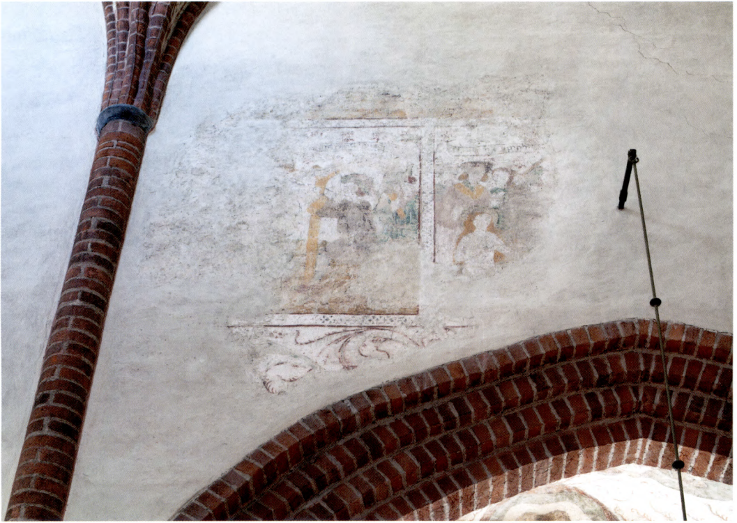
Fig. 17. Sankta Barbaras martyrium på södra mittskeppsväggen.

groteska fysionomi som Albertus Pictor brukade använda för personer med dålig karaktär. I den högra scenen har Barbara blivit avklädd och hon pinas nu med brinnande facklor. Bakom henne återges den tronande Maxentius och vid hans sida syns även Dioscorus, återigen framställd i profil. Förklaringen till att man valt att ge ett så stort utrymme åt Sankta Barbaras legend måste vara att den hade särskild anknyt-