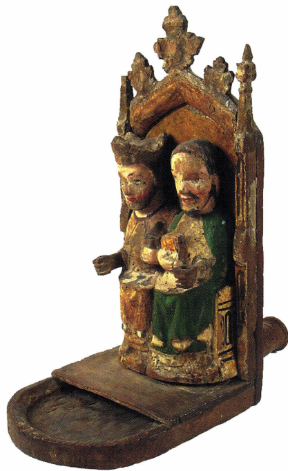
Kollekttavla med två manliga helgon, nu i Gotlands museum (B928).

Kollekttavlorna användes långt fram i tiden, innan kollektlåven tog över som det vanligaste kollektredskapet. Begreppet tavla omnämns till exempel i 1571 års kyrkoordning, där det framgår att det är lämpligt att på helgdagar gå runt med tavla eller hatt för att samla in pengar till de fattiga. Kollekttavlorna tillverkades ofta i par och kunde vara både enkelt utformade såväl som rikt utsmyckade med sniderier och bemålning. Ett flertal kollekttavlor från efterreformatorisk tid finns bevarade, bland annat i Statens historiska museums samlingar. Dessa är framförallt från sent 1600-tal och tidigt 1700-tal, flera av dem är försedda med