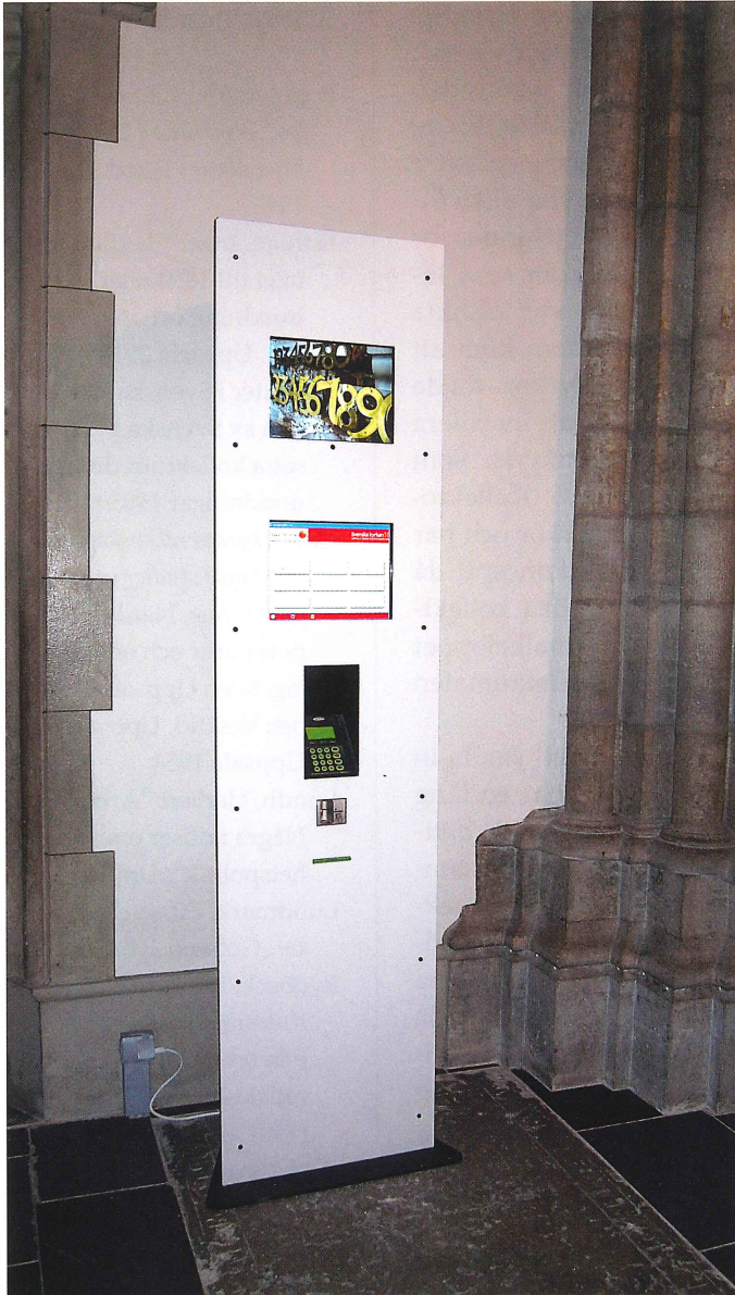
Kollektomat i Uppsala domkyrka.