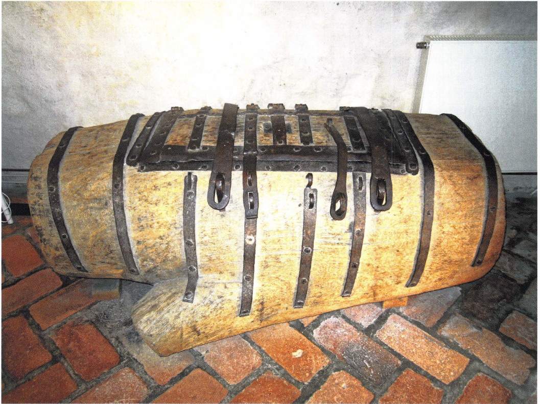
Offerkistan i Gamla Uppsala kyrkas vapenhus.

med låg sarg, högre ryggparti och handtag. En av de äldsta bevarade kollekttavlorna i Sverige är förmodligen den som kommer från Endre kyrka på Gotland och som numera ingår i Fornsalens samlingar. Den är försedd med en stående, skulpterad madonnabild under en gotisk balda-