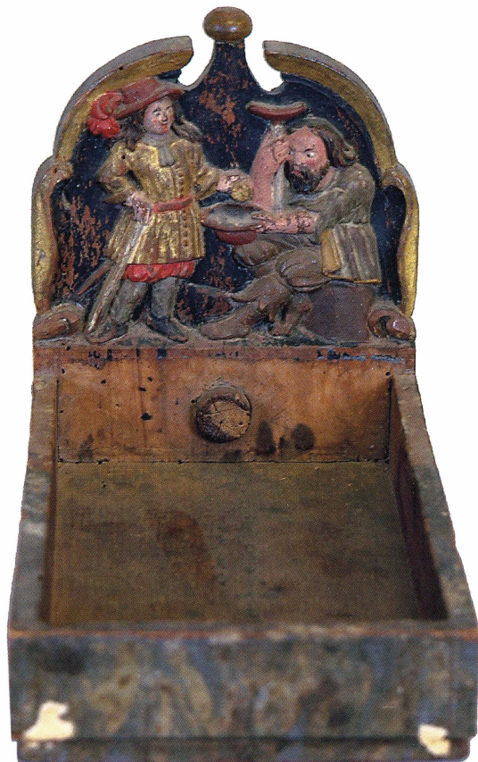
Kollekttafva från Rödeby kyrka i Blekinge från sent 1600-tal, numera i Statens historiska museums samlingar (SHM26136:15).

Det i särklass vanligaste efterreformatöriska kollektredskapet är kollektlåven som består av en tyg eller skinnpung, fixerad vid en ring och fäst på ett skaft med handtag. Kollektlåvarna kan ha både kort och långt handtag och ibland också två handtag med själva låven hängande i mitten av stängen. Kollektlåvar med långt handtag blev vanliga framförallt i de större stadskyrkorna. Den långa stängan gjorde att man även i mycket breda bänkrader ändå kunde nå fram med låven till de kyrkobesökare som satt längst in i bänkraden. Kollektlåvar från äldre