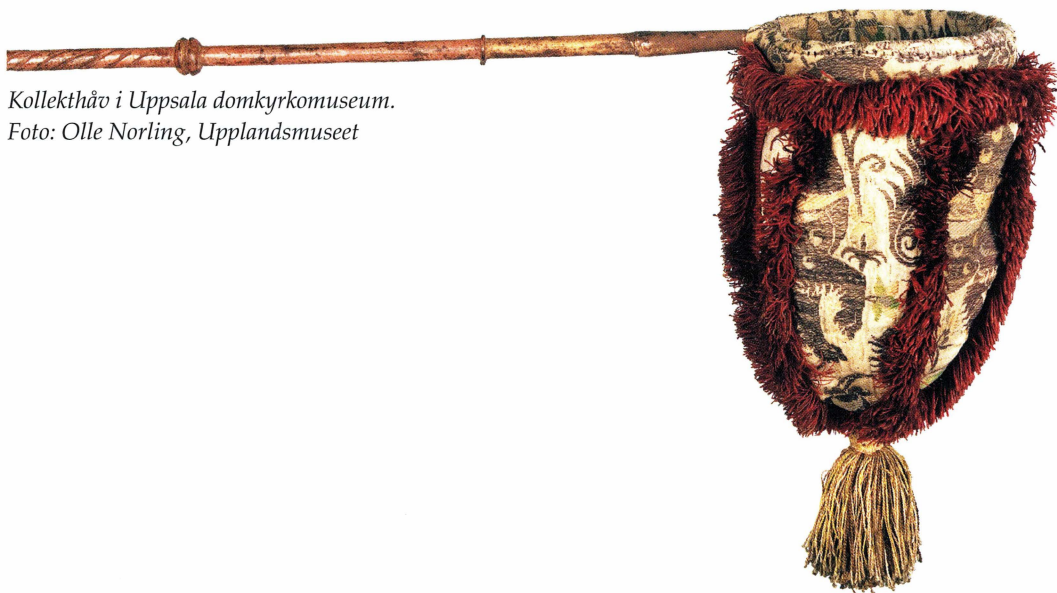
Kollektthåv i Uppsala domkyrkomuseum.