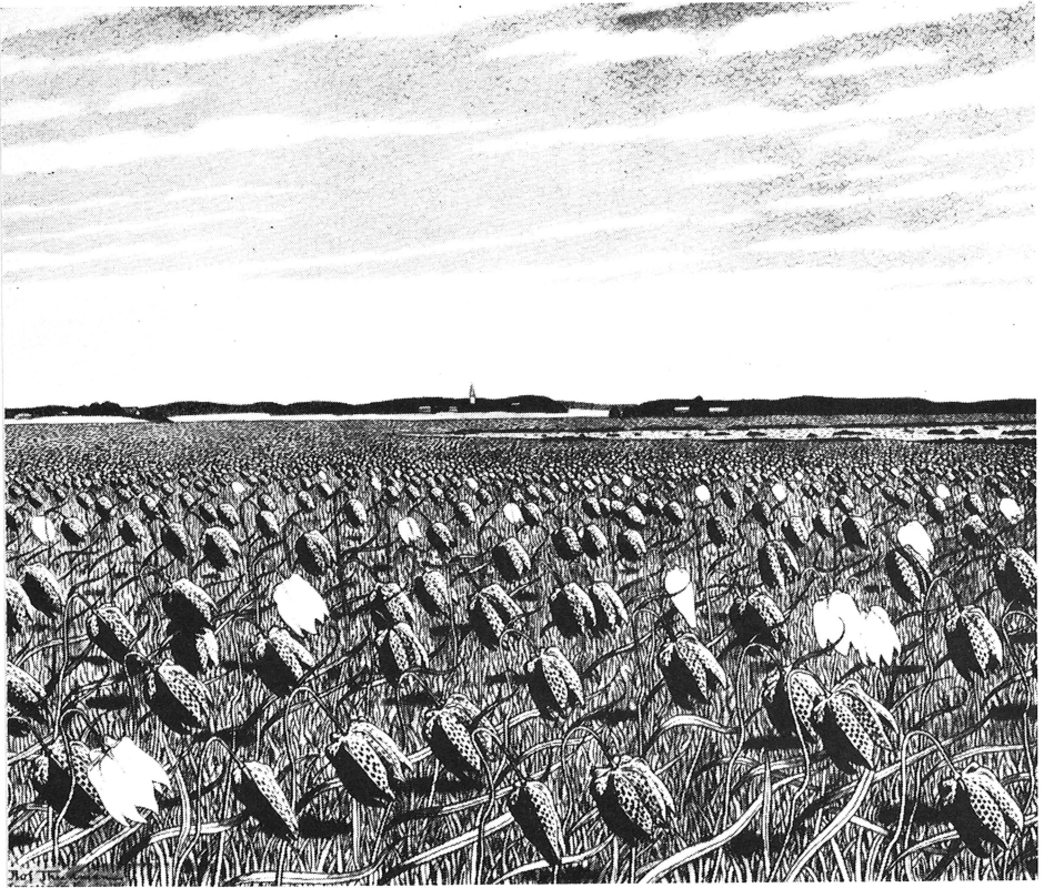
Bild 4. Kungsängen i liljeprakt. Från ängsreservatet mot Danmarks kyrka. Teckning av Olof Thunman, pingsten 1941. Ur Sernander-Sandberg, Uppsala Kungsäng (1948).

markreservaten vid Fyrisåns strandområde kom till stånd: dels det s. k. Nántuna-reservatet, dels Kungsängslilje-reservatet. Kungsängsliljan ( Fritillaria meleagris ) är Upplands blomma och den har sin centrala utbredning på Fyrisåns östra strand, på "kungsängarna" strax söder om Uppsala.