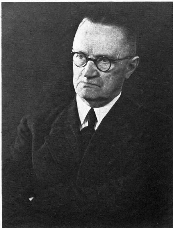
Bild 1. Herman Flodkvist (1875–1968), professor vid Lantbrukshögskolan på Ultuna 1932–1943, dess rektor 1940–43.

mitten av 1900-talet – i det närmaste ”suttit av” för alltid, torde dessa minnesbilder komma att för framtiden utgöra ett värdefullt historiskt material från en gången epok i Sveriges försvar.