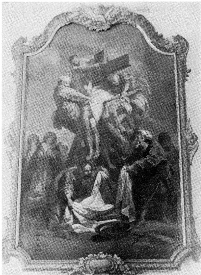
Bild 1. »Nedtagningen från korset». Lars Gottman (efter Jouvenet).