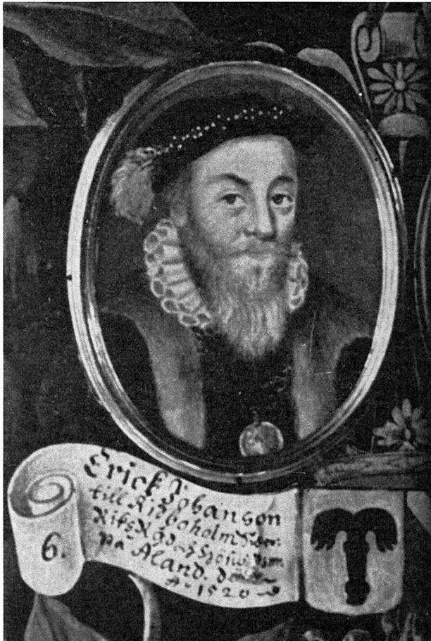
Bild 4. Erik Johansson Vasa. Detalj av antavla i gouache för Karl X Gustav av ERIK UTTERHJELM, 1705. Gripsholm. För tydlighetens skull återges bilden i något förstorat skick.

till den historiska verkligheten och ofta med anknytning till vasa- ätten, t. ex. »en ask, innehållande stenlemningar af det nedbrutna Lindholms hus eller slott, från det hörn, der Konung Gustaf Erikssons vaggä förmodas hafva stått» 16 , vidare Gustav Vasas run- stav (möjligen skuren av honom själv), kungens studsare och krut-