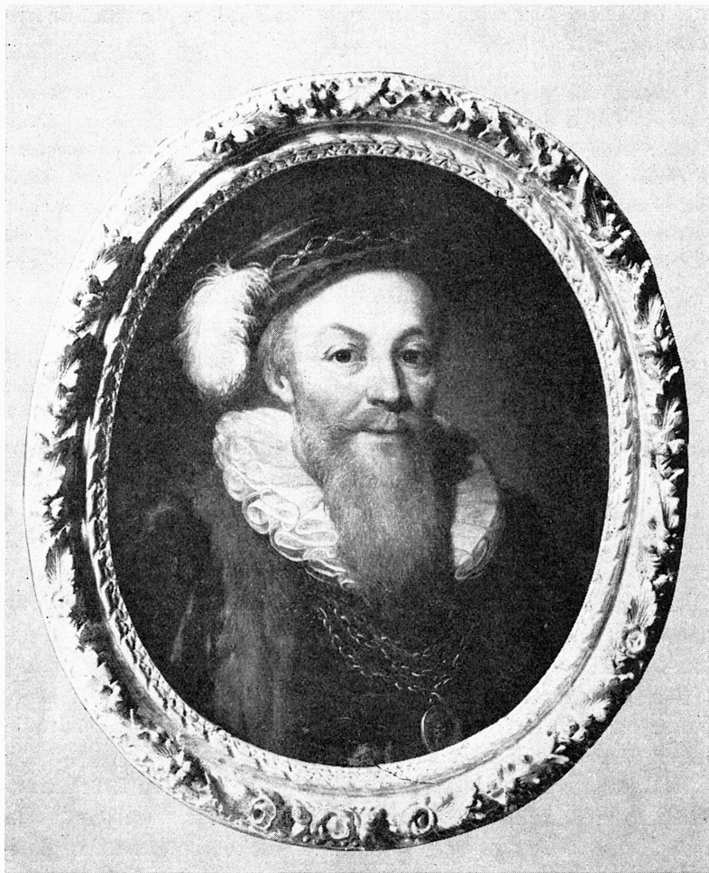
Bild 3. Erik Johansson Vasa. Oljemålning av LORENS PASCH D. Y., 1782. Skokloster.