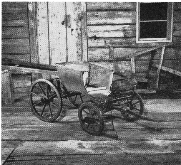
Bild 3. Vagn från Granhammars gård, Västra Ryds socken.

hälft har ordnats som avdelning för grövre redskap för skogsbruk, lantbruk och boskapsskötsel. Härifrån leder en bekväm trappa upp till övre botten eller vinden, som i sin helhet användes som museum. Timmerväggarna stå rena och takstolar och strävor ha lämnats helt synliga. I ena hälften — eller i den del av utrymmet, som sträcker sig över nyssnämnda dansloge — ha under takfallen medelst av ålder grånad plank uppförts skyltskåpsliknande fack i rader utmed båda sidorna. I motsatta hälften har utmed sidorna uppförts långsgående podier och hyllor mellan takstolarna. Dessas strävor bilda naturlig omramning till de olika utställningsavdelningarna. På den fria golvytan i mitten är det meningen att olika slag av montrar i sinom tid skall uppställas.