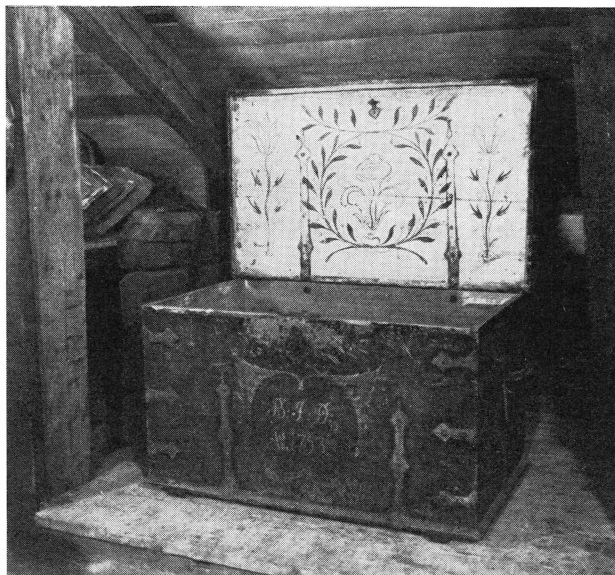
Bild 4. Målad brudkista med årtalet 1763 från Penningby, Länna socken.

linberedning, spinning och vävning m. m. Smärre föremål ha grupperats i de tittskåpsliknande facken under det att större uppställts å den fria golvytan eller inordnats i avdelningen med de fria takstolarna. Vad finnes då för föremål att beskåda i Stockholms-Näs hembygdsmuseum? Naturligtvis utgöres en stor del av sådant, som ses på andra hembygdsmuseer, såsom spinrockar, härvlar, skäktsvärd, häcklor, mangelbräden, klapprän, kardor, ostkar m. m., vittnande om kvinnornas arbete, samt olika slag av jordbruksredskap, snickeriverktyg, ljuster m. m., som belysa vad männen sysslade med i äldre tid. Krönta mått, besman och alnstickor representera köpenskap; psalmodikon, piphuvuden och ölståndkor andra värv i helg och vardag. Samlingarna äro dock ännu ej så kompletta att de helt belysa de näringar som förekommit inom socknen.