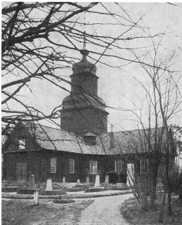
Bild 1. Roslagskulla kyrka.