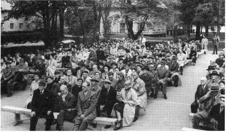
Bild 1. Från årsmötesförhandlingarna i Söderfors.