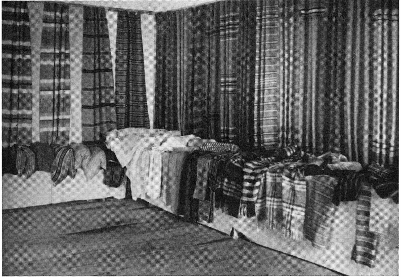
Bild 2. Några av utställningens många vepor av senare datum, filtvar, kud- dar, gardiner och klädningstyper.

vävd för 80 år sedan av gamla mor i Kullbol och buren av henne. Den bestod av jacka och kjol av kornblått och svart jämnrutat hel- ylletyg av hemull. Jackan med dess ryggskärning och små plisséer hade nästan dagens mode. En ung blivande sonhustru på Årby gick under festen mannekäng i denna klädning (bild 1).