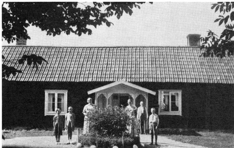
Bild 2. Ubby gamla komministergård.