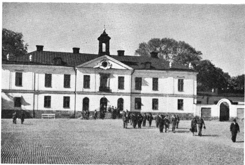
Bild 4. Från besöket på Gimo slott.