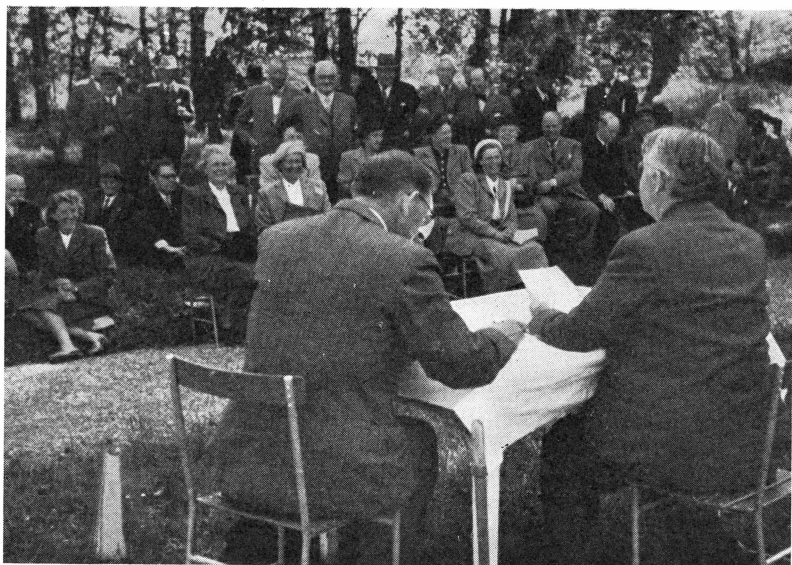
Bild 7. Från årsmötesförhandlingarna vid Gimo.