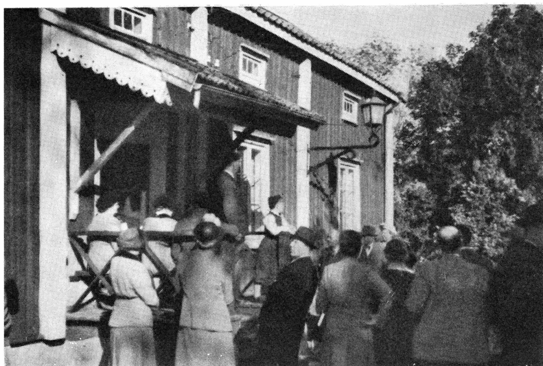
Bild 6. Samling framför Öregrunds Hembygdsgård.