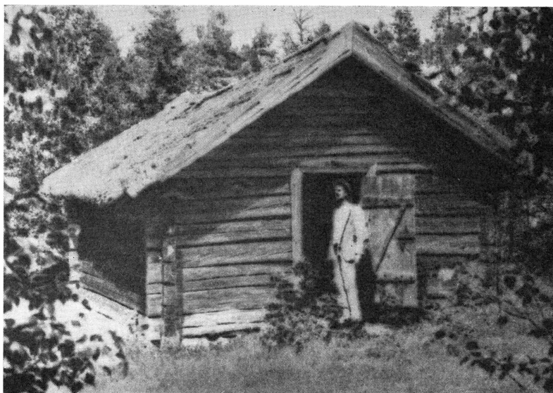
Bild 1. Tjäderlekskojan på Segerstaskogen, exteriör.

diskt, och dessa kringstrykare påträffas fortfarande någon gång i våra trakter. Ett lodjur sköts på Österby bruks marker 1885 och ett på Hargs bruks skogar i slutet på 1890-talet. En järv sköts på Bergsbrunnaskogen, omkring 6 km från Uppsala, så sent som 1931.