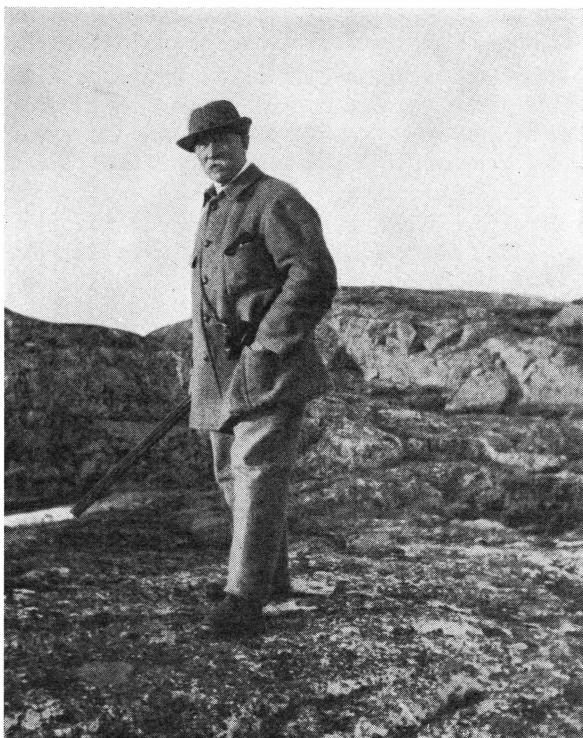
Bild 5. Bruno Liljefors på jaktstigen i skärgården.

Allmogen kände många sätt att komma i håll för tjäder och orre. Mest får man höra talas om spelskyttet på tjäder om våren. Spelplatserna voro väl kända av traktens jägare, som gick ut före gryningen och lyssnade på tjäders spel, först knäppningar, så klunkar och därefter sisningar, då fågeln varken ser eller hör och jägaren därför kan springa några steg framåt. Detta upprepas så några gånger tills man kommer i håll. Vårjakten på tjäder har länge varit förbjuden, men det är väl få jaktförbud, som så föga respekterats; ännu kan man träffa gamla krypskyttar i de djupa skogarna i norra Uppland, som gärna blotta sin ungdoms synder och tala om sina bravader på spelplatserna.