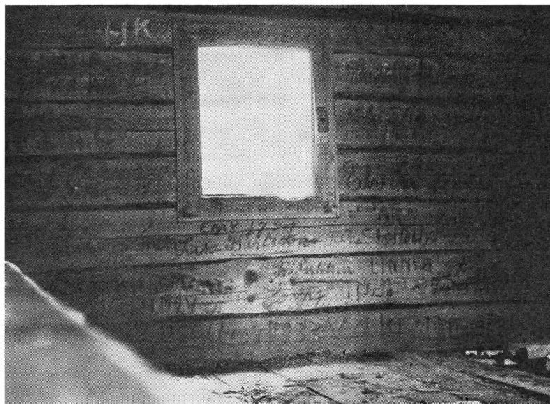
Bild 2. Interiör av kovan med mängden inskriptioner, de flesta tillkomna av klämfingrighet.

man arbetar dock ivrigt på att få fram hundar, som specialisera sig på endera rådjur eller andra drivbara villebråd.