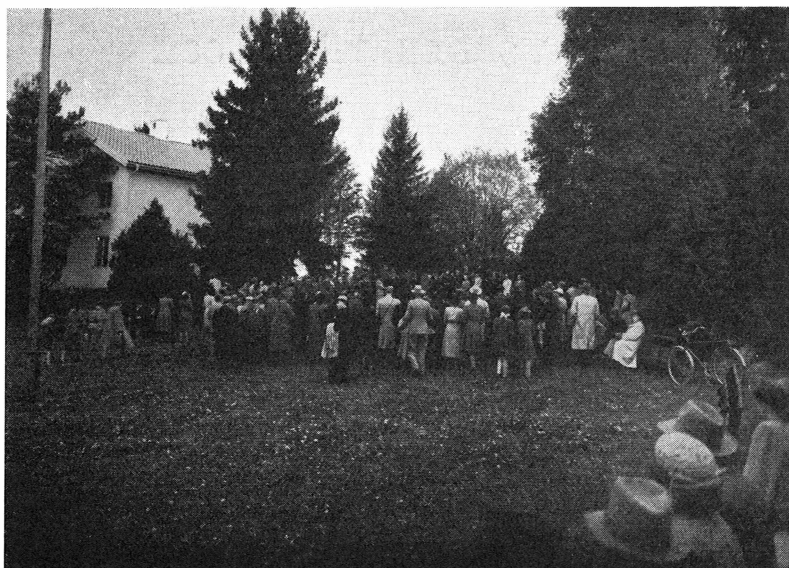
Bild 3. Söderbykarls ståtliga hembygdsmuseum beses.