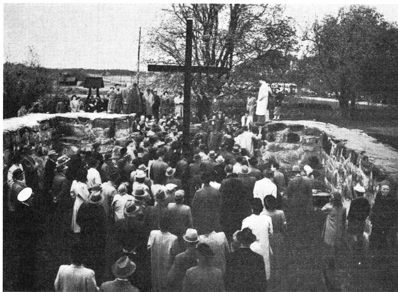
Bild 5. Landsantikvarien demonstrerar den gamla Karls sockens kyrkoruin.