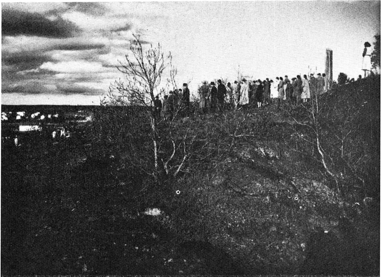
Bild 6. Utsikten över Norrtälje beundras från Södra bergen.