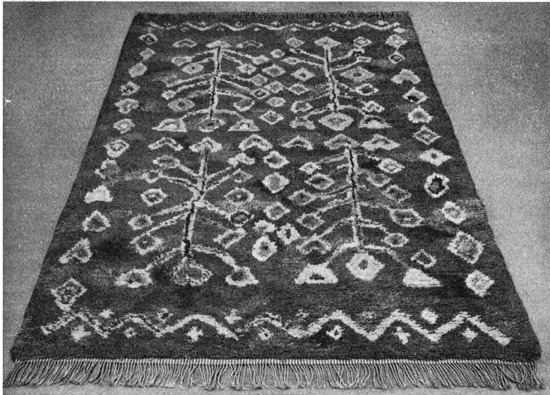
Bild 1. Ingrid Skerfe-Nilsson: »Äppelträd». Storlek: 1.80 × 2.60 m.

holm 1947, fick 2:a pris för »Efter syndafallet» och 4:e pris för »Äppelträd».