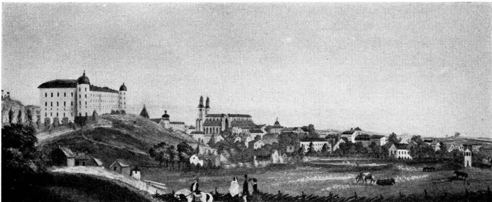
Bild 1. Uppsala från söder. Målning 1851 av FRANZ ALEXANDER BERGGREN (1815—1855).

tidigare ej uppmärksamrats av forskningen. De ha ej heller tidigare varit publicerade.