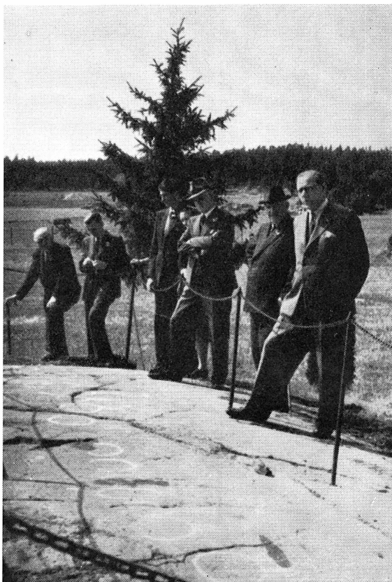
Bild 2. Ristningen med »solbärarna» vid Stora Berg i Biskopskulla demonstreras.