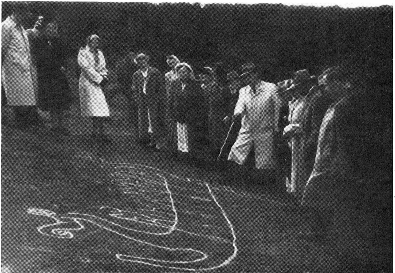
Bild 4. Det stora Brandskogsskeppet i Boglösa demonstreras av landsantikvarien.