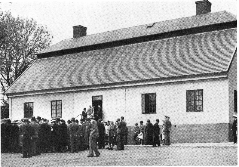
Bild 5. Från samlingen vid Väsby Kungsgård.