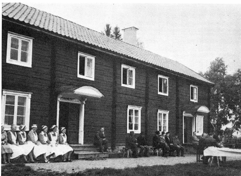
Bild 1. Från årsmötet vid Västerlövsta hembygdsgård.