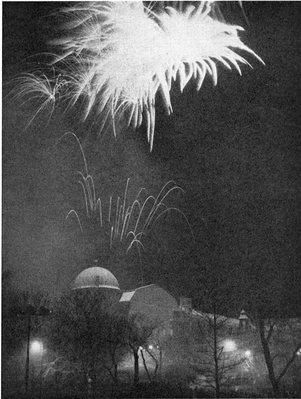
Bild 3. Det ståtliga fyrverkeriet över Uppsala slott, då Stor-Uppsala föddes.

samma i det allmännas tjänst inom de båda kommuner, vilkas borgerliga självständighet nu upphörde.