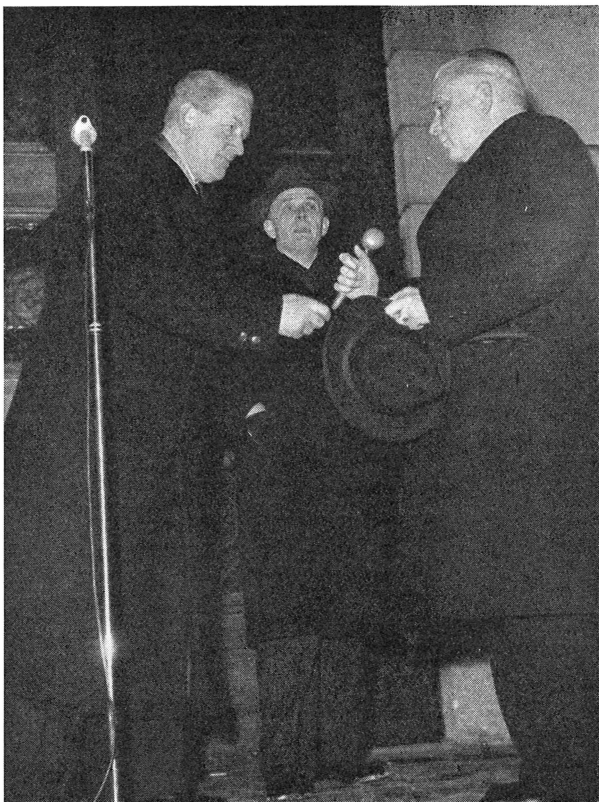
Bild 1. Bondkyrkos och Gamla Uppsalas kommunalfullmäktigeordförande överlämna sina klubbor till Uppsala stadsfullmäktiges ordförande.

1 januari 1947. De undantagna delarna, i socknens norra del, komma genom förnyat beslut att även de införlivas med Uppsala stad från 1 januari 1948.