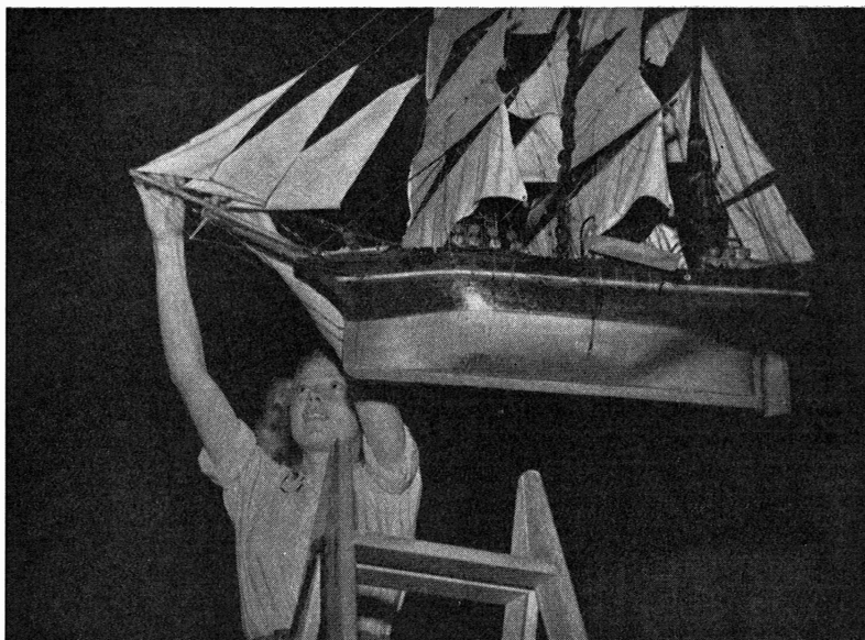
Bild 4. Votivskepp, Kyrkliga utställningen.

släktreliker. I en monter med damast utställdes sidenskimrande duktyg, som tillhört Fredrik I:s mätress, Hedvig Ulrika Taube. Här fanns både svenskt och utländskt damasttyg, bl. a. från Vadstena samt vidare hemvävd damast från skärgårdssocknarna. Gårdarna i trakten ställde ut vacker prydnads- och nyttslöjd.