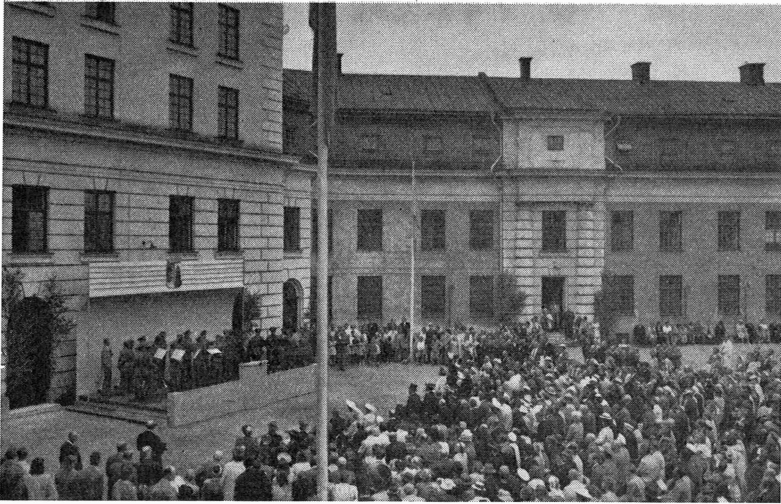
Bild 2. Från Vaxholmsutställningens öppnande på fästningsgården.

fästningen. Denna öppnade nu för första gången på fyra sekel sina portar för allmänheten.