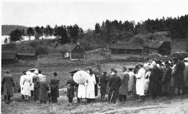
Bild 1. Viby fornby utanför Sigtuna beses.