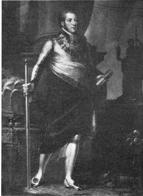
Bild 1. Riksmarskalken CLAES FLEMING (1771— 1831). Målning av C. F. VON BREDA. Gripsholm.

med regelbundna, uttrycksfulla anletsdrag och med ett ända in i ålderdomen blomstrande utseende. Det porträtt, som Breda målat av honom i Serafimerordens dräkt 1810, torde ha givit hans yttre full rättvisa.