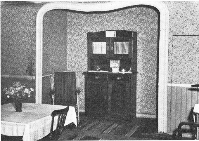
Bild 3. Sängalkov i ett av rummen å övre botten.