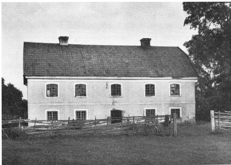
Bild 4. Grenomebyggnadens huvudfasad.

På slottets trädgårdssida finnas ännu resterna av en terrassering ner mot slätten, där tidigare ett bredare vattendrag gått fram än den lilla bäck, som nu trögt flyter fram i sänkan. Denna anläggning tyder också på 1600-tal.