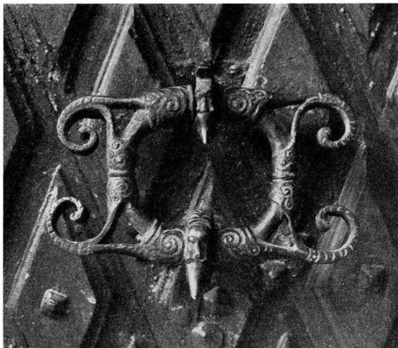
Bild 4. Dörrvred å ytterporten, Sal- necke slott.