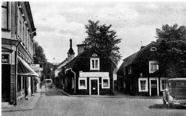
Bild 2. Äldre stadsparti i Norrtälje.

termen emellertid i inskränkt bemärkelse, och i stort sett kan då sägas att en stads uppland sträcker sig så långt som vederbörande stad benämnes »sta'n» i stället för med sitt namn.