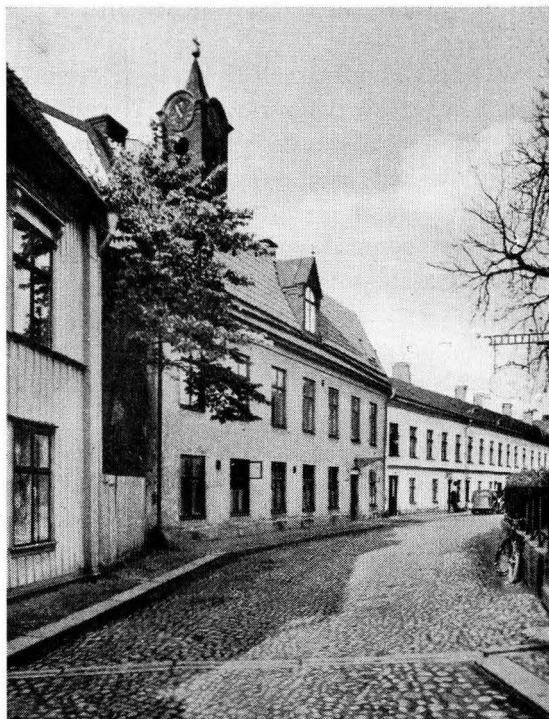
Bild 4. Rådhuset och Rådhusgatan, Enköping.

sta'n i regel betyder Enköping, men att inflyttad befolkning med detta ord avser Stockholm.