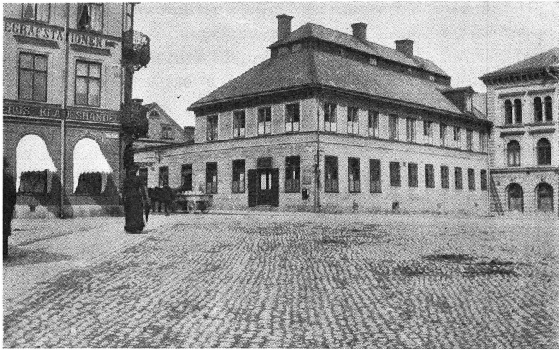
Bild 5. Stora torget i Uppsala på 1890-talet.

i gångna tider på tillkomsten av nya städer, då statsmakterna i en del fall helt enkelt befallde att städer skulle anläggas på vissa utvalda platser. När i vår tid ett samhälle erhåller stadsrättigheter, har den nya staden redan under sin framväxt förvärvat sig ett uppland. Men i allmänhetens medvetande framstår vanligen icke en ny stad såsom »sta'n». Först efter en eller ett par generationer benämnes den med detta ord. Kumlä, Karlskoga eller Bollnäs, för att anföra några exempel, omnämnas icke med ordet sta'n av befolkningen i respektive trakter.