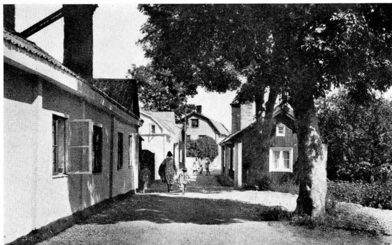
Bild 3. Från Östhammar.

medlet för att komma till ett stadssamhälle». Här vill det synas som om huvudstaden trängt undan Öregrund från dess tidigare ställning. Det är också betecknande att det är i den yngre befolkningens medvetande, som huvudstaden intager den främsta platsen.