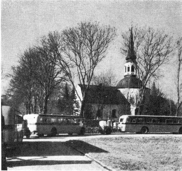
Bild 4. Bussarna parkerade framför Bromma kyrka.

Det nämndes om att planer föreligga att av Stora Ängby skapa en Bromma hembygdsgård och vi må framställa den förhoppningen att dessa planer icke måtte komma på skam.