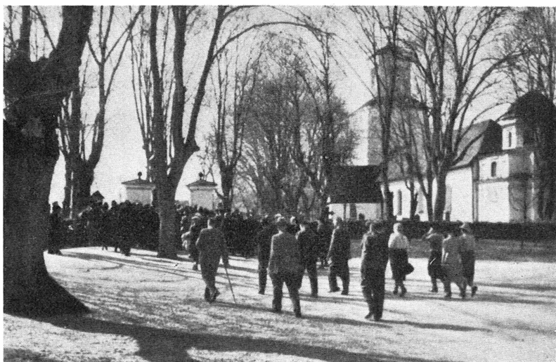
Bild 3. Resenärerna anlända till Spånga kyrka.

skaper om kyrkobyggnadens och dess inrednings historia. Det var en sällsamt stämmingsfull stund under de vackra valven; oförglömlig var den vackra tavla man hade framför sig då man blickade in i det bakom altaret belägna Bondeska gravkoret, med dess rika samling begravningsvapen.