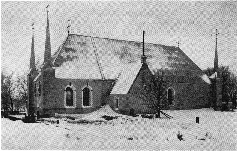
Bild 3. Björklinge kyrka från nordöst; den Wredeska graven har sin plats under koret längst t. v.

och bekanta. Här hade bland andra Herman Fleming stått till tjänst.