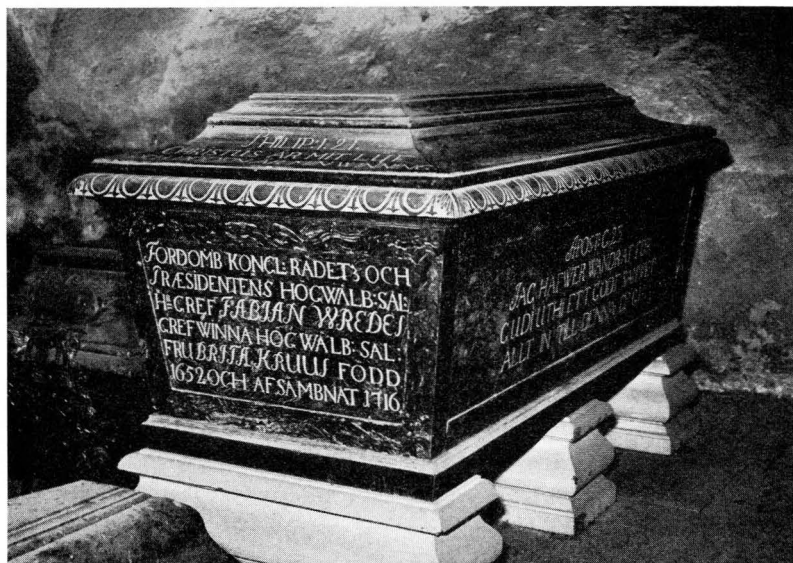
Bild 5. Brita Kruus' sarkofag, nedsatt 1721 och utförd av slottsstenhuggaren Olof Fristedt i Stockholm.

sex hästar 26 dlr 1 öre kmt. Till den gamle betjänten Sven Näbb från Sätuna gavs en dusör på 30 öre kmt.