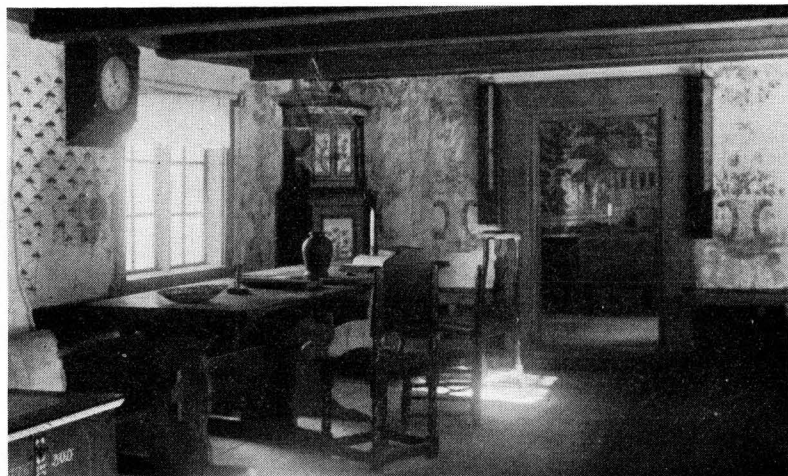
Bild 3. Interiör från Offerbostugan.