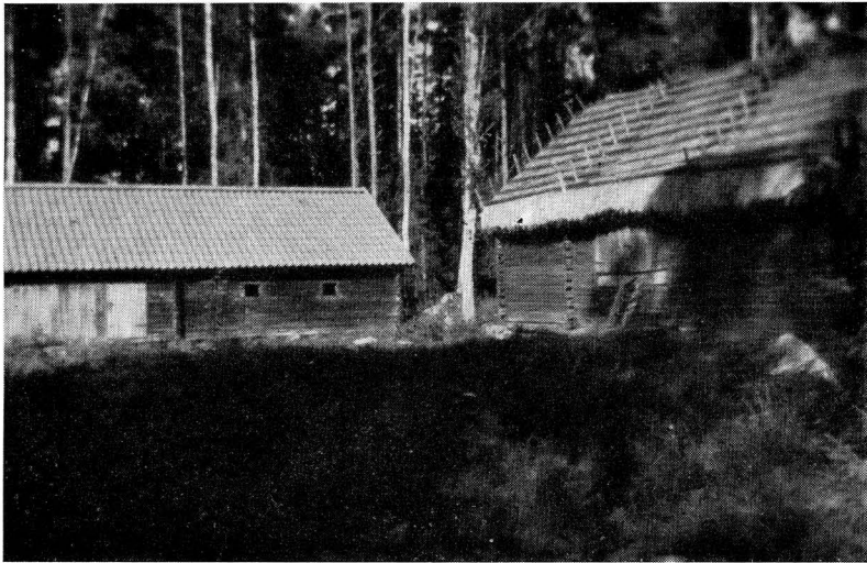
Bild 5. Från fägården i Mårtsbo.

Denna hans storslagna frikostighet har varit föreningen till ovärderligt gagn. Utan den hade förvisso Mårtsbogården nu ej varit i det skick den är.