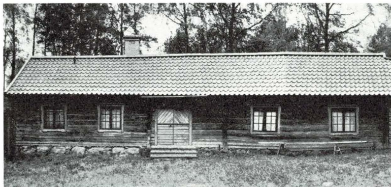
Bild 1. Parstugan från Offerbo, vid vars högra gavel källarstuga tillbyggs.

byggnad anskaffades från St. Laggårbo, vilken uppsattes i vinkel mot den förstnämnda portlidarsbyggnaden, alltså mitt emot parstugan. I den sistnämnda portlidarsbyggnaden finnes redskapsbod samt »pigkammare».