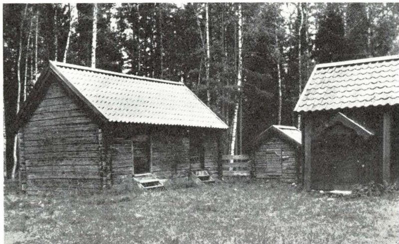
Bild 2. Kvarnboden och ena gaveln av portlidret från Stora Laggårbo; ingången till »pigkammaren» synlig å bilden.

Så tillkom en ängslada från Gräsbo, därefter en logbyggnad från Hemmingsbo. Dessa uthusbyggnader uppfördes utanför den kringbyggda gårdens område.