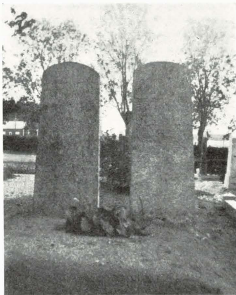
Familjegraven å Litslena kyrkogård.

honon. Mina föräldrar och Öberg voro grannar på den tiden han bodde i Hummelsta. Han var redan då mycket intresserad för gammalt och fornt. Han visste vad ortens runstenar hade att berätta, han talade om de olika gravfälten i orten och han berättade muntliga sägner. Han skrev i ortspressen och många ansågo honom vara något »konstig», andra sade att han var »tokig». På våren 1888 gjorde han auktion och flyttade in till Enköping, där han började tillverkning av äggtransportlådor, som han uppfunnit under sin Litslena-tid.