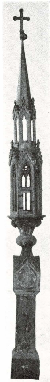
Bild 5. Sakramentshus från Väte, Gotland.