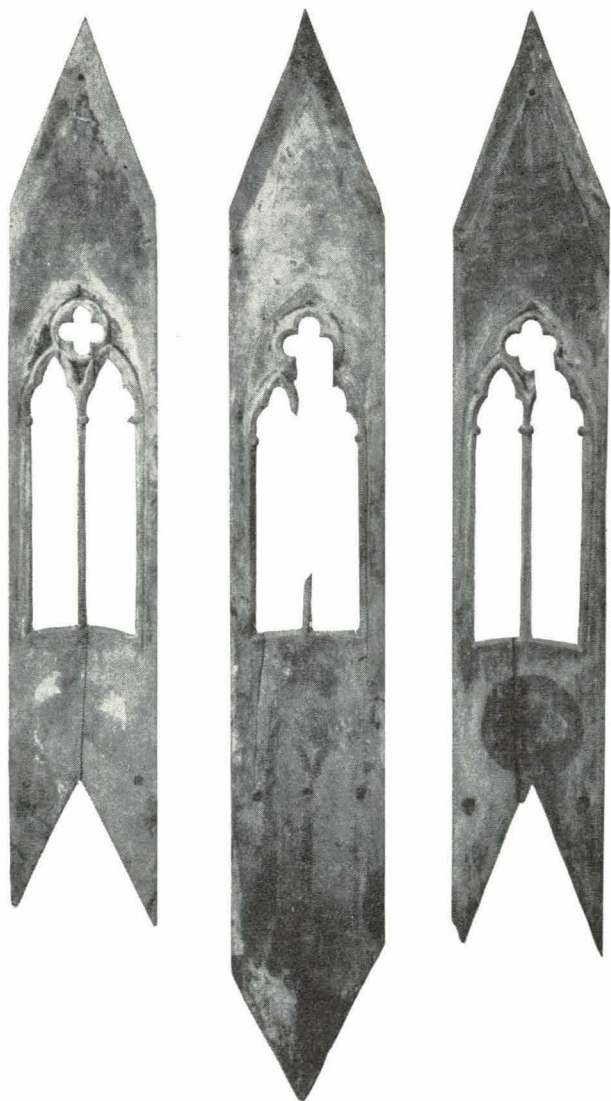
Bild 1. Ornerade bräder från Roslags-Bro kyrka, sidor i ett sakramentshus. Obs. märkena efter pålimmat listverk (ett spetsbågigt och två runda blindfönster under de egentliga fönsteröppningarna).