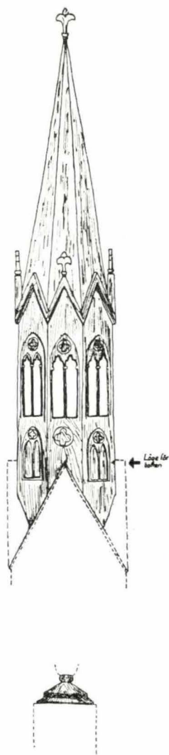
Bild 3. Sakramentshuset från Roslags-Bro. Rekonstruktionsförsök. I. Andersson del. 1938. Efter »Sveriges kyrkor».

Ett aktsamt och värdigt förvarande av »den heliga reserven», d. v. s. förrådet av invigda oblater (hostier) har alltid inom den katolska kyrkan varit en angelägenhet av största vikt. Någon bestämd regel härvidlag följdes emellertid icke under medeltiden. Sedan bl. a. det fjärde laterankonciliet (1215) uttryckligen bestämt, att sakramentet skulle förvaras sub clave , inom lås och regel, blevo i själva kyrkmuren, nära altaret, anbragta nischer, vanligen med däri inbyggda träskåp, den kanske vanligaste förvaringsplatsen. Särskilt på Gotland finnas flera sådana medeltida väggsåkåp bevarade, ofta med rik snidad ornamentik. Även här i Uppland ser man ej sällan en rektangulär nisch i kormuren, liksom i sakristian, där ävenledes ett altare ibland var uppställt. Bestämmelsen, att hostian skulle förvaras under lås hade flera grunder: en var utan tvivel rädslan för att den skulle stjälas