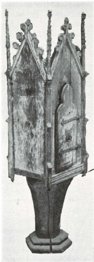
Bild 4. Det bevarade mellanpartiet av ett sakramentshus från Över-Järna, Södermanland.