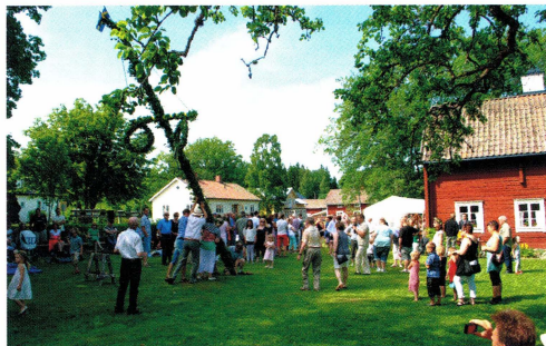
Midsommarstången reses i samband med firandet vid hembydsgården.

12 st vandrare samlades den 23 september för att vandra omkring i skogarna runt Klarbo-Västerbo. Det var en regntung höst-dag, men de som var med är ju av det rätta