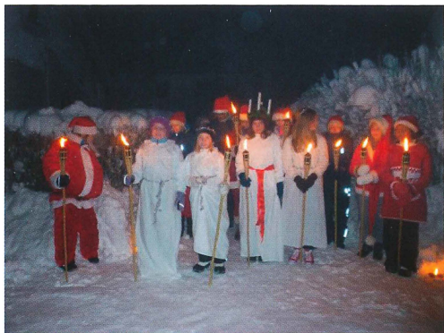
Månkarboskolans elever lussar i Ullfors andra advent.

backskolans elever från Månkarbo vandrade med facklor längs bruksgatan fram till Smedsstugans tun där de framförde en mycket uppskattad luciatablå.