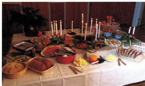
Julbordet står dukat med traditionella maträtter från Tenstabygden.

Genom att anordna en studiecirkel kring lokal mat- och hushållning, ”Mat och hushåll i Tensta – en gastronomisk resa genom seklerna”, under hösten 2012 och våren 2013 ville Tensta hembygdsförening sprida