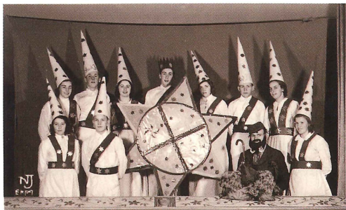
Julsjungare i Tillinge. Bilden tagen den 21 december 1941 vid en träning i full mundering.

ditioner från förr i Tillinge inför bröllop samt kring jul. Historien om julsjungarna vintern 1941/1942 kan få agera exempel: Ungdomarna startade de smått äventyrliga vandringarna redan vid halv femtiden på eftermiddagen på såväl juldagens kväll som på trettondagsafton. Snön låg djup när de pulstade mellan gårdarna för att sjunga inrepererade sånger och be om bidrag till idrottsföreningens bastu. Julsjungarna förplägades med massor av mat och det var trötta ungdomar som gav upp framåt morgonkvisten. Första natten fick de ihop 135 kr medan den andra natten, då man gick norr om gamla riksvägen, bara inbringande 101 kr. Tydligt var de "uppsoknes" boende snålare än de som bodde i södra halvan av Tillinge!