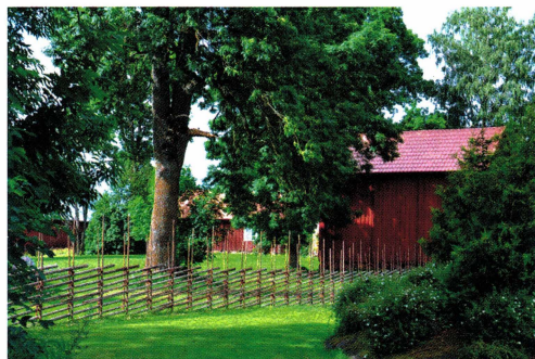
Den nya gärdsgården med hembygdsgården i Husbyborg i bakgrunden.