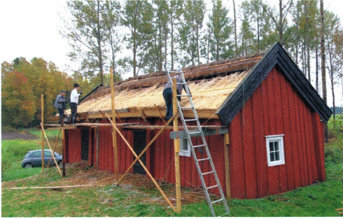
Omläggning av vasstaket på Markatorpets fähus.

Sommaren och hösten innebar byggnadsåtgärder främst på Markatorpet men också på museet, se de nymålade dörrarna på Börgeboden. Markatorpet har uppräschats påtagligt. En ny gavel på fähusets västra sida, ett nytt vasstak på fähusets nordliga tak och nya hängrännor i trä är uppsatta på torpstugan. Dessutom har fähuset, visthusboden och jordkällaren målats med falu rödfärg.