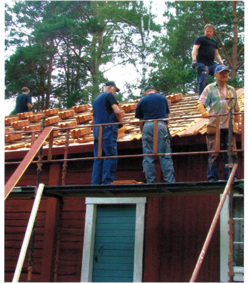
Omläggning av tegeltaket på parstugan från Rissänge på hembygdsgården.

Under hösten 2012 lades tegeltaket om på parstugan på Harbo hembygdsgård. Parstugan flyttades från Forsens i Rissänge till Harbo hembygdsgård och stod färdig till invigningen 1947. Ett glatt gäng av snick-