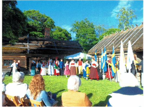
Nationaldagsfirande på friluftsmuseet Kvekgården.

Årsmöte hölls den 9 mars i Hjalsta bygdegård. Ett sextiotal medlemmar hade hörsammat kallelsen. Efter årsmötesför-