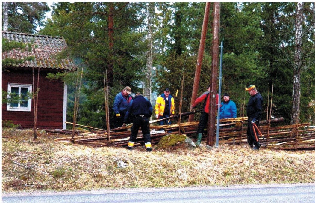
Gärdesgårdbyggnad vid Mårtsbogården.

Lördagen den 2 juni var nog den kallaste och regnigaste dagen på hela sommaren. Trots detta kom både försäljare och köpare till vår trädgårdsdag. Inte blev det bättre på kvällen då sommarandakt och källdrickning hölls vid Horsskogs trefaldighetskälla.