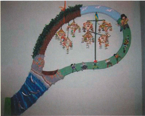
Lövet med temat "Älven, havet och fisket" var föreningens bidrag till hemslöjdsutställningen på Liljevalchs i Stockholm.

bilder på djur och natur. Under en helg i maj samlades ett tjugotal medlemmar, för att städa gårdarna och röja busk och sly. Lunch intogs i Sörmyrgården och bestod av ärtsoppa med tillbehör. Nationaldagen och midsommarfirandet firades traditionsenligt på Festplatsen. Där kunde man även avnjuta festkommitténs goda laxmackor.