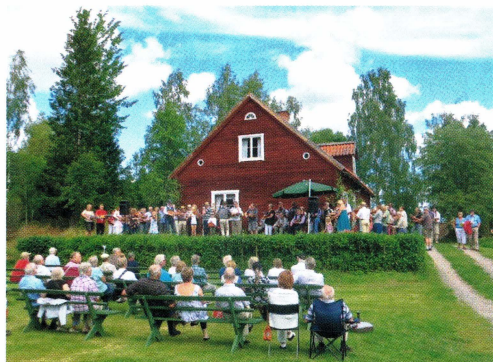
Allspel vid spelmansstämman vid hembygdsgården i Vigelsboäng 2012.