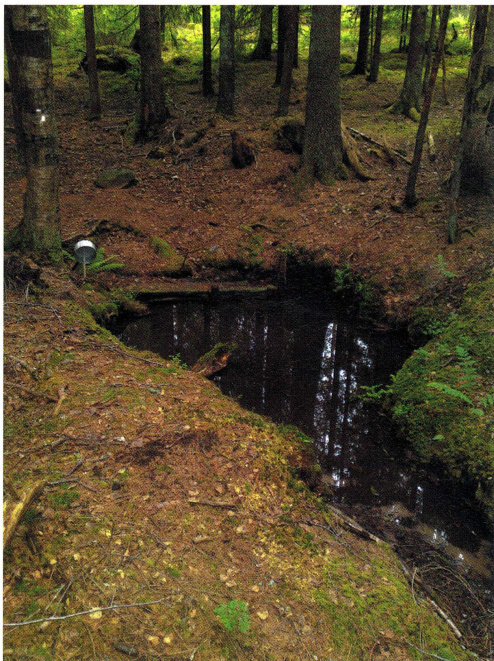
Trefaldighetskällan vid Olsbo besöktes på Trefaldighetsafton.

Under sommarsöndagarna var det kafeservering på hembydsgården, där man också kunde besöka Runstensmuseet, inrymt i den gamla linbastun, och köpa lokala hantverksalster i Persboboden från 1692. På fredagskvällarna under sommaren arrangerade Runhällens byalag välbesökta hembydsgillen på hembydsgårdens tun.