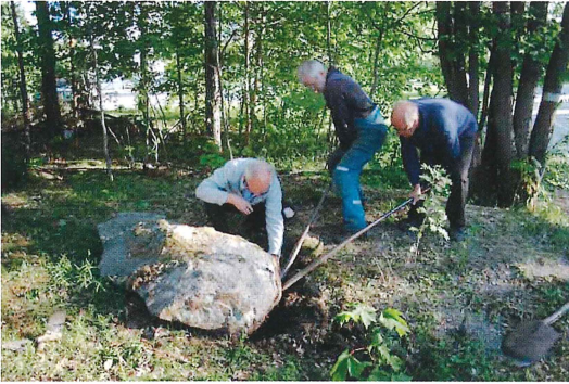
Gränsstenen påträffades i närheten av Norbyvägen dit den troligen flyttats i samband med vägbygget.