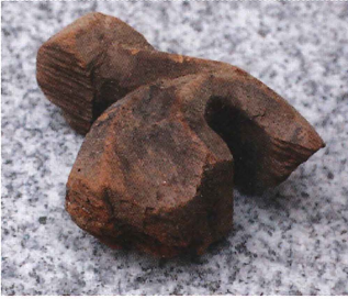
Figur 3. Trädetalj (7x9 cm) i gotisk stil från korbänk.