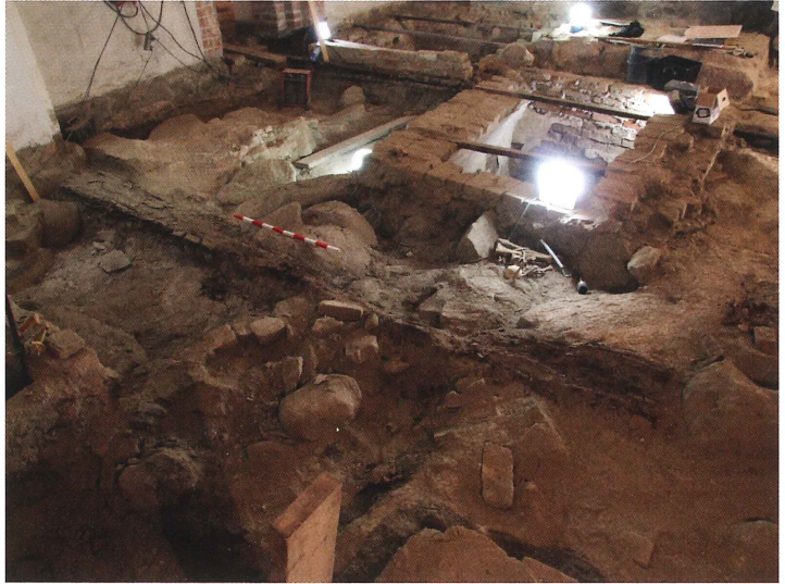
Figur 2. På bilden syns den västligaste bjälken, benämnd 1 i figur 1, framför meterstaven. I norr är träkonstruktionen redan borttagen. Bakom bjälken syns bland annat ärkebiskop Henrik Benzelius (död 1758) gravkammare.

struktionen. Trots att träet var förhållandevis dåligt bevarat kunde denna bjälke dateras med hjälp av dendrokronologi. Bjälken var tillverkad av en mellan 100 och 130 år gammal tall som fällts runt år 1336. 4 I norr fanns även trärester längs muren. I mellanrummet mellan träbjälkarna och träresterna längs muren fanns ett grunt tomrum, en svacka med lösa fyllnadsmassor. Här hittades snidade trädetaljer som troligen kommer från en gotisk korstol (figur 3). På samma ställe fanns också sex mynt. De två äldsta var präglade 1363–1370 respektive 1370–1380, det yngsta år 1600. De övriga