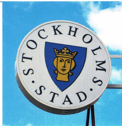
Fig. 1. Skylt med Stockholms stads vapen. Sandsborgsbadet, Enskede.

Den idealiserade bilden av Sankt Erik har förekommit i Stockholms stadsvapen ända sedan 1300-talet. 1 I sin nuvarande form härrör vapnet från 1934. 2 Förebilden är hämtad från en träskulptur i Roslagsbro kyrka i sydöstra Uppland som visar ett kungahelgon i helfigur (fig. 2). Skulpturen har traditionellt uppfattats som en framställning av Sankt Erik, men på senare tid har flera forskare argumenterat för att den egentligen varit avsedd att återge Sankt Olof. 3 Är omtolkningen riktig skulle den