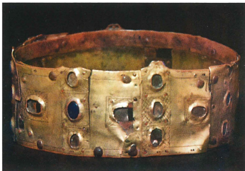
Fig. 8. Begravningskrona av förgylld koppar. Kronan förvaras nu inuti Sankt Eriks skrin i Uppsala domkyrka.

Olofsskatten ända tills den avskaffades i samband med reformationen. 36