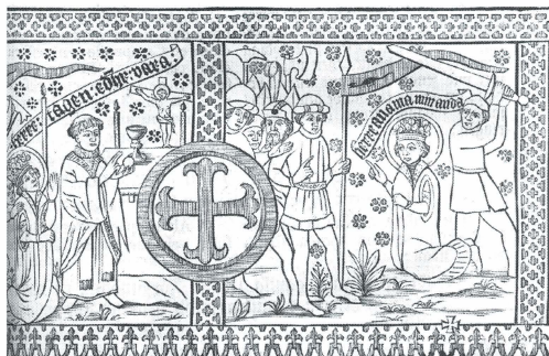
Fig. 10. Detalj av en nu försvunnen framställning av Erikslegenden i Gamla Uppsala kyrka. Träsnitt i Johan Peringskiölds Monumentorum sveo-gothicorum liber primus, Uplandiae partem primariam Thiundiam (1710).

Ett av syftena med mirakelsamlingen bör ha varit att den skulle ligga till grund för en kommande officiell kanonisering av Sankt Erik, men någon sådan genomfördes som nämnts aldrig. 43 På det lokala planet spelade miraklerna däremot en framträdande roll. I det officium till Sankt Eriks ära som sammanställdes under 1200-talet finns t.ex. flera hänvisningar till helgonets helbrägdagörande ingripanden. 44 Här ingår också avsnitt ur Erikslegenden med uppgifter om kungens korståg till Finland och hans martyrium i Östra Aros. Man kunde förvänta sig att dramatiska berättelser av det här slaget snabbt skulle kunna ge upphov till nya motiv i Sankt Eriks ikonografi, men så blev inte fallet. Under hela 1300-talet återges helgonet istället liksom tidigare nästan alltid stående iförd en kunglig dräkt