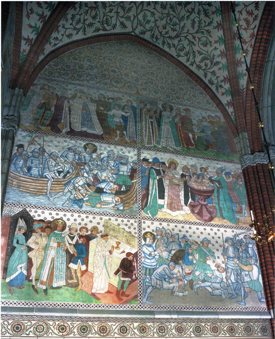
Fig. 15. Scener ur Erikslegenden. Hårt restaurerad målningsväv i det De Geerska gravkoret i Uppsala domkyrka.