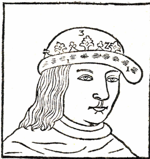
Fig. 11. Sankt Erik. Detalj från den nu försvunna Sankt Erikstapeten i Uppsala domkyrka. Träsnitt i atlasbandet till Olof Rudbecks Atlantica (1679).