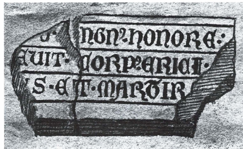
Fig. 7. Fragment från Sankt Eriks medeltida grav i Uppsala domkyrka. Teckning i KB Fl 4b.

Parallellt med byggnadsaktiviteterna pågick utarbetandet av ett antal skrifter som behövdes för helgonkulten. Under 1200-talets senare del och 1300-talets början tillkom både en legend, ett officium och en samling mirakelberättelser, där Eriks helighet på olika sätt framhävdes och bekräftades. 33 Även om man naturligtvis inte skall underskatta inslaget av verklig fromhet i domkapitlets strävan att utveckla Erikskulten är det tydligt att såväl ekonomiska som