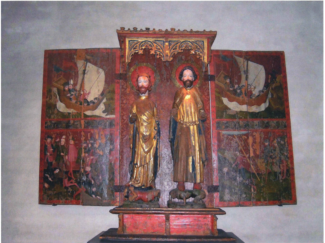
Fig. 9. Altarskåp från Länna kyrka med avbildningar av Sankt Erik till vänster och Sankt Olof till höger. Statens historiska museum, Stockholm.

i högmedeltidens Sverige. Ett bra exempel utgör berättelsen om kyrkoherden Martin i Edebo, som när han var på väg hem från ett prästmöte i Uppsala 1293, föll av hästen så olyckligt att han landade med huvudet före på en trädot. 41 Filthatten sprack som en dålig cykelhjälm och kyrkoherden fördes omtöcknad till en prästgård i grannskapet,