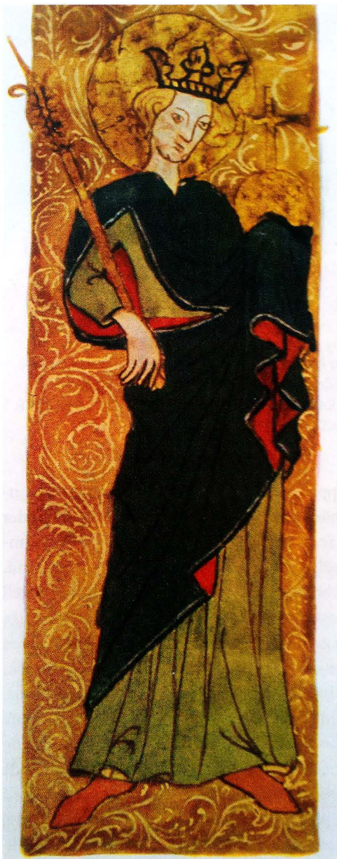
Fig. 4. Sankt Erik. Illustration i en handskrift av Erikslegenden som bl.a. har tillhört drottning Kristina. Vatikanbiblioteket, Rom.