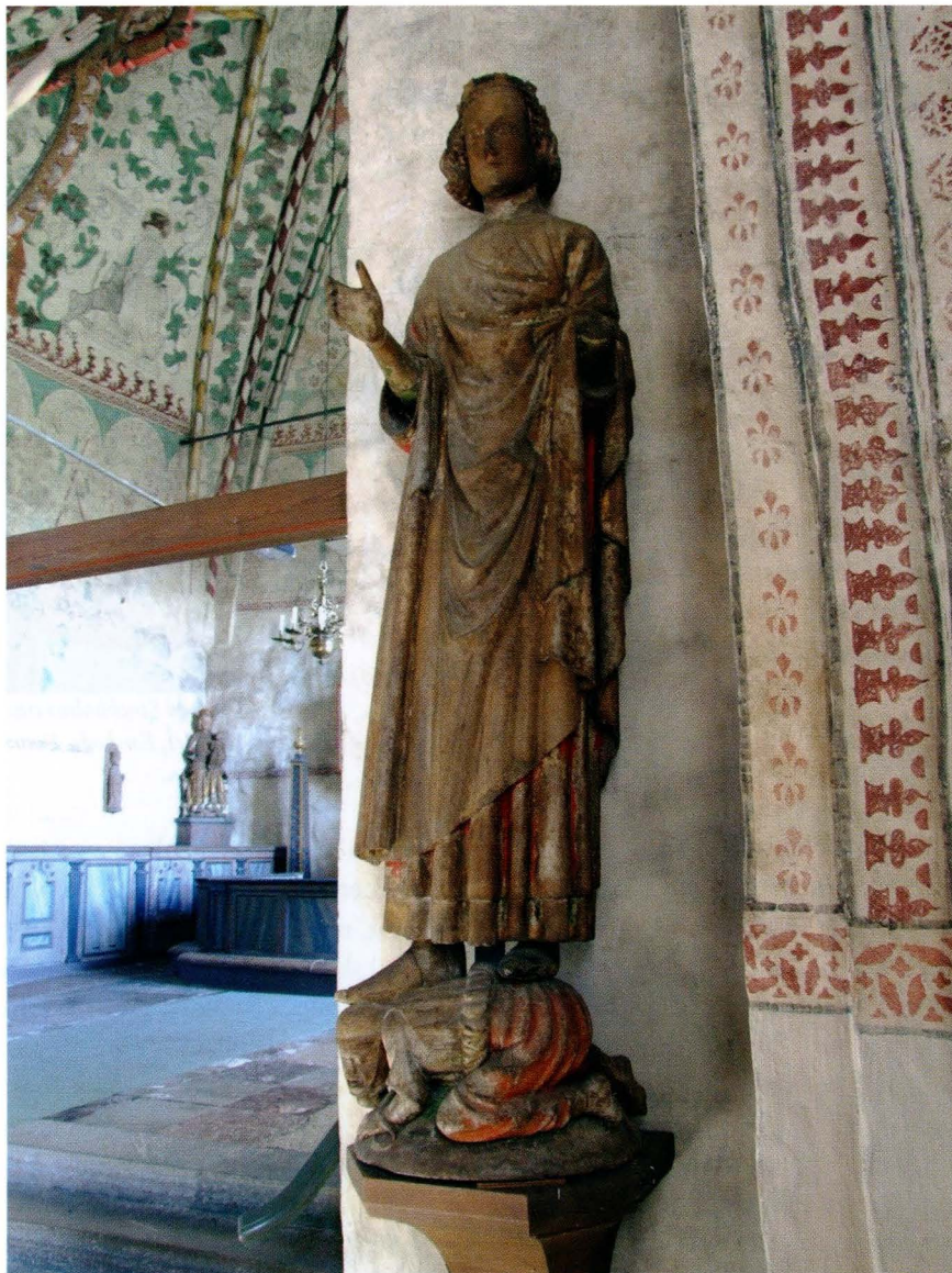
Fig. 2. Helgonskulptur i Roslagsbro kyrka, Uppland, som omväxlande uppfattats som Sankt Erik och Sankt Olof.