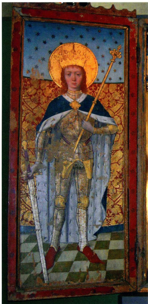
Fig. 6. Sankt Erik. Detalj ur ett altarskåp från Salems kyrka, Södermanland. Statens historiska museum, Stockholm.

om "sancti Eric konungx domkyrka" och liknande belägg finns i flera andra handlingar från 1400- och det tidiga 1500-talet. 22 Utvecklingen har paralleller på kontinenten, där man under perioden 1200–1350 alltmer övergick till att dyrka nykanoniserade helgon istället för de gamla välkända martyrererna från fornkristen tid. 23 I synnerhet de påvliga kanoniseringarna av Thomas Becket 1173 och Bernhard av Clairvaux 1174 tycks ha varit betydelsefulla i sammanhanget. 24 Fördelen med lokala helgon var att de gjorde det möjligt att presentera ett rikare utbud av undergörande föremål. Den som sökte sig till Uppsala domkyrka under senmedeltiden hade inte bara chansen att få se Sankt Eriks skrin med relikerna, utan också en tagelskjorta, en begravningskrona och ett baner som associerades med honom. Möjligheterna till inlevelse måste därmed ha ökat betydligt (se vidare Exklusivitet och folklighet ).