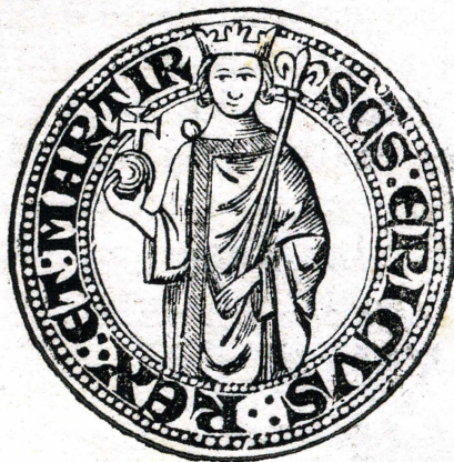
Fig 3. Uppsala domkapitels sigill 1275, återgivet i ett kopparstick i Johan Peringskiölds Monumenta Ullerakerensia (1719). Sigillets omskrift lyder: "SANC'TVCVS : ERICVS : REX : ET : MARTIR" (=Sankt Erik, kung och martyr).

Erikskulten hade under hela medeltiden sitt starkaste fäste i Uppsala och det svenska ärkestiftet. 9 Flera av de tidigaste avbildningarna av helgonet härstammar också härifrån. Den äldsta säkra framställningen finns i ett avtryck av Uppsala domkapitels sigill från 1275 (fig. 3). 10 Kungen återges här som en höggotisk idealfurste med mantel, spira,