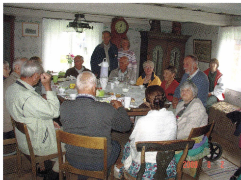
Några medlemmar födda 1929 (jämånåriga med föreningen) kom till 80-årsjubileet.

Midsommarfirande på Gammelgården med musik, ringdans och lekar arrangerades i egen regi. Hembygdsfesten, som vanligt första söndagen i augusti, bjöd på