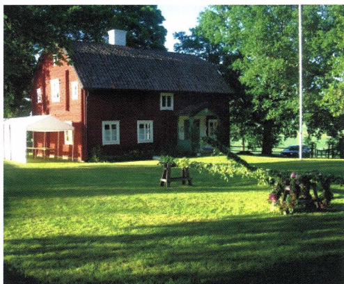
Allt klart för midsommarfirandet på hembygdsgården i Altuna.