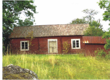
Parstugan som planeras bli Härnevi hembygdsförenings hembygdsgård.

Bymarknaden hölls för sjunde gången den 14 juni. Trots kyla och 37 mm regn kom besökare i långa rader, iklädda regnställ med glatt humör. Utställarna, ett 40-