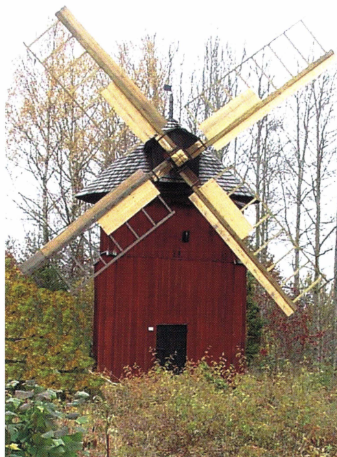
Väderkoarnen i Knutby reparerades under året.