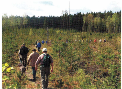
Kyrkstigsvandring mellan Kättsbo och Lagmansbo den 19 maj.

Nationaldagen firades som vanligt tillsammans med kyrkan och Lions. Efter flagghissning, diktläsning och sång tågade deltagarna till kyrkan där skriben-