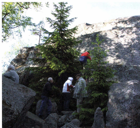
Vid vårutflykten den 3 juni besteg flera deltagare den stora Myggstenen.