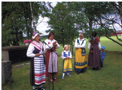
Nationaldagen firas vid tegelkyrkans grund i Balingsta.