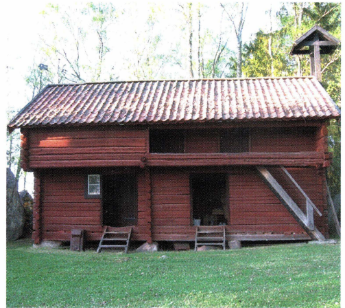
Intill hembygdsgården ligger denna timrade loftbod, flyttad från Björksta.

Torgestagården har varit uthyrd vid fyra tillfällen och bland egna aktiviteter kan den välbesökta "grötfesten" då hiskeliga historier berättades, nämnas. I maj