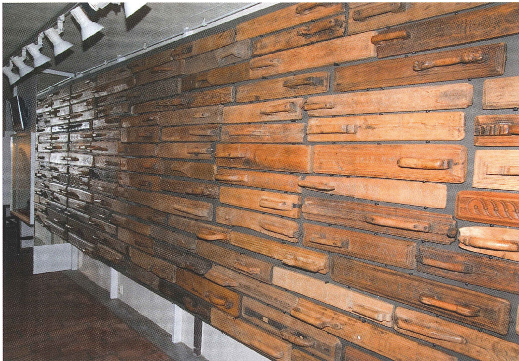
Collage av mangelbräden i Upplandsmuseets samlingar. Utställningen Samla på Uppland 2009.

med utgångspunkt från det tekniska utförandet, dominerar den grupp som kan hänföras till slöjdproduktionen på landsbygden utförd av lekmän. Fallenheten för träskärning och mönsterkomposition varierade i hög grad, och vi kan se prov på såväl valhant utförda mangelbräden som tekniskt och konstnärligt långt drivna praktexemplar.