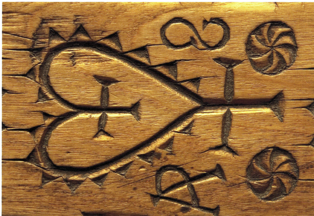
Hjärta med inskrivet kors. Detalj av mangelbräde med träsnideri, daterat 1774. UM01544.

liv och utvecklade en egenartad karaktär, ibland med lokal särprägel. Typiskt för folkkonsten är att mycket ålderdomliga stildrag levtt kvar långt fram i tiden och att olika stilar blandats på ett våghalsigt men uttrycksfullt sätt. Förutom det rent estetiska syftet med utsmyckningen hade former och mönster ibland också en magisk dimension. Allt detta är mangelbräderna tydliga exempel på.