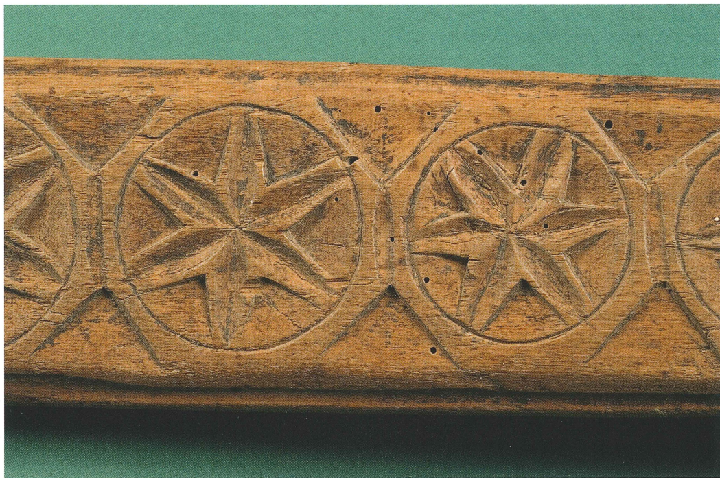
Rosetter. Detalj av mangelbräde från Husby Långhundra socken med träsnideri utfört i karvsnitt. UM14333.

slingor, blomsterurnor, tulpaner, hjärtan, kors, kronor och stjärnor. Korshjärtat, ett hjärta med inskrivet kors, är ett vanligt motiv på uppländska mangelbräden sedan 1700-talet, påtalar folkkonstkännaren Johan Knutsson. Ofta har också monogram och årtal inkomponerats i mönstret. 5