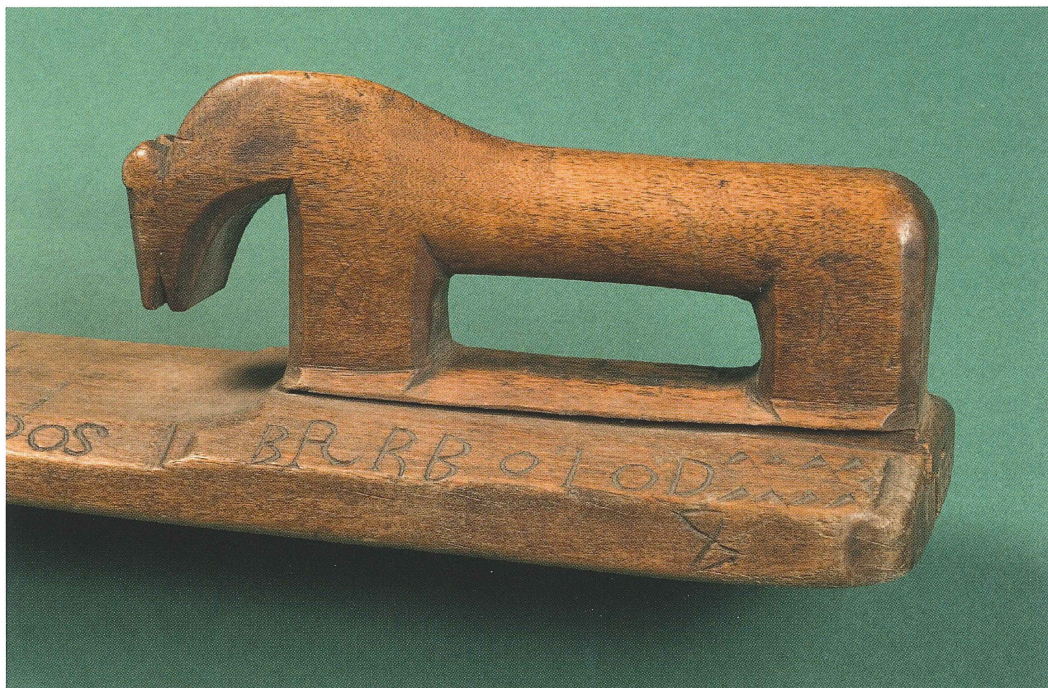
Handtag på mangelbräde i form av en häst . UM03313.