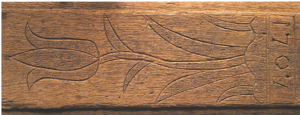
Tulpan. Detalj av mangelbräde med träsnideri, daterat 1707. UM04724.