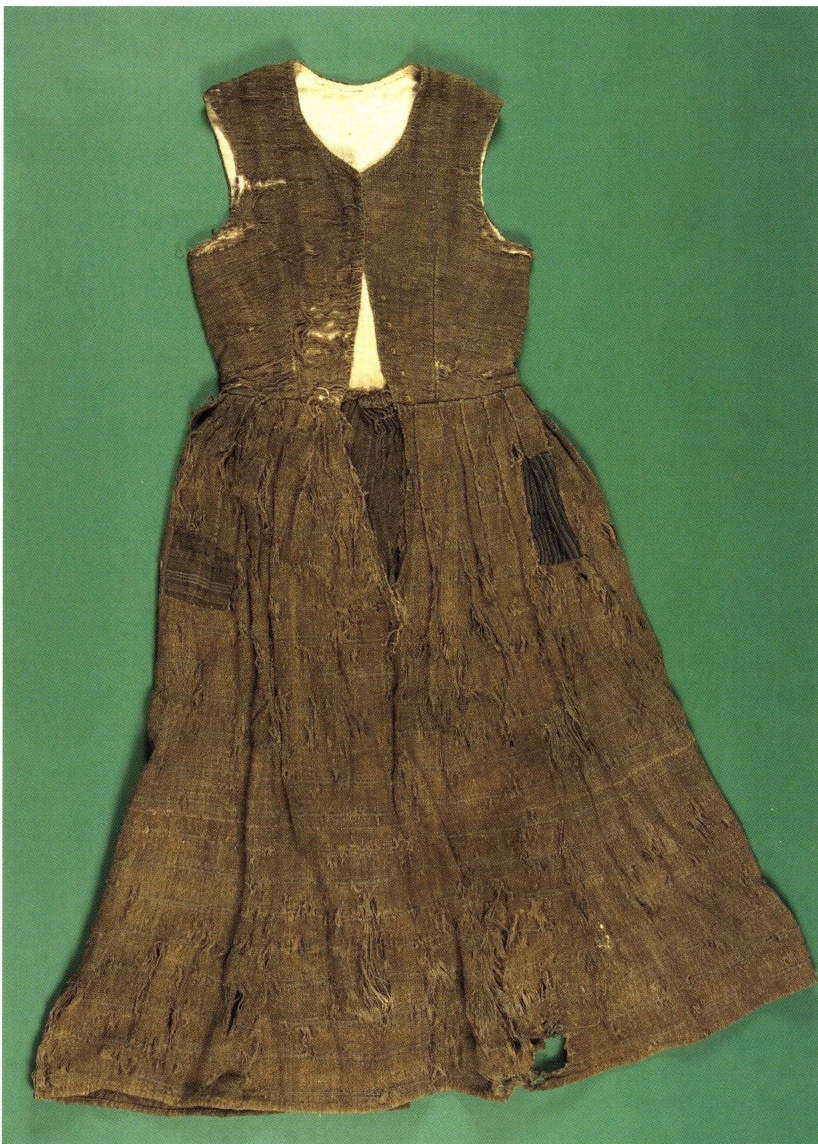
Livstycks skjol av halvylletyg präglad av nyrokostilen. 1800-talets mitt eller andra hälft. UM23239