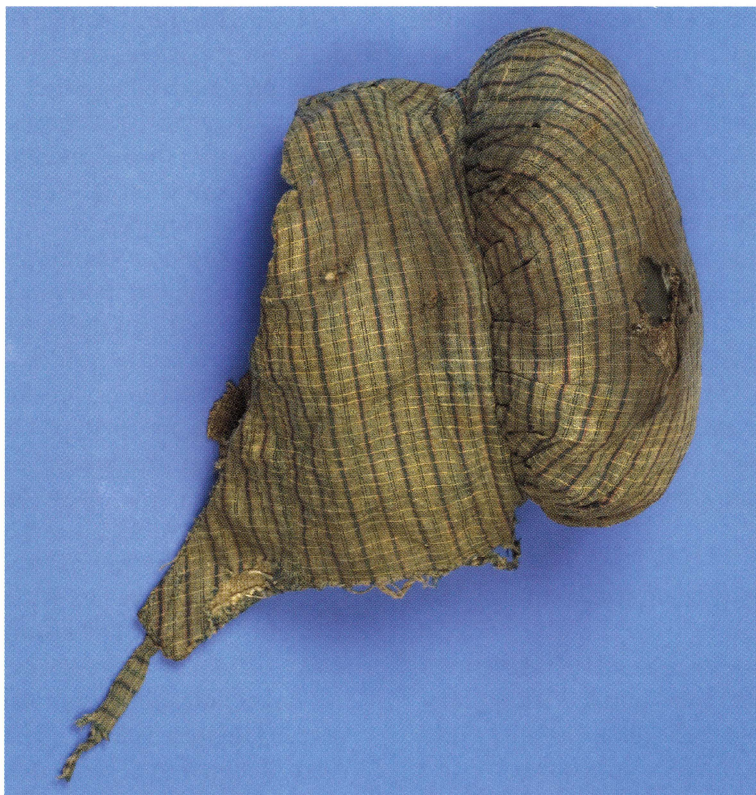
Mössa av bomullstyg för flicka. Mössan har nackstycke och sidstyckena täcker öronen och knyts med band under hakan. UM23267