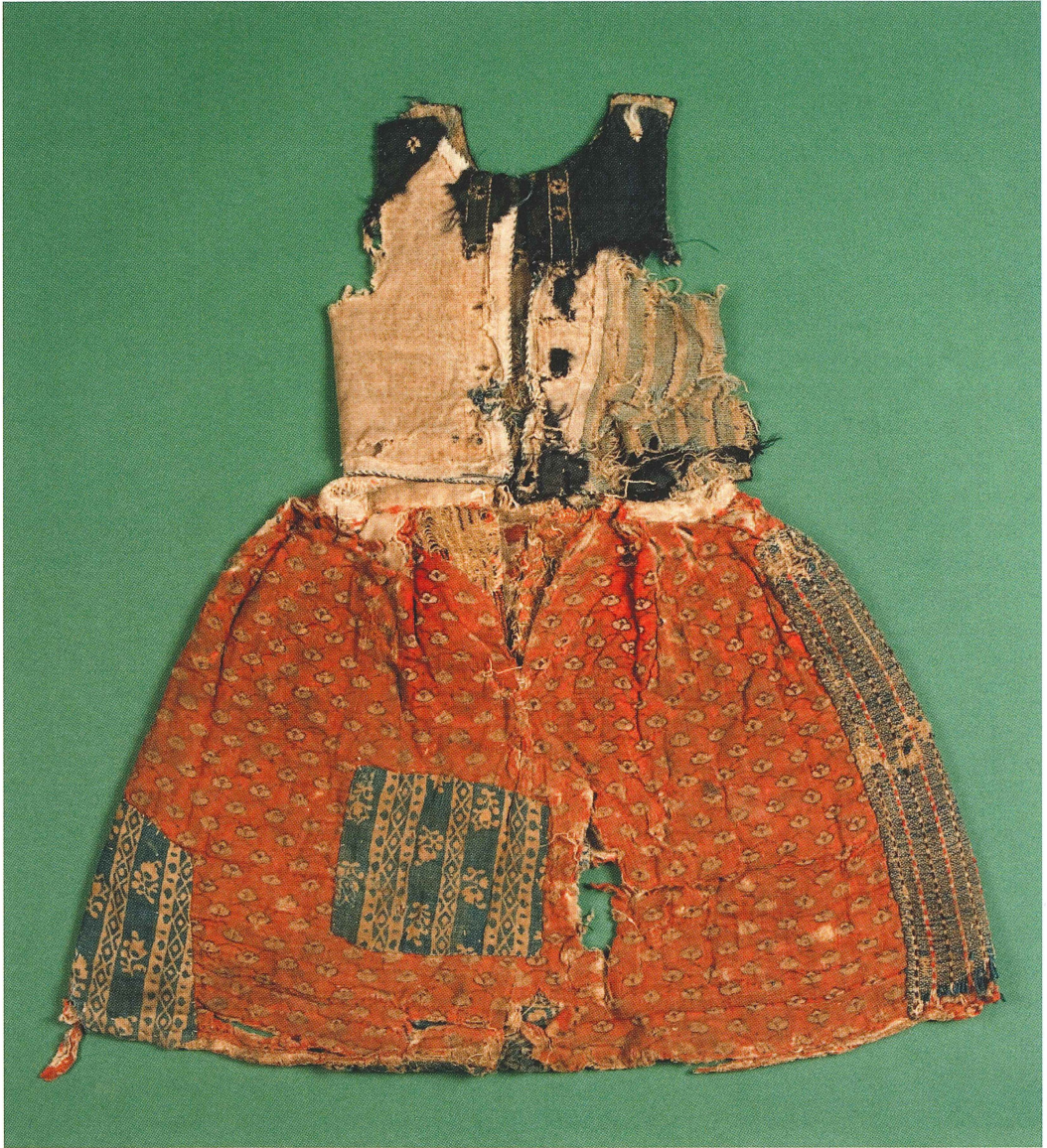
Livestyckskjol för flicka. Livet har snörhål längs kanterna framtill. Kjolen är matelasserad och lagad med tryckta bomullstyger. UM23244