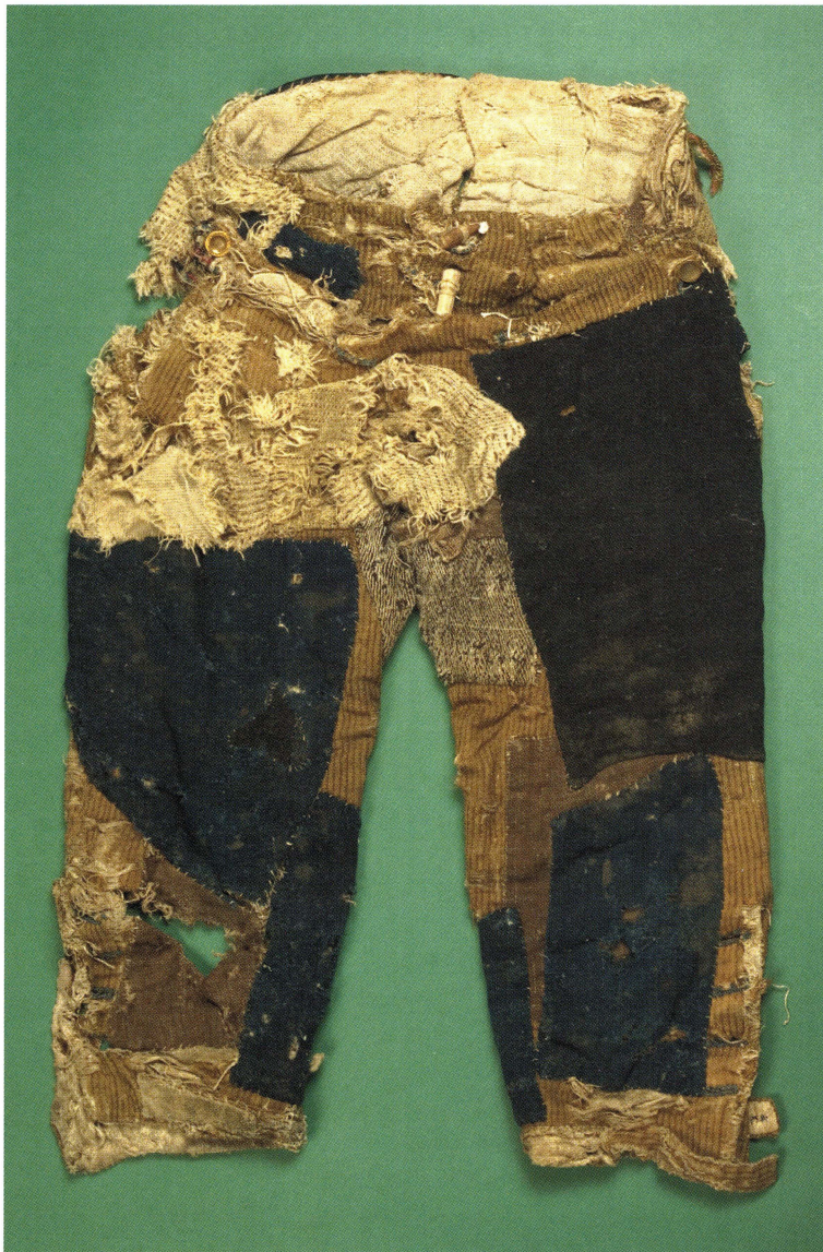
Knäbyxor av haloylletyg. Plagget har lappats och lagats för att så länge som möjligt duga som arbetsplagg. UM23251.