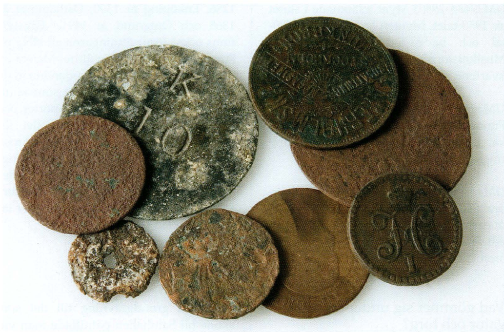
Figur 7. Mynt och polletter (UM25882) påträffade vid Stentorpet i Vassunda socken.

UM25882 8 mynt och polletter (fig 7). Hittades mellan åren 1913–1939 vid rensande av rabatter utanför torpet Stentorpet, Vassunda socken. Torpet hörde till Skoklosters slott som ligger mittemot vid Skoklosterfjärden. Vägen till Stockholm gick genom Vassunda socken och den så kallade Skovägen som utgick från Stockholmsvägen slutade vid Stentorpet. Torparen hade skyldighet att ro över besökare till slottet. Hästarna fick stå i en lada i närheten. Besökarna bytte om i stugans sal och tappade då, enligt givaren, ofta