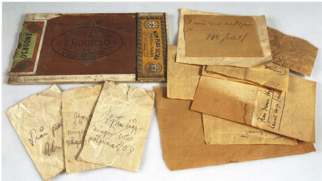
Figur 12. Emballage som rymt föremål från undersökningarna av Studentholmen 1907.

Beskrivningarna kring hur och var föremålen hittas blir vid dessa nyare undersökningar mindre fantasieggande än vad de kanske blivit för vissa av lösfynden som nått vårt magasin. Det rör sig om ganska torra lägesrapporteringar, som till exempel för kritpipan UM20277 påträffad i kvartret Duvan, Uppsala. "Fyndomständighet. Arkeologisk undersökning, 1960. Tomt nr 4, fyndplats 2."