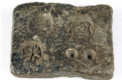
Figur 4. Gjutformen UM2455. Funnen mellan Vaksala backe och Gränby backe.