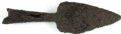
Figur 1. Spjutspetsen UM160. Det första registrerade förhistoriska föremålet.