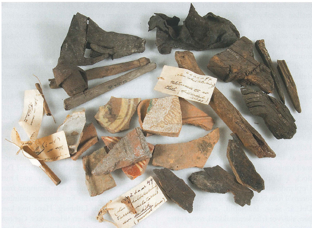
Figur 8. Föremål från Studentholmen.

struktioner, men också byggnader. De byggnader som framkom var i huvudsak av tegel, men det fanns också knuttimrade konstruktioner. 7 Ska man göra en lång grävhistoria kort, så tolkade man merparten av de påträffade resterna som delar av byggnader med koppling till det första universitetet, anlagt 1477 av ärkebiskop Jakob Ulfsson. Några byggnads-