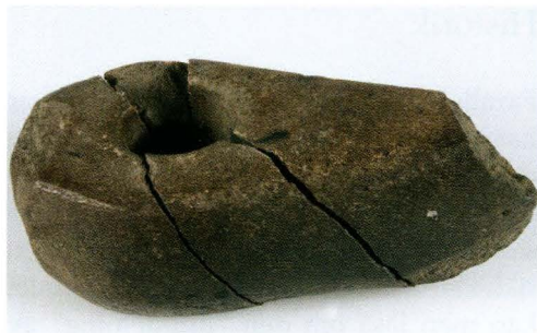
Figur 3. Stenyxan UM774 funnen vid Östuna skolhus, Östuna socken.