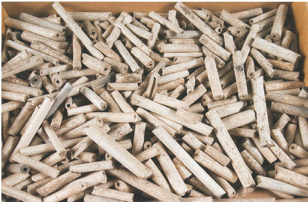
Figur 11. Kritpipor, UM18270, funna vid undersökningarna av franciskankonventet i Uppsala.

Lådan skulle till: Landsantikvarie Nils Sundquist, Gustavianum, Uppsala. Lådan var packad med blandat medeltida material: sten, glas, kritpipor, ben, horn, delar av vägg och väggmålning, bronsplåtar m.m. (fig 10). Materialet i lådan är nu registrerat och inlagt i Upplandsmuseets föremålsdatabas.