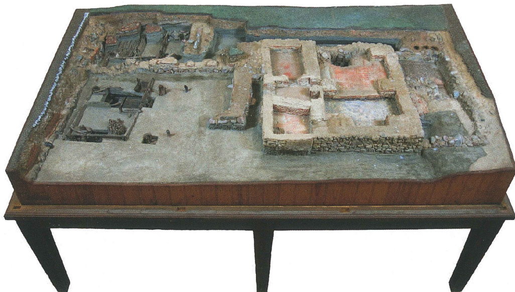
Figur 9. Modell UM26233 föreställande utgrävningen av Studentholmen 1907.

förvisso inte ovanligt, men de lever sällan vidare efter det att undersökningen är avslutad och rapportskrivandet tar vid.