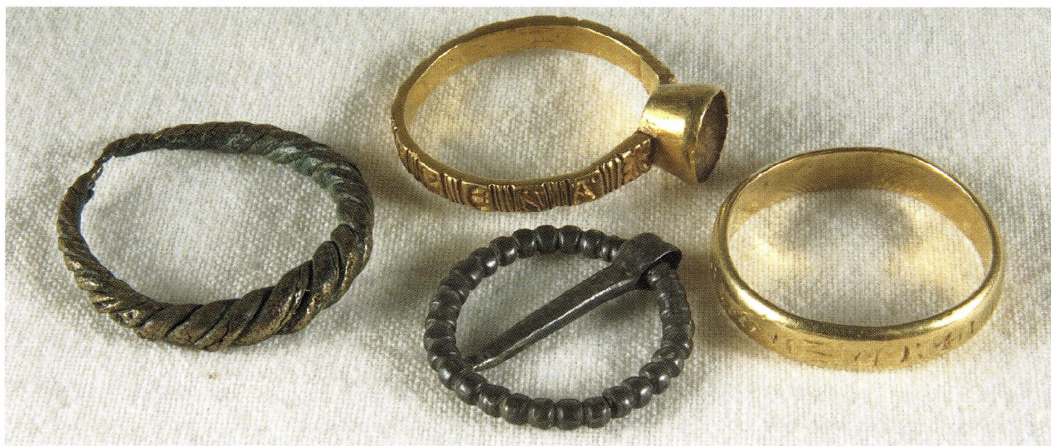
Figur 6. En gång i tiden borttappade smycken och dräkttillbehör.