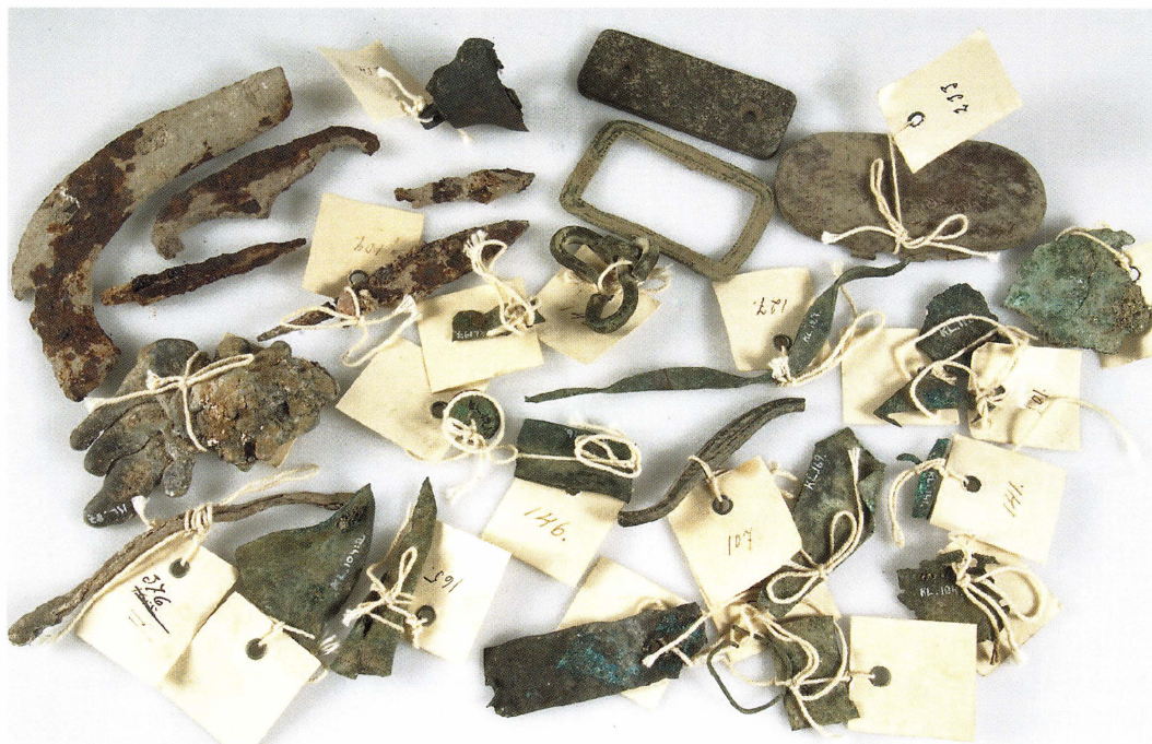
Figur 10. UM27097f. Några metallföremål, förmodligen påträffade 1929 i samband med undersökningarna av kvarteret Näktergalen i Enköping.

kvarteret S:t Per, undersökningarna i kvarteret Torget (franciskankonventet) framför allt under åren 1962–63 och 1971–72 samt de utgrävningar som 1978 gjordes i kvarteret Kransen. 14 (Fyndmaterialet från kvarteret Kransen finns på Statens historiska museum i Stockholm. Ett urval av föremålen finns dock deponerade i Upplandsmuseets utställning "Vårt Uppsala – Medeltiden".)