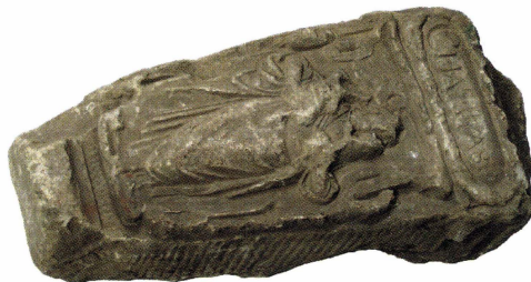
Figur 5. Relief UM2552. Påträffad 1929 i stenmur i Husby-Ärlinghundra socken.