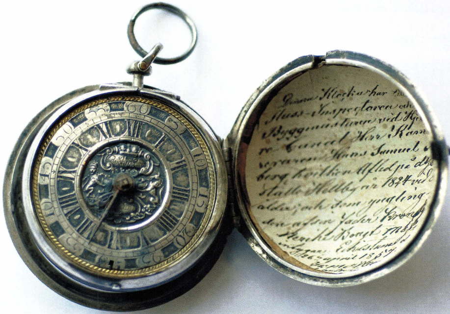
Fickur. UM 2.

målet inte själv bär. Det är i mellanrummet mellan föremålen som kunskapen ligger. Vem vågar idag skratta åt en serie årder och plogar om det visar sig att årdrrets konstruktion i själva verket gav upphov till mindre utsläpp av växthusgaser än plogen?