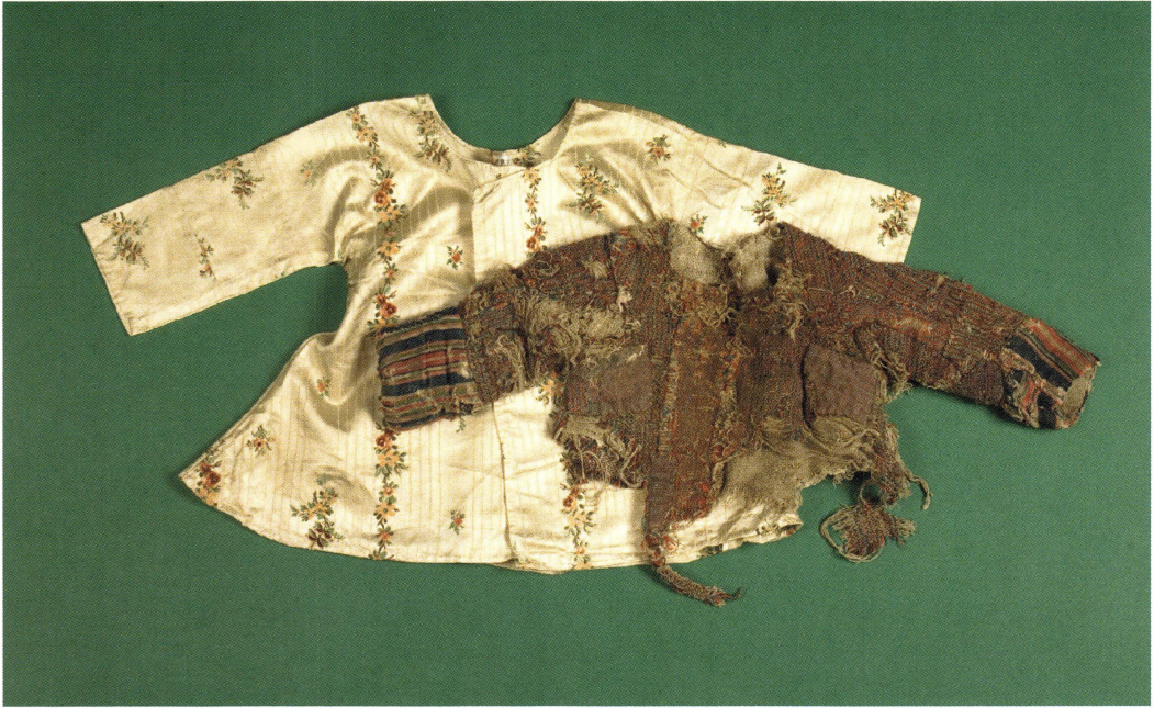
Kolten i siden är från slutet av 1700-talet och kommer från godset Salsta i Lena, medan den lappade och trasiga kolten är från bondgården Vargsättra i Riala. UM 18 751. UM 23 260

är förmågan till empati, till inlevelse med andra människor. Likaväl som vi för ett ögonblick kan leva oss in i andra människors villkor så kan vi överbygga tiden.