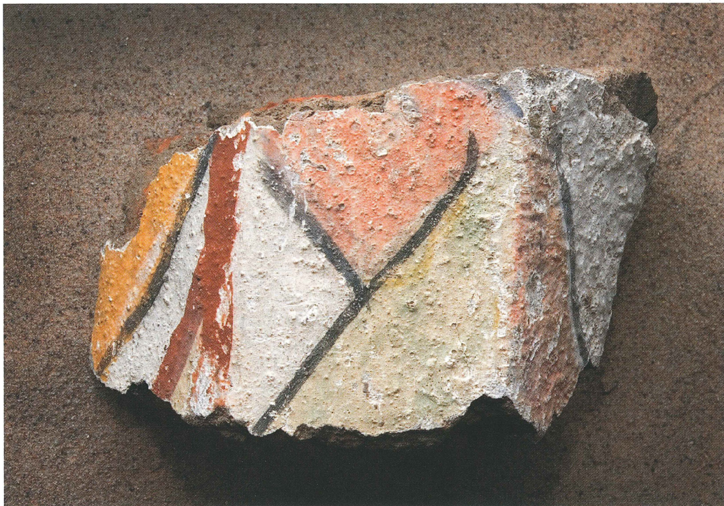
Murtegel med rester av målad dekor vars upphovsman är Albertus Pictor. Tillvarataget i samband med undersökningarna av S:t Pers kyrka, Uppsala. UM 21 265a.

kännetecknar arkeologens verksamhet när denne genom några nyanser av färgskillnad förmår urskilja en förhistorisk boplats. Det kännetecknar bildantikvarien som ur några andra nyanser kan skilja en fotograf från en annan. Det antikvariska ögat är upptränat att upptäcka när kanske några tegelstenar, några få nyanser rymmer den avvikelse som får hela perspektivet att omprövas och förskjutas.