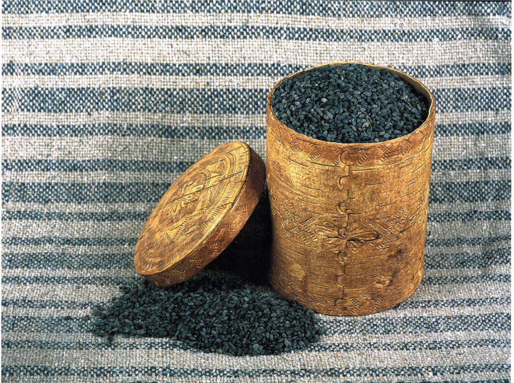
Bränd spannmål från 200-talet e. Kr. Säden är påträffad vid en förhistorisk byggnad i samband med arkeologiska undersökningar i Bredåker, Gamla Uppsala. UM 32 610_1100.

samlingarna finns kraft att spränga och upplösa motsatsen mellan natur och kultur, mellan verklighet och återsken.