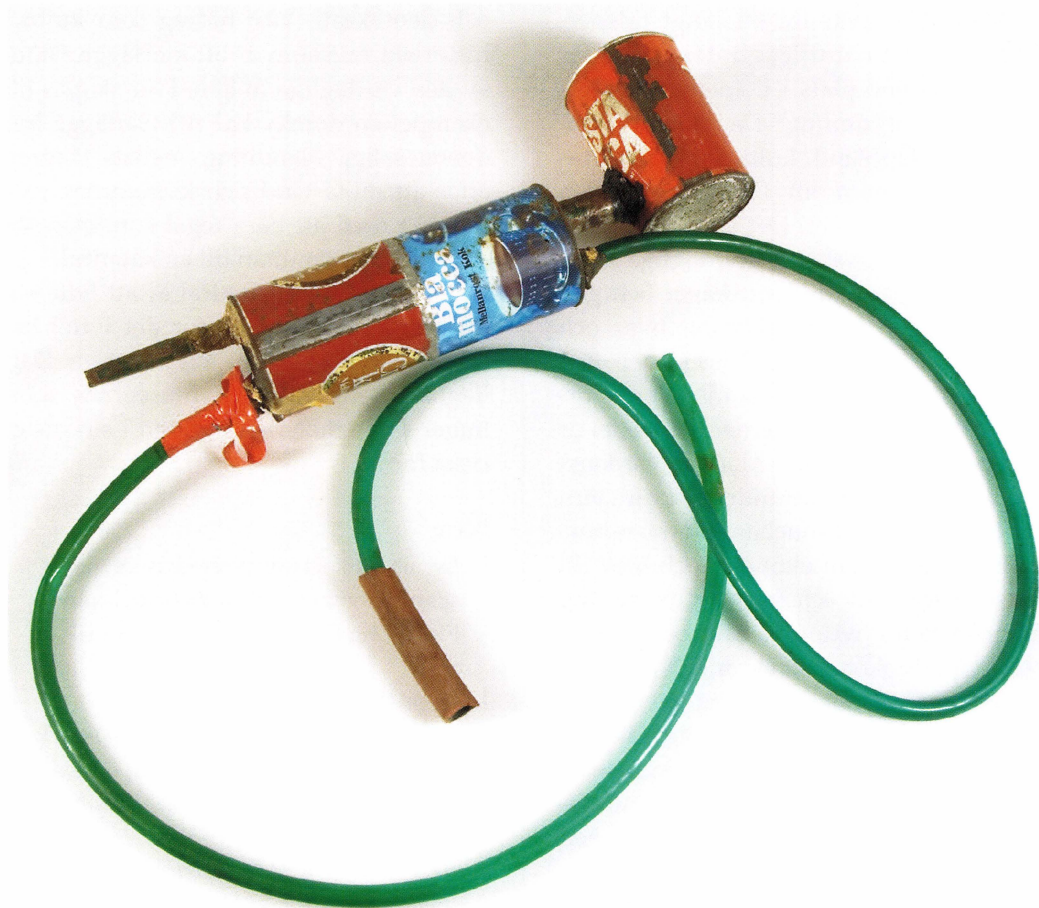
Hembränningsapparat. UM 41558.

uret bars av en man – en kanalkonstruktör – i början av 1800-talet under inledningen av den industriella utvecklingsoptimismens era. Fickuret är både en manlighetssymbol och en symbol för att den nya tiden nogra måste mätas för att framtiden