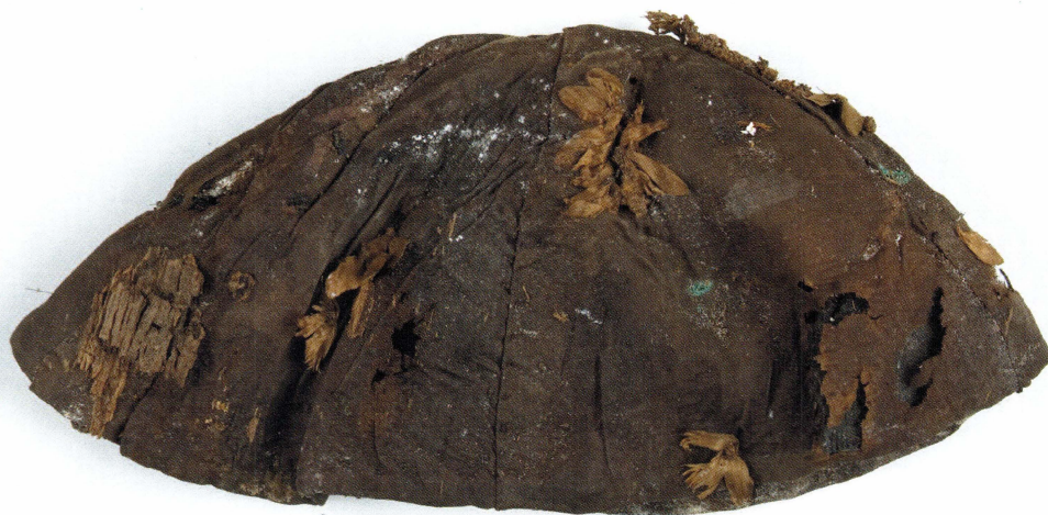
Det materiella överlever oss. Hätta med blommor. Del av begravningsdräkt, funnen i samband med arkeologiska undersökningar av Uppsala domkyrka. Kransen återfanns i rasmassor under kyrkan. UM 41 791_03.

Genom att våra frågor är förbundna med historiens spår leder det till att samtiden bär på frågor med ursprung i olika tider. Mellan jackan som tillhört en ung punkare och rocken som burits av en bonde är det ungefär hundra år. Dessa hundra år tvingar oss att formulera olika frågor när vi ställs inför de båda plaggen. Samtidigt finns det också frågor till båda dessa föremål som är gemensamma. Tiden skiljer oss åt men den förenar oss på samma gång. Den ene bar sitt plagg i en agrar miljö före välfärdssamhällets genombrott och plagget skulle sannolikt användas livet ut. Många dagar av handarbete ligger bakom rockens tillkomst.