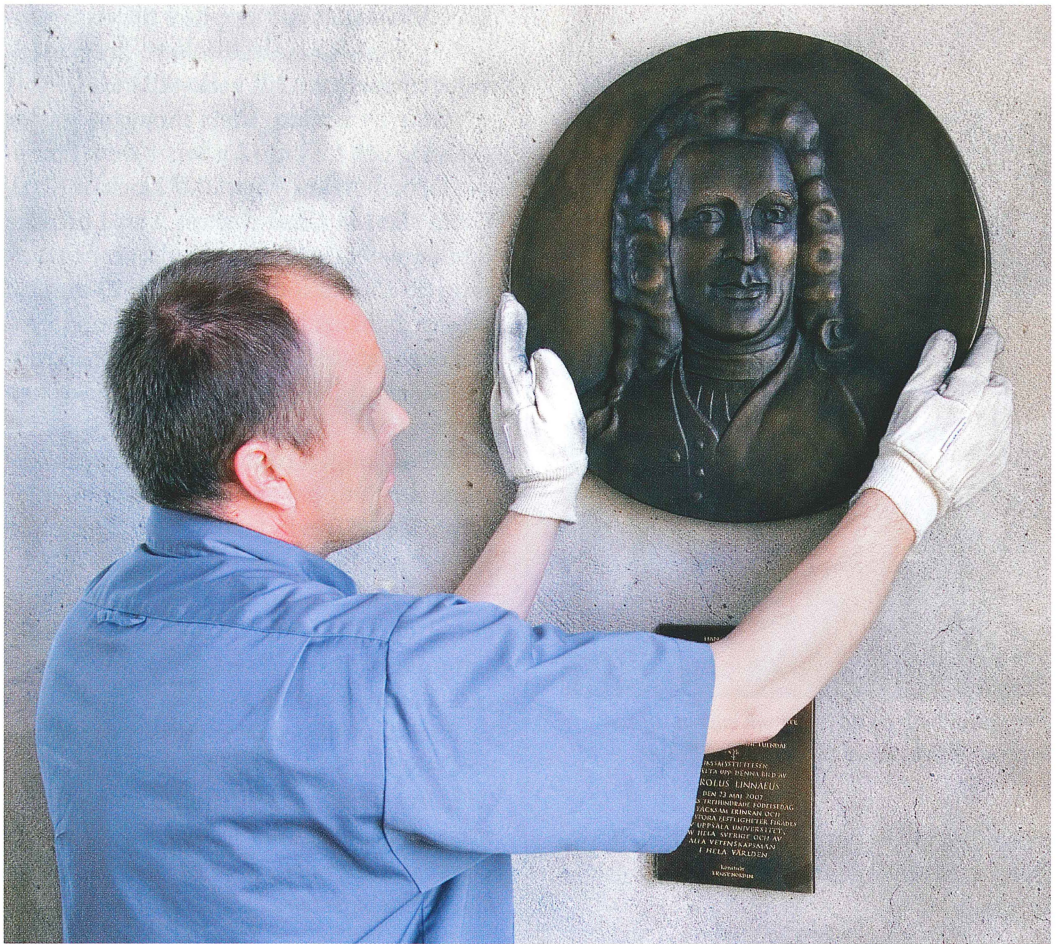
Urban Wall, Bravida TSM, sätter medaljongen på plats.

avporträtteras, inte en åldrad blomsterfarbror. I samråd med uppdragsgivarna valde Ernst Nordin en lämplig medalj i universitetets samling och därefter inleddes det konstnärliga skapandet.