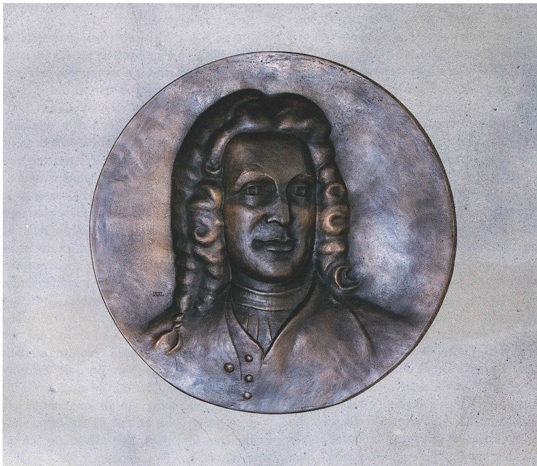
Linnémedaljongen i Kristinasalen i Uppsala slott. Diameter 47 cm. Konstnär Ernst Nordin.