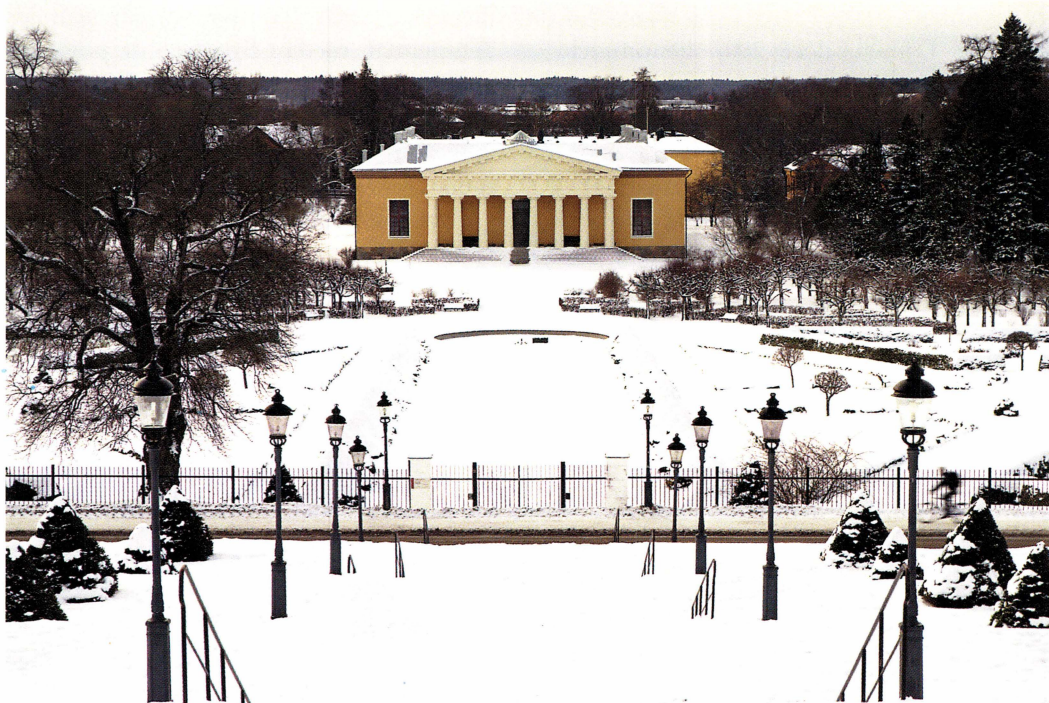
Linneanum i Botaniska trädgården.