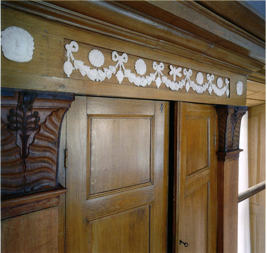
Thunbergssalens vitmålade bård med lagergirlanger, blommor, rosetter och sländor. Dekoren är utförd dels av trä dels av gips. Skadade delar ersattes och en försiktig bättringsmålning utfördes. Salens ytskikt rengjordes och behandlades med oljevax.