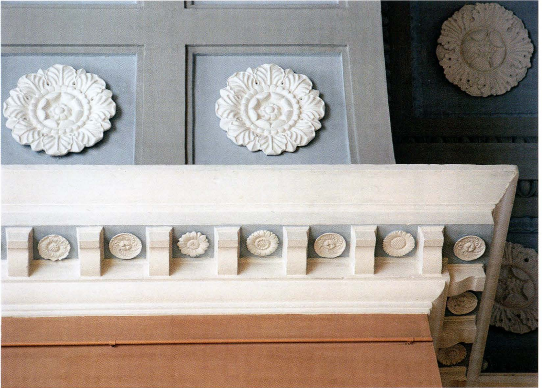
Gipsrosetterna i det kassettrade, tunnvälvda taket och i frisens undersida uppvisade varierande former.