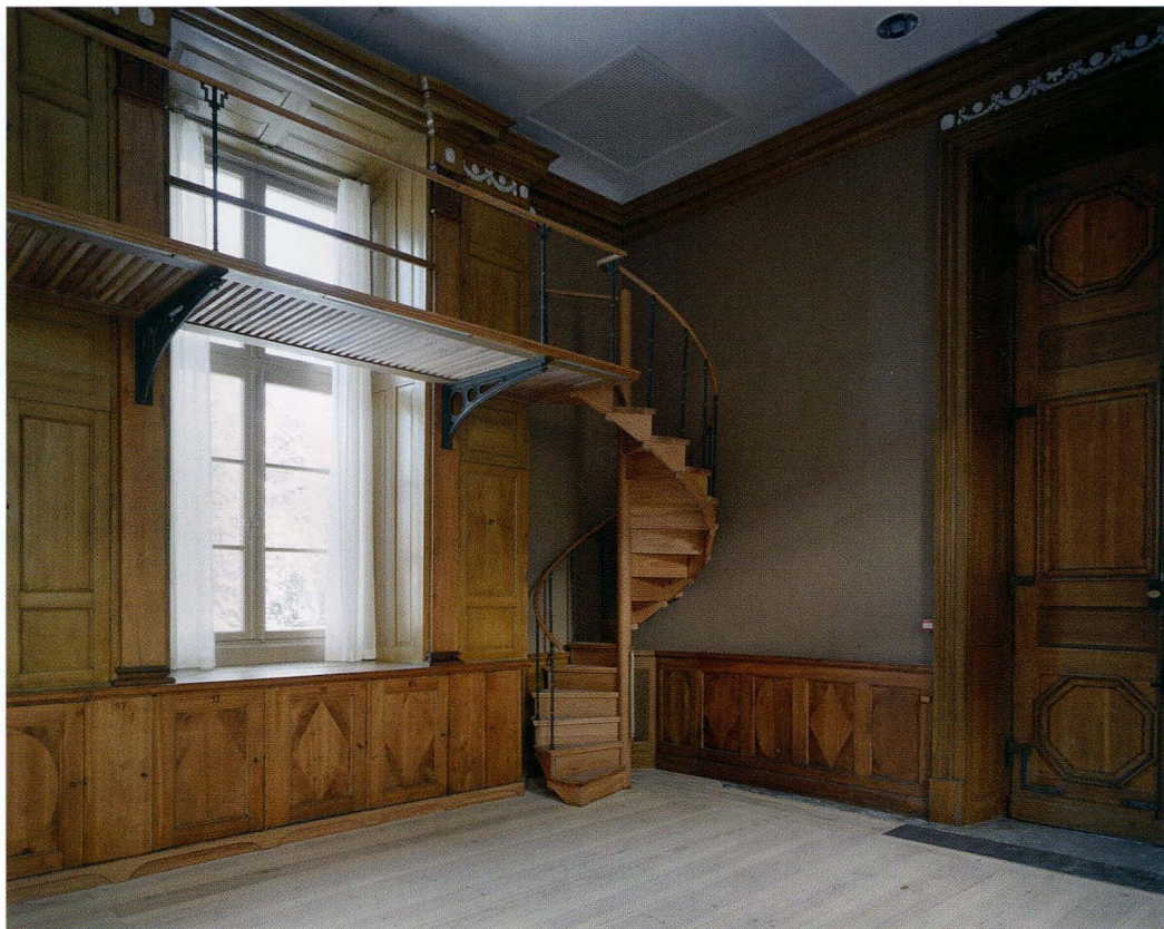
Thunbergssalen efter renoveringen. Ett nytt golv av trä har ersatt det tidigare, som var hårt nedslitet av hyllor och skåp. Spiraltrappan upp till läktargalleriet är nytillverkad liksom den kompletterande bröstningspanelen till vänster om dörren. Panelens illusionsmåleri, utfört av målerikonservator Cay Fredriksson efterliknar skåpdörrarnas fyllningar.