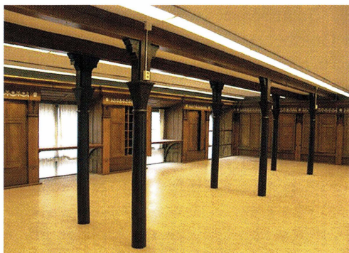
Thunbergssalens övre del med det entresolplan, som tillkom på 1980-talet för att ge mer hyllutrymme. Gjutjärnskolonnerna från 1890-talet.