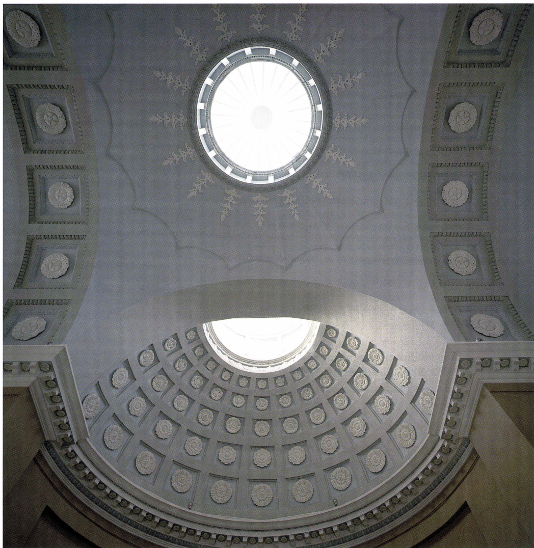
Linnésalens mittkupa och absidkupa efter rengöring och viss målningsbättring.