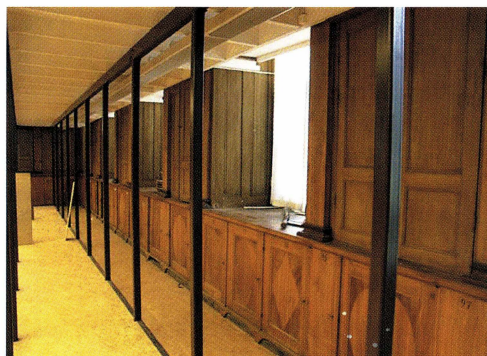
Thunbergssalens nedre plan med stödkonstruktioner för entresolplanet. De väggfasta skåpens nederdel, upp till fönsterhöjd, är ursprungliga. Skåpen är utförda av ek med rombiska och ovala inläggningar i päronträ. För inredningen av Thunbergssalen engagerades arkitekten Carl Christoffer Gjörwell 1802.

sågs genom ombyggnad av entrépartierna i flygelns valvöppning och hiss installerades mellan våningsplanen i kontorsdelen. Linnésalen innanför portiken tömdes på stora skrymmande skåp med växtsamlingar mm. En torrengöring av takets ytskikt med s.k Wishab-svamp fick den ursprungliga ljusa, klara blå färgtonen att framträda. Skadade stuck- och gipsornament i det välvda, kassetterade taket kompletterades och den glasade lanterninen över mittkupolen förnyades delvis eftersom inläckande vatten och kondens förorsakat omfattande fuktskador.