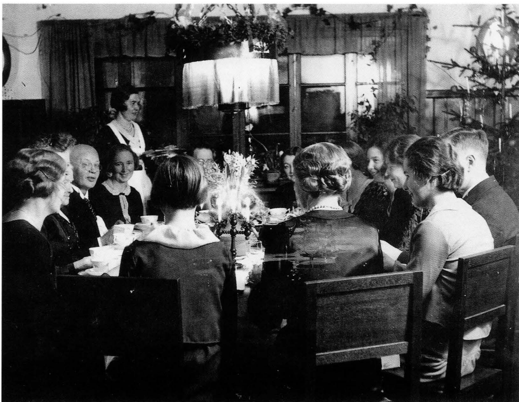
Jul, troligen på 1930-talet. Systrarna med gäster.

jag känner bäst, var färgen brun. Huset är i två plan med mansardtak, något valmat, och med brant takfall, öppen veranda och balkong. Det är uppfört av restimmer, har lockpanel, tvåkupigt tegel och två fyrkantiga spröjsade fönster med nio rutor på vardera sidan om verandan. Tre likadana fönster och en dörr ut till