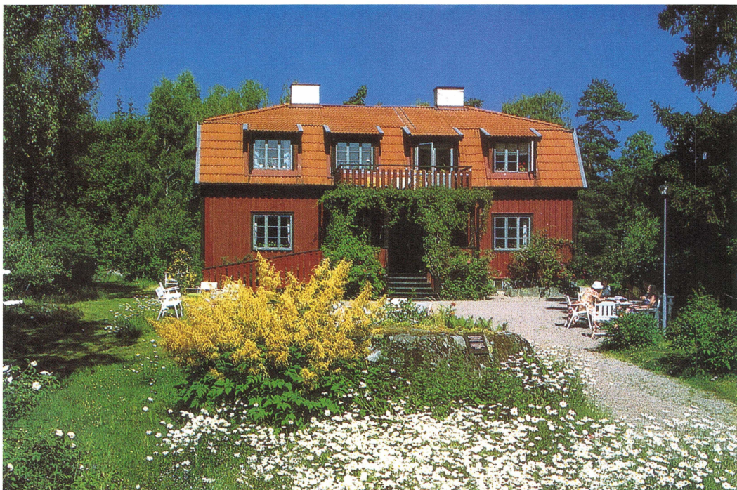
Stiftsgården Breidagård idag. Vykort.