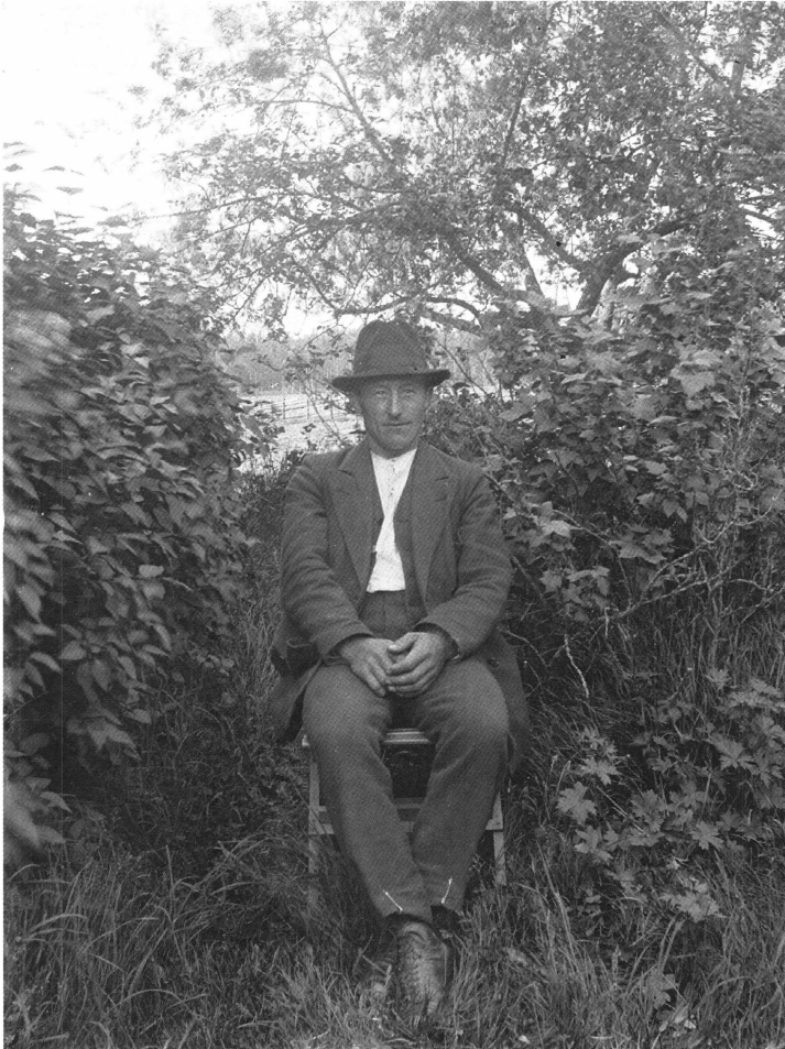
Bild 1. Ett av Klas Anderssons typiska porträtt med den avfotograferade personen satt mot en fond av grönska. I bakgrunden skymtar odlad mark och gårdesgård. Observera mannens lite drömska småleende och cykelklämmorna på hans byxor.