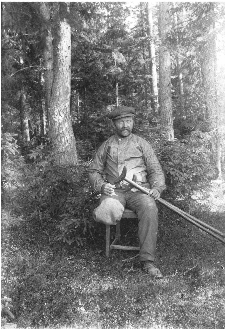
Bild 5. Skomakare som på 1920-talet vandrade i Viksta och Vendel socknar och lagade skor åt hus-hällen. Han stannade en vecka i taget på varje plats och sägs ha varit särskilt skicklig på kvinnliga fotbeklädnader. Sitt arbetsmaterial fraktade han på en liten kärra. Mannens handikapp ger bilden ett dramatiskt intryck, och det är lätt att spekulera. Vad har hänt med honom? Höll han på med samma yrke även innan han förlorade sitt ben? Varför valde han detta ambulerande levnadssätt? Hänvisad till kryckor och med en kärra att släpa på torde vandringstillvaron inte ha varit lätt.