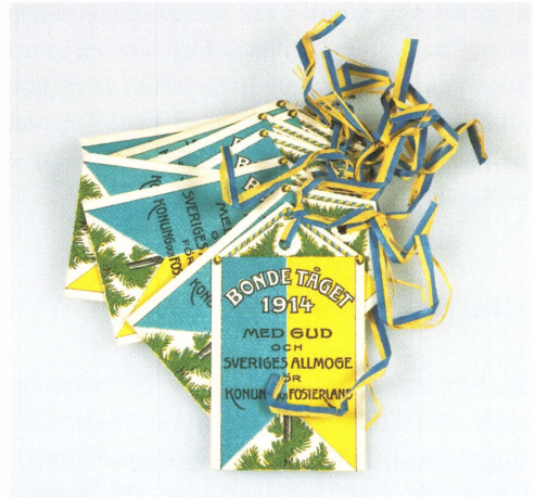
Numrerade märken för deltagare i bondetåget (inv nr UM31816).

Uno V Nybergs dotterson Folke Lindman skänkte delar av det material morfadern lämnade efter sig till Upplandsmuseet år 2003. I gåvan ingår bland annat fotografier, arkivhandlingar – både i original och som kopior – en affisch till minne av bondetåget, signerade porträtt av kungaparet Gustaf V och Victoria samt bondetågsmärken, varav ett med Uno V Nybergs namnteckning. En omfattande