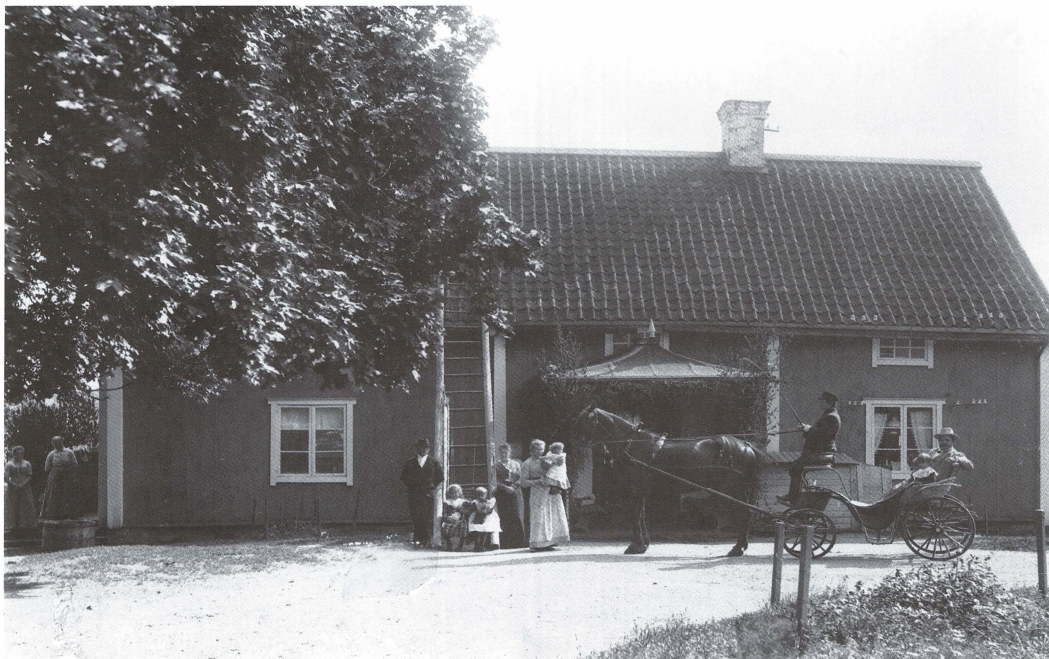
Familjen Nyberg med tjänstefolk på Stora Väsby, Almunge socken. Uno V Nyberg sitter i vagnen med dottern Signe.