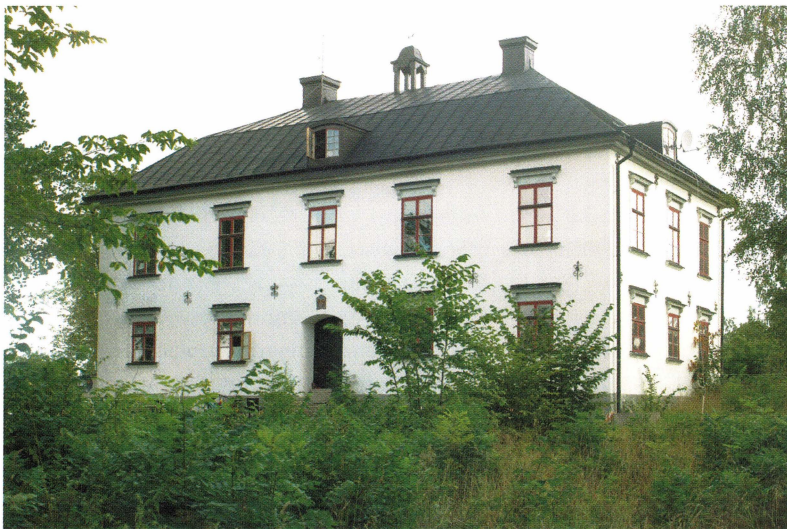
Långtora gård sommaren 2006.