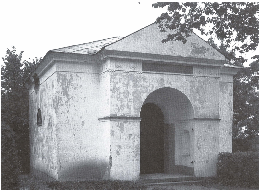
Spenska gravkoret som det såg ut innan renoveringen år 1954. Vid denna tid var byggnaden svårt förfallen, med stora läckage i plåttaket. Under loppet av 1800-talet hade byggnaden reparerats nödtorftigt, bl.a. hade gavelfrontonen på framsidan murats igen.

sarna i tidigare generationer främst bosatta i Östergötland, där de hade ett gravkor i Östra Skrukeby kyrka, en grav som Carl Gustafs farfars mor Beata Bonde hade köpt av familjen Ribbing år 1727. 8