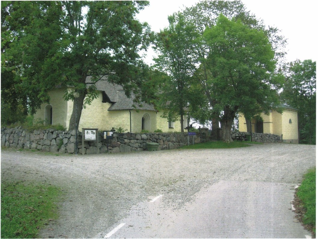
Gryta kyrka med det Spenska gravkoret sett från den förbipasserande gamla landsvägen "Erikskatan". Som synes har gravkoret en mycket framträdande placering, och är det första man lägger märke till då man nalkas kyrkan.