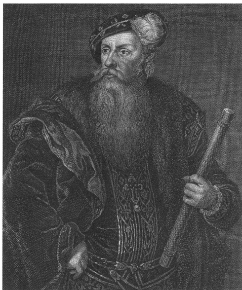
Gustav Vasa. Porträtt och foto Uppsala universitetsbibliotek.

inte inne i själva staden? Och fanns det något särskilt skäl till att möten hölls just vid Eriksmässan?