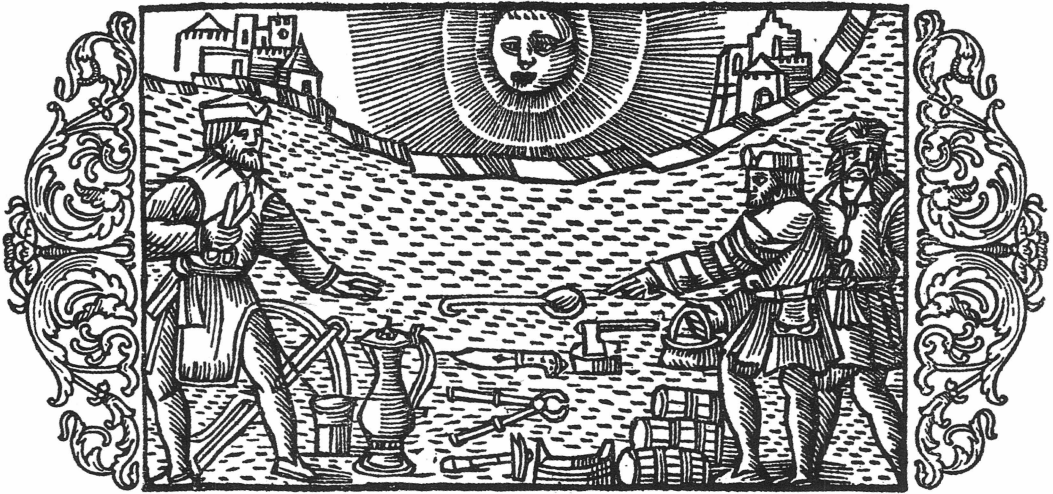
Handel på isen vid Distingsmarknaden, skildrad av Olaus Magnus.