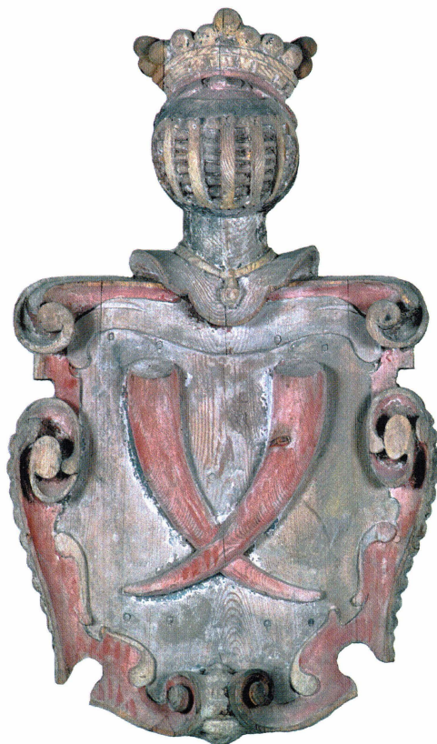
Slikten Kyles vapen i Rasbo kyrka.