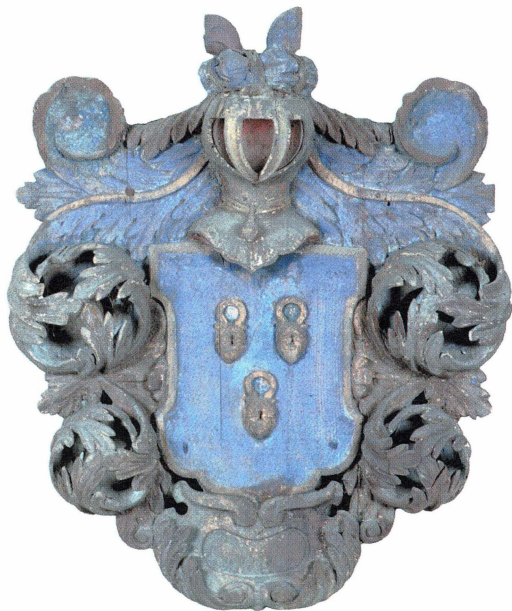
Släkten Gyllenkroks vapen i Rasbo kyrka.