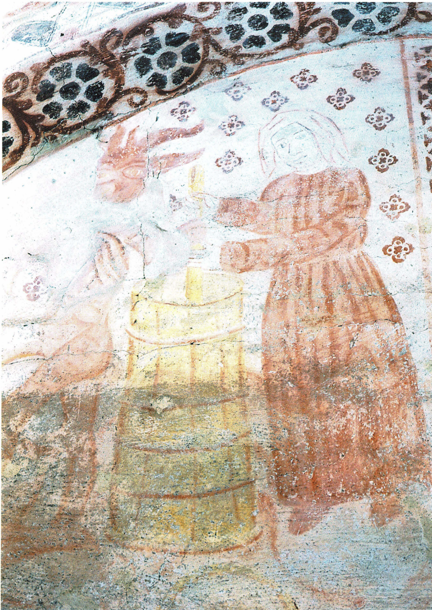
Bild 1. Knutby kyrka målades omkring år 1500. Den smörkärnande kvinnan är ung och har ett neu- tralt ansikts- uttryck. Hon är klädd i en rödak- tig veckad dräkt och har huvud- dok. Nedanför den stora kärnan syns konturerna av ett grädd- sättningskärl.