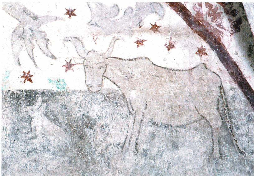
Bild 2. Ko i Österlövsta kyrka med den gamla svenska lantrasens typiska lyrformade horn. Till vänster syns en liten, vit och harliknande bjära. Kyrkan målades år 1468 av Anders Eriksson.

och hade som sådan betydande status. Men tillgången på grädde som kunde kärnas var knapp; de kor som fanns i Sverige under senmedeltiden och 1500-talet mätte knappa metern i mankhöjd och gav en liten och varierande mjölkavkastning. Korna på de bevarade kyrkmålningarna är små och magra och har lantrasens lyrformade horn och små juver – mycket olika våra dagars högbenta, stinnjuvrade mjölkproducenter i Bregottfabrikerna (bild 2). Om därför en gård plötsligt började producera mer smör än vad som ansågs skäligt i förhållande till deras koinnehav, kunde misstankar om trolldom uppstå.