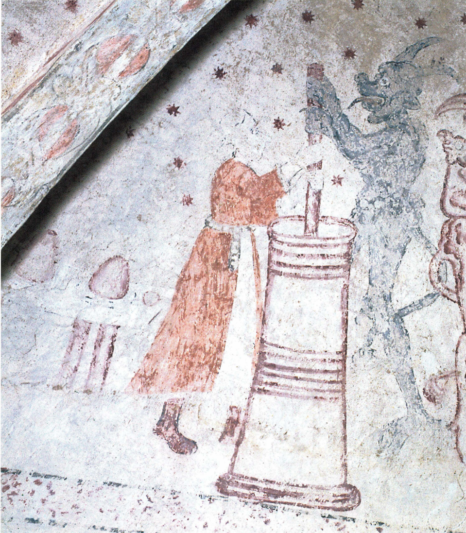
Bild 8. I Morkarla kyrka är kärnan överdimensionerad i förhållande till kvinnan, kanske för att understryka vilka stora mängder grädde det är frågan om. I bakgrunden syns ett bord där två färdiga, äggformade smörklimpar står framställda på platta, till synes enkla tallrikar.