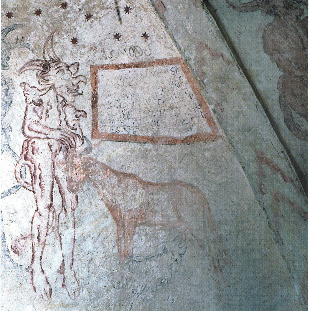
Bild 5. Bjärans behandling ansågs kunna lämna märken på kon. Där den trampat på kon syntes hårlösa fläckar, och dess hårdhänta sugande kunde lämna sår på juvret. Ett ovanligt högbent väsen med girigt gapande mun avbildas i Morkarla kyrka. Målningarna är från 1584 och därmed de yngsta i materialet. Djävulen är här namngiven – "Asmodeus" står att läsa till höger om hans huvud.