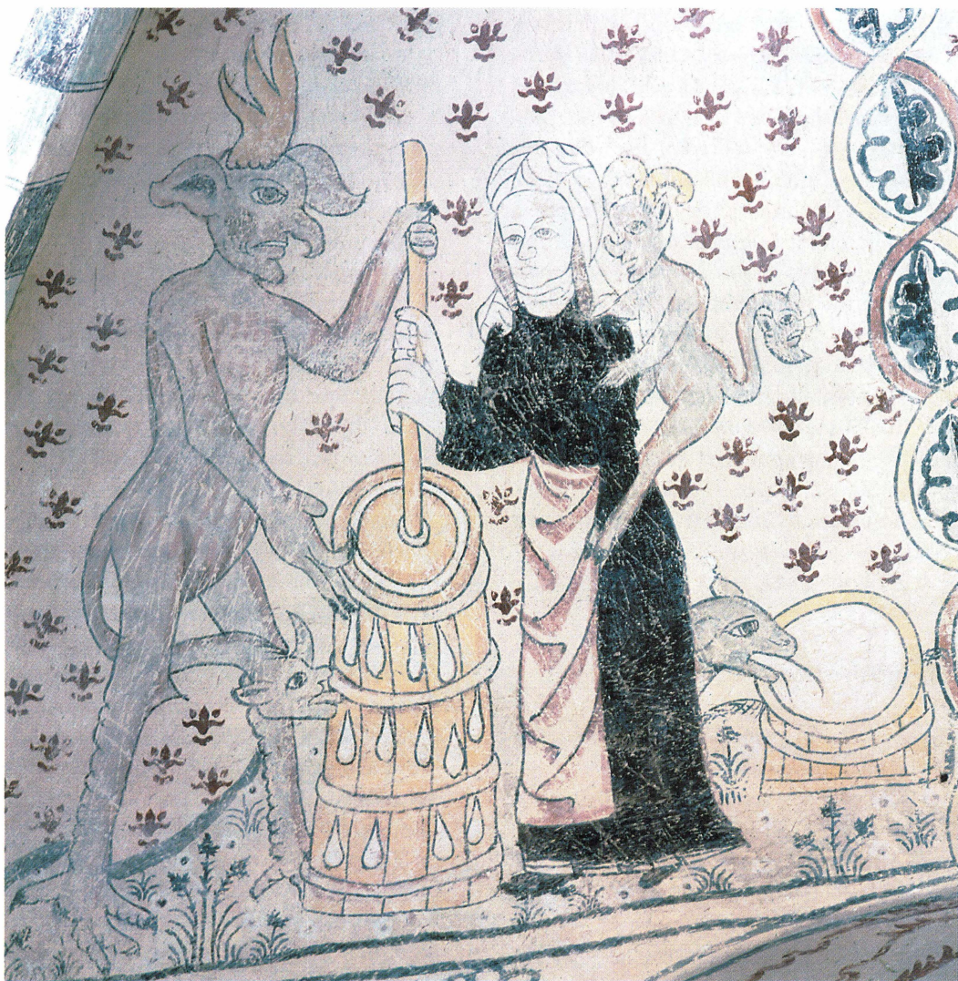
Bild 6. Bilderna i Söderby-Karls kyrkas vapenhus från omkring 1500 är ovanligt välbevarade. Till höger i bild ses bjären spy upp mjölken, men själva huvudscenen är förstås smörkärningen. Bondkvinnans kraftiga händer kärnar samfällt med den sexuellt utmanande djävulen. Kärnan är mycket detaljrikt utförd och är den enda i materialet med tydligt avbildat lock.