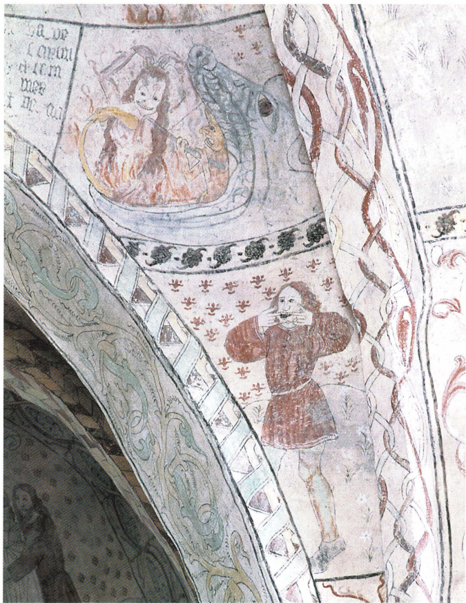
Bild 22. En förtappad kvinna med dödskalleliknande grin i helvetsgapet i Knutby. Ur hennes bröst kommer ormen, symbolen för syndafallet och kvinnans förbund med det onda. Det långa, utslagna håret understryker förtappelsen. En djävul har satt en järnhake i hennes bröstorg. Under kvinnan står en man och grimaserar; nu kan hon inte längre fresta honom att begå synder.

Bild 23, motstående sida: Två kvinnor träder över en gryta i Dannemora kyrkas vapenhus. I många senmedeltida texter varnas för kvinnans opålitlighet och trätgirighet, inte minst sinsemellan.