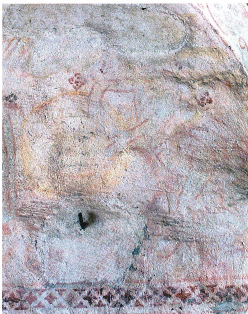
Bild 9. Djävulen ältar smör i Knutby. Bilden är delvis utplånad, men armrörelserna och tråget med smör gör arbetsmomentet igenkänningsbart.