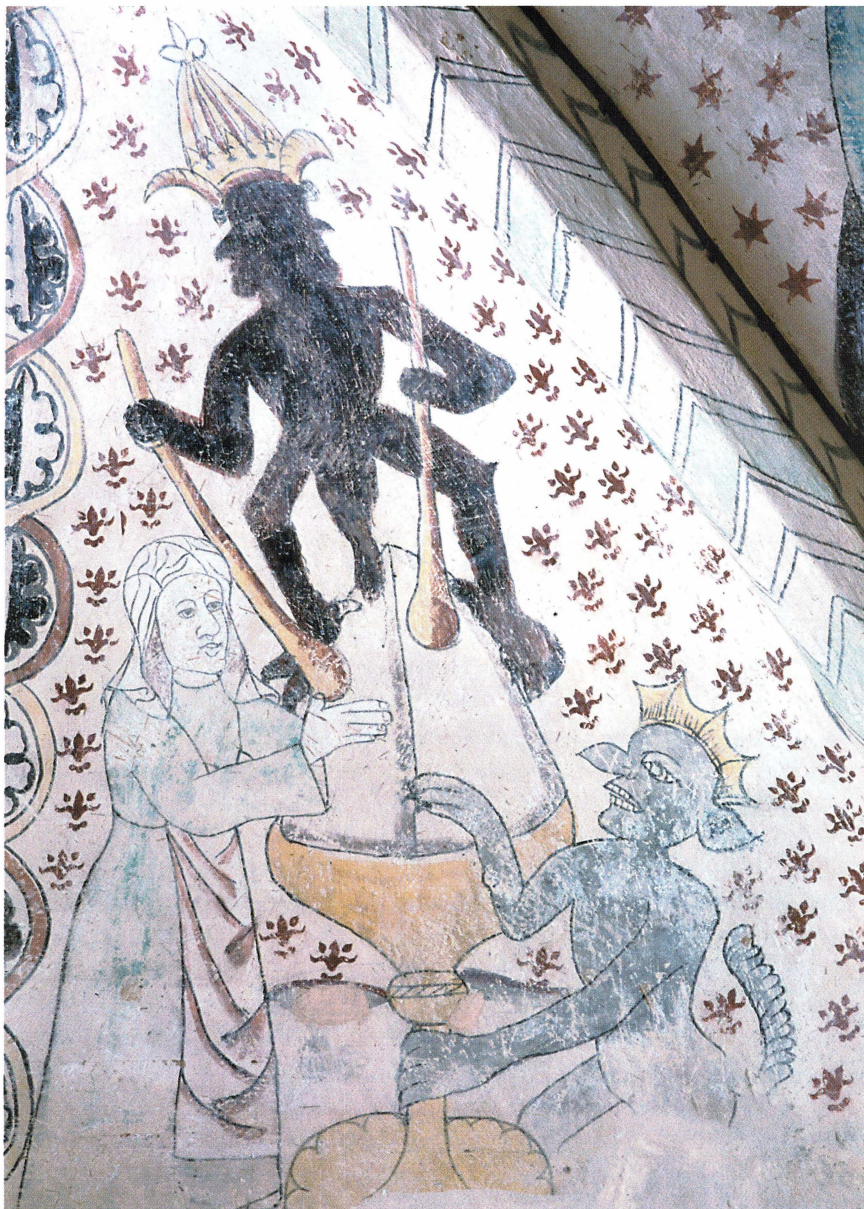
Bild 17. Inte nog med att den soarta djävulen i Söderby-Karl har två träspadar när han lägger upp smöret; även hans kraftiga organ tas till hjälp. Kvinnan har lagt sina båda händer om smörtoppen för att släta ut smöret ytterligare.