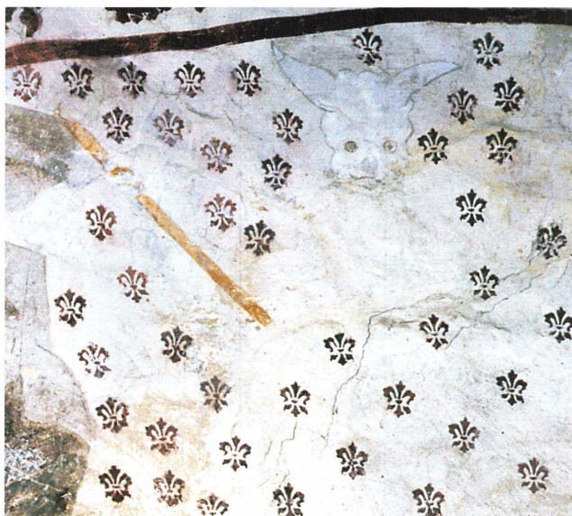
Bild 21. Kvinnans straff framställdes antagligen i flera av kyrkorna än vad som är bevarat. I Österlövsta syns huvudet och högra handen av en djävul, som håller en kärnstav (jämför straffscenen i Dannemora). Hela det stora fältet till höger om djävulshuvudet är nu täckt med schablondekor, men har mycket väl kunnat rymma bilden av en kvinna som rids till helvetet.

ett helvetsgap kan urskiljas. I Roslagsbro och Österlövsta ses direkt till höger om bordet fragment av en djävul, som verkar fösa något framför sig med något som liknar en kärnstav (bild 21, Österlövsta).