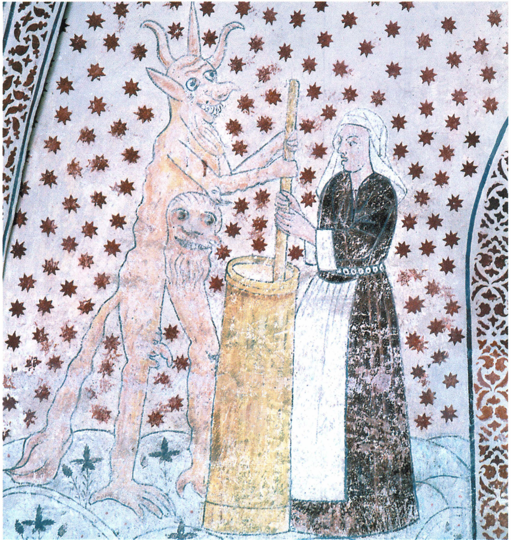
Bild 7. Kvinnan i Dannemora är som de andra smörkärnande kvinnorna välklädd och bär den gifta kvinnans huvuddok. Kärnan är meterhög och rymlig. Kyrkan målades omkring 1520 men utsattes för en hårdhänt restaurering 1892, vilken kan ha utplånat kärnans laggband.