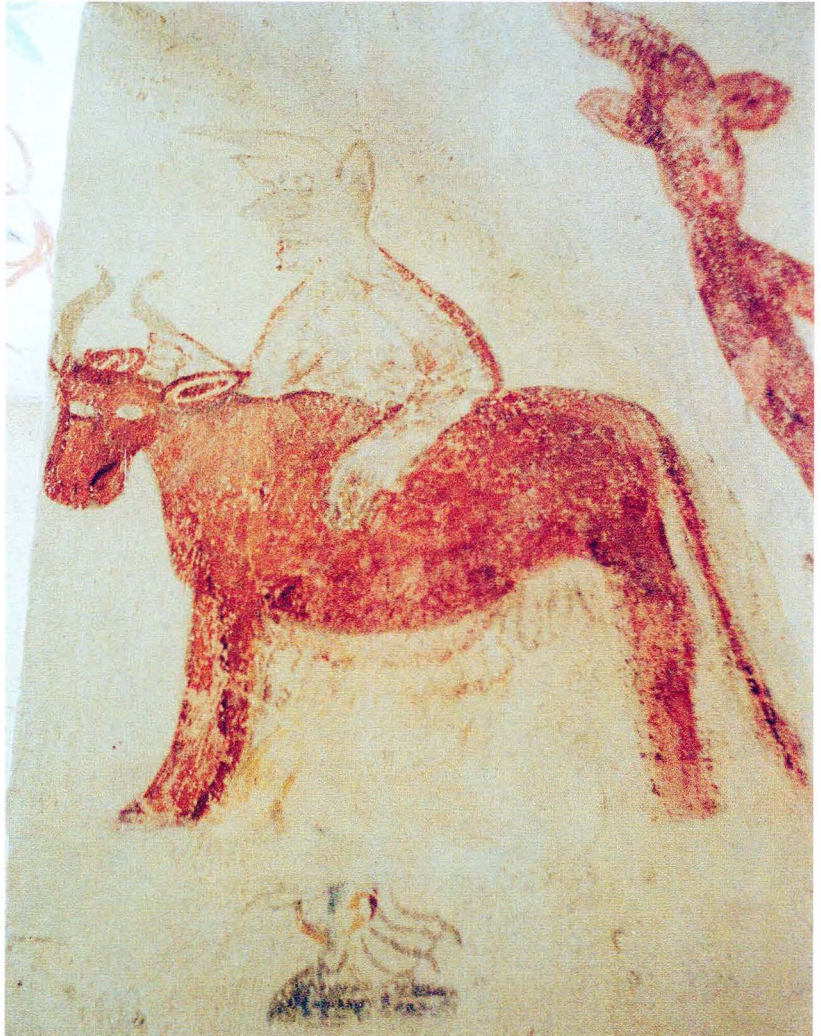
Bild 4. Endast de klotförsedda baktassarna är kvar av bjären på denna bild, men det är tydligt att en förvandling har skett. Djävulen håller ett fast grepp om den röda kons horn med den ena handen, den andra håller han mot dess sida.