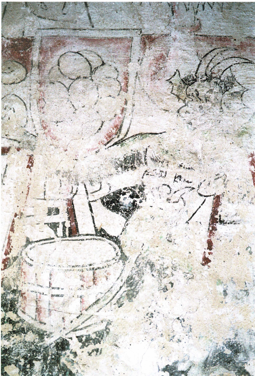
Bild 11. I Täby har ältningstråget en ränna där kärnmjölken kan rinna av. På golvet under bordet står ett speciellt kärl och samlar upp den. Observera djävulen med dubbla ansikten, som har greppat en färdig smörklimp för vidarebefordran till smörtoppen.