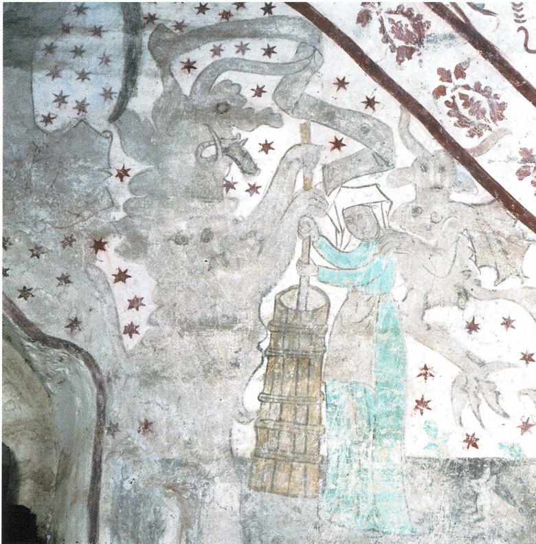
Bild 27. Över huvudet på djävulen och kvinnan i Österlövsta svävar ett språkband, med nu tyvärr oläslig inskrift. Detta språkband återkommer i flera av kyrkorna, och kanske tyder det på att smörkärningshistorien under senmedeltiden uppfördes som drama på kyrkbacken?

kan se att kor, smörkärnor, ältningsstråg och smörfat liknar deras egna inskrifter denna del av budskapet. Därigenom kan bilderna också ge oss värdefull information om redskap för och moment i smörtillverkningen, om kornas utseende och så vidare. Givetvis måste de dock prövas, precis som allt annat källmaterial, mot andra källor som arkeologiskt, historiskt och etnologiskt material.