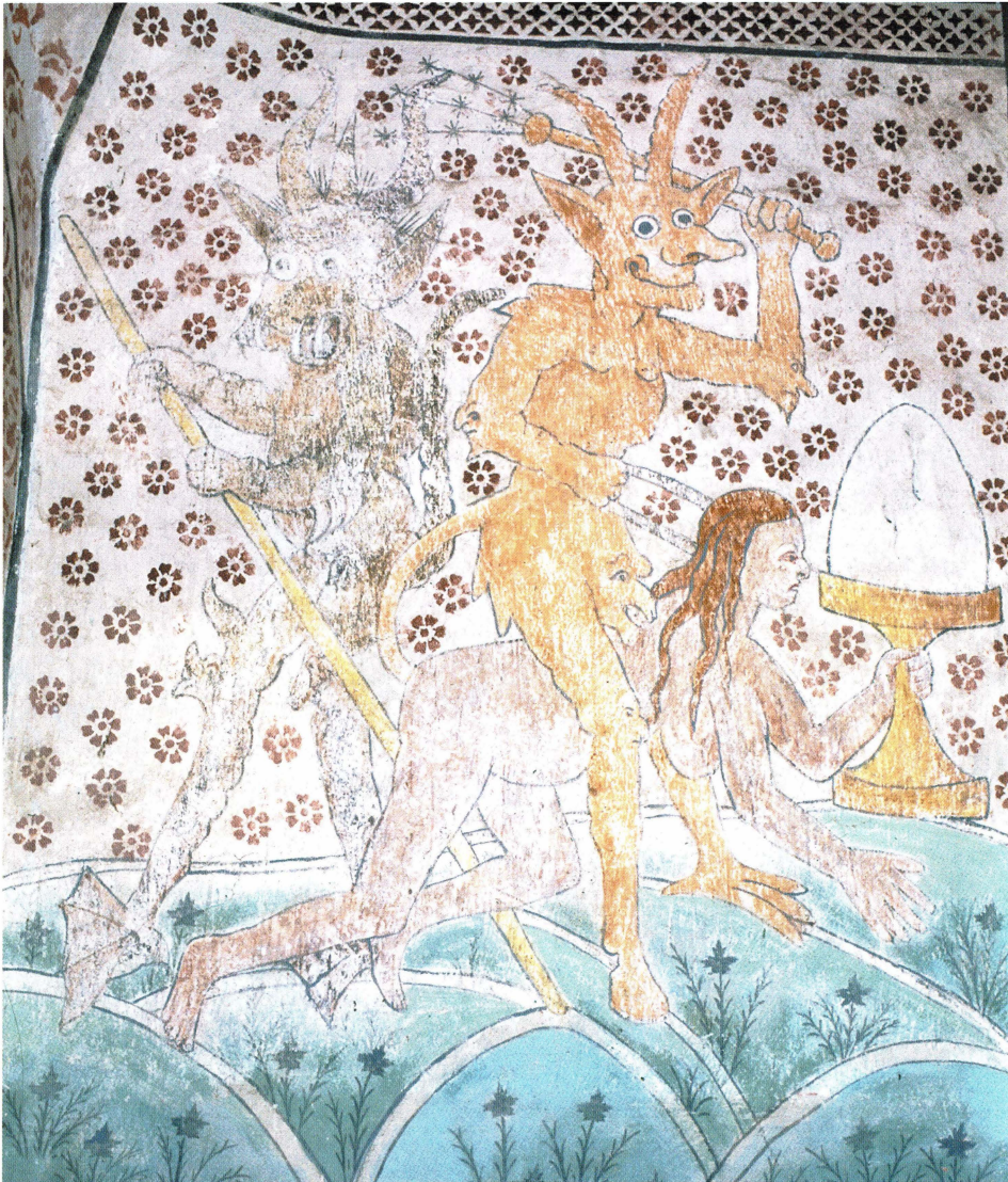
Bild 18. Huvuddoket och kläderna är avlägsnade, och huvud och kropp blottade när den tjuvmjölkande kvinnan rids av sin forna samarbetspartner. I handen håller hon symbolen för sin missgärning. Även kärnstaven i den andra djävulens händer minner om brottet. Dannemora kyrka.