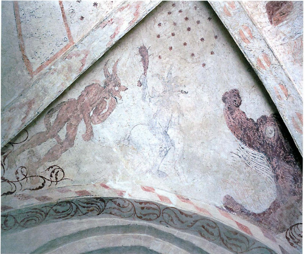
Bild 19. I Morkarla har kärnstaven ersatts av spikklubbor, men temat är detsamma; en helvetesritt. Det brinnande odjursgapet åskådliggör de plågor som stundar.