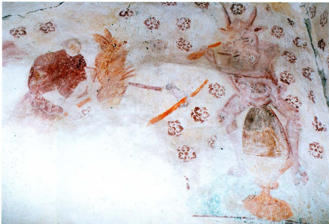
Bild 16. Den nakna djävulen har grenslat smörtoppen i Österunda kyrka. I sin vänstra hand håller han en enkel mugg av lera eller trä, och i den högra en sked. Kanske är det en magisk dryck han erbjuder den annalkande häxan?

arna i de undersökta senmedeltida kyrkorna, Knutby, saknas fotfatet. Där står istället en hel rad av de äggrunda klimparna på en hylla (bild 15). Tillkomsttiden för dessa målningar är omkring år 1500. I Morkarla kyrka, vars målningar är daterade till 1584, är smöret upplagt på enkla flata tallrikar som står på ett bord. Smörklimparna är också betydligt mindre än sina föregångare på fotfaten. (se bild 8 ovan)