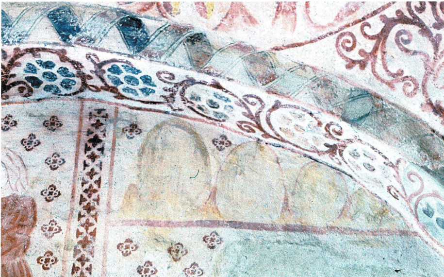
Bild 15. Äggrunda smörklinpar uppradade på en hylla i Knutby. Genom att ge klimparna gradvis minskande storlek har konstnären utnyttjat bildytan maximalt.