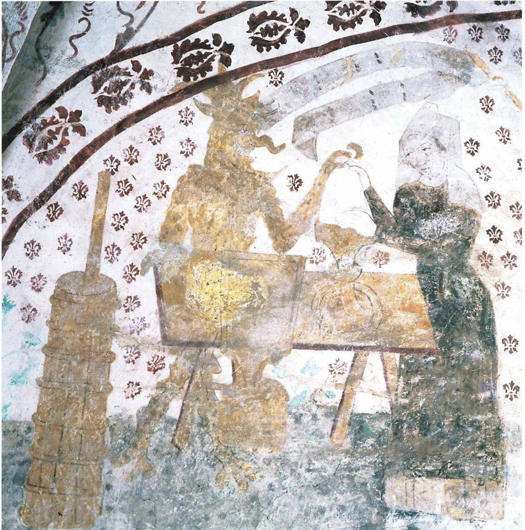
Bild 12. Ett tråg med ränna finns även avbildat i Österlövsta kyrka. Kvinnan och djävulen hjälps här åt att släta till smörtoppen med händerna; i en äktenskapslikande gest har den leende djävulen fattat hennes hand, och hon möter förtroligt hans blick. Smörfat på fot avbildas på de flesta av smöruppläggningsscenerna och är ofta som här odekorerade.