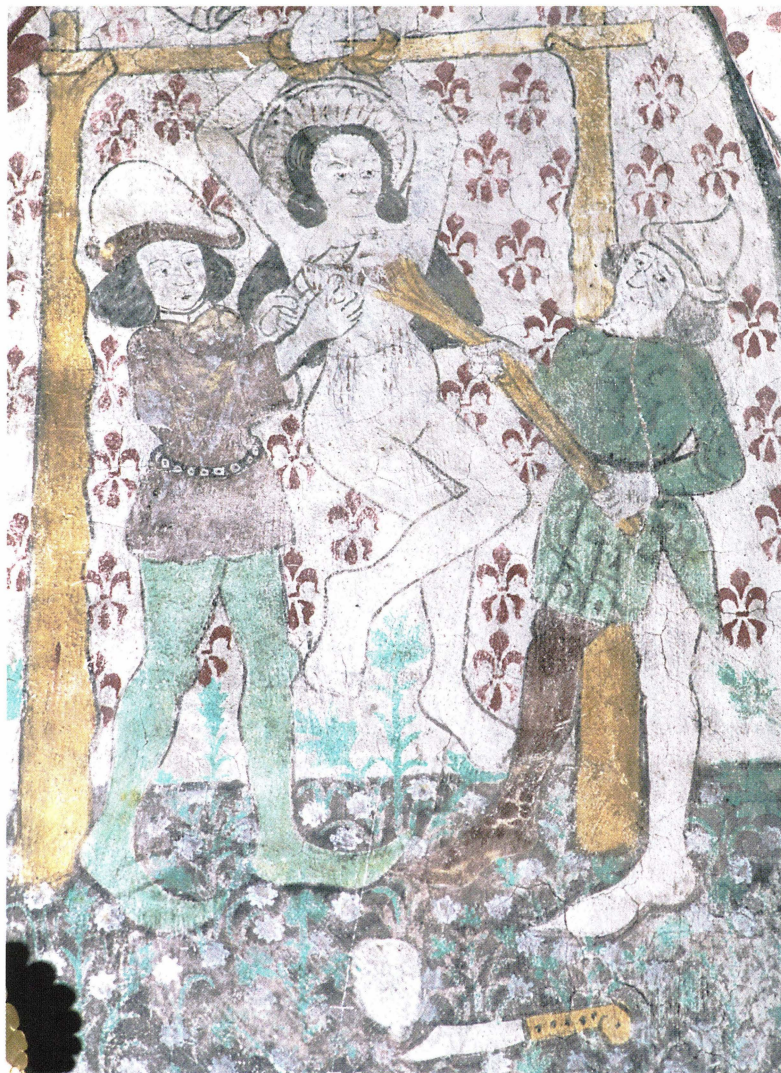
Bild 20. I Roslagsbro kyrka framställs avancerad kvinnotortyr då S:ta Agata får sina bröst avskurna av två män. I de kvinnliga martyrhelgonens legender är det inte ovanligt med inslag av sexualiserat våld, men bilden i Roslagsbro är ovanligt brutal. Föga förvånande brukade S:ta Agata återopas för lindring av smärtor i bröstet.