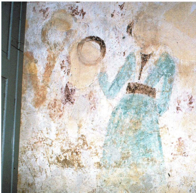
Bild 26. I vapenhuset i Österunda finns också ett motiv där en kvinna håller upp en spegel framför ett benrangel med spegel. Hon ser sig själv som död. Motivet är fragmentariskt och delvis dolt av ett skåp, men intressant inte minst i ljuset av hur den smörkärnande kvinnan intill framställs.

nyckelreplik i form av en pergamentremsa. Det är en spännande tanke: kanske uppfördes historien om den tjuvmjolkande kvinnan på kyrkbackarna under senmedeltiden? Vad som talar för detta är också att det ovan nämnda dramat Judas Redivivus av många forskare anses vara en omarbetning av ett äldre medeltida drama.