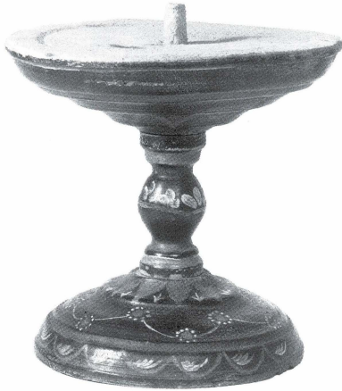
Bild 14. En smörstake från Delsbo socken i Hälsingland, svarvad och oljemålad. Lägg märke till ansvällningen på foten, som även finns i kyrkmålningarnas smörfat. Denna smörstake förvärvades 1880 av Artur Hazelius till Nordiska museet, men är troligen äldre än så.