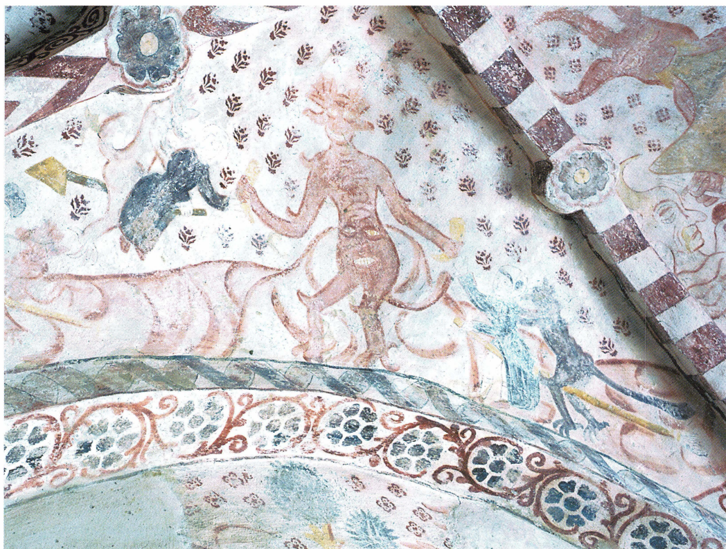
Bild 24. Häxor färdas genom luften till Djävulen. Bakom varje kvinna sitter en smådjävul. Kvinnan till höger har kjolen uppdragen och blottar sina strumpklädda ben, ett tydligt tecken på sexuell lössläppthet. Ännu sitter dock huvudbonaderna på plats. Målning i Knutby kyrkas vapenhus.