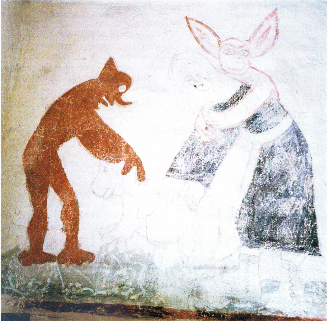
Bild 3. Detta motiv finns bara i Färentuna kyrka och föreställer troligtvis hur bjären sänds iväg. Lägg märke till den säckliknande baddelen. Vapenhusets målningar dateras av Nilsén till 1460, men kan enligt Bengt Söderberg vara från 1440-talet och influerade av Vadstenaskolans måleri. Detta är intressant, eftersom flera exemplar av skriften Homo conditus fanns i Vadstenaklostrets bibliotek. Motivet skulle i så fall vara det äldsta kända i Sverige.